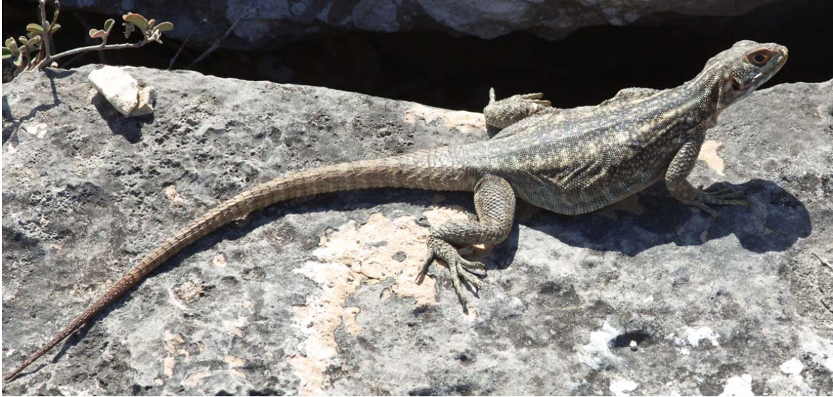
Echse in Spezial-Reservat Cap Sainte Marie