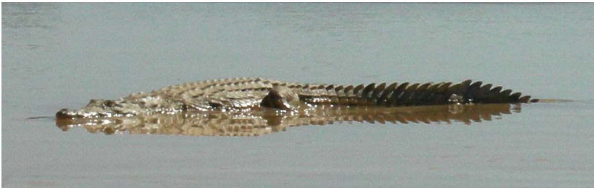
Frei lebendes Krokodil im Fluss Onilahy bei Bezaha