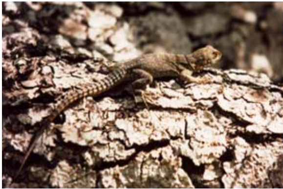
Echse (Oplurus spec)

☺☺ Im zoologischen Garten von Tana, im Berenty-Park , in der Croc-Farm (Krokodil-Farm) beim Flughafen von Tana und in Gruben in gewissen Hotels werden Krokodile gehalten.