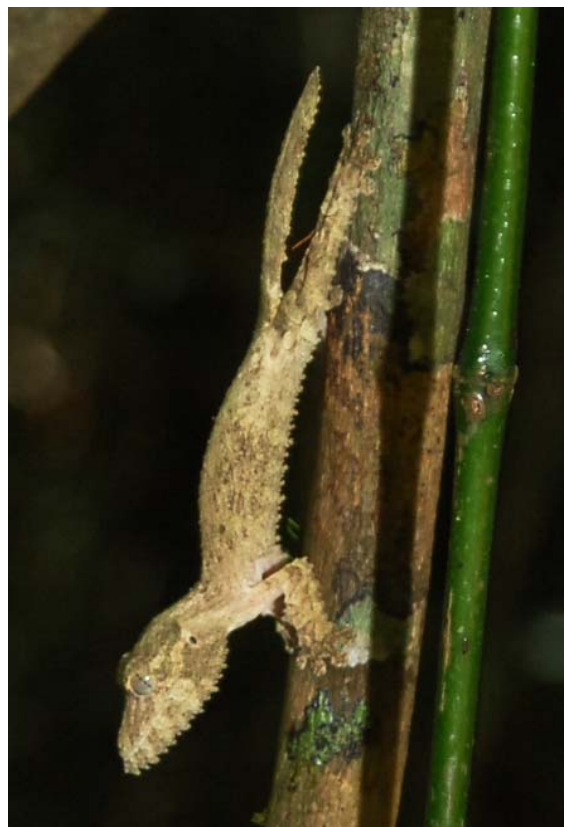
...durch uns aufgescheucht im Forêt d'Ambre