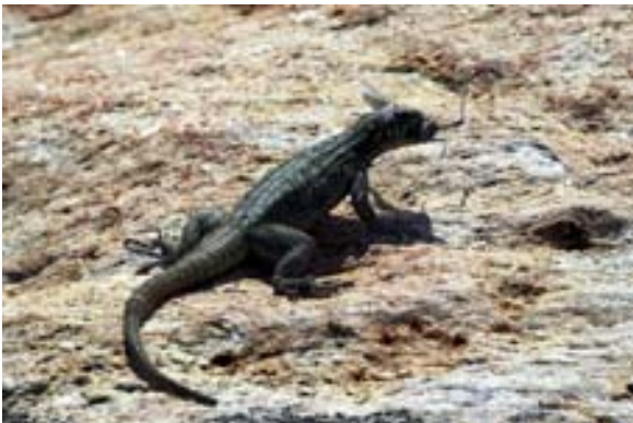
Schwarzer (Oplurus quadrimaculatus) mit Beute beim Lac Anony