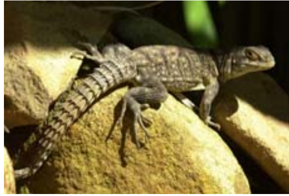
Leguan auf Steinen (Oplurus spec)