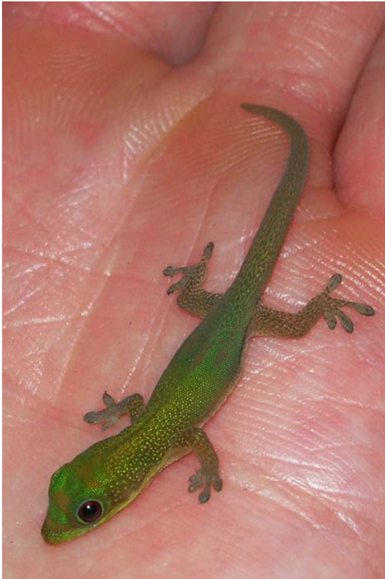
Jungtier der Taggecko-Art Phelsuma laticauda laticauda im Masoala – Gebiet