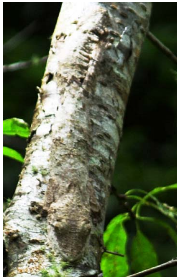
Plattschwanzgecko (Uroplatus) im Forêt d'Ambre