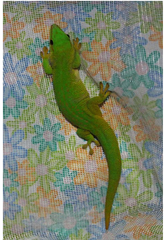
Gecko im Zimmer des Hotels in Ambohitsara Vermutlich Taggecko-Art Phelsuma magagascariensis magagascariensis