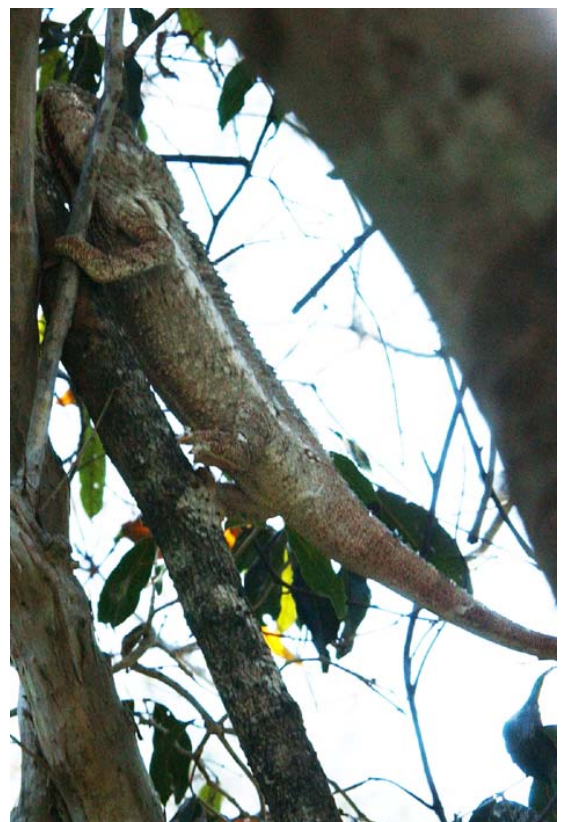
...grösste Chamäleon im Park von Zombitse