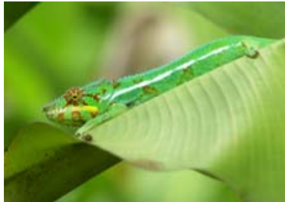
Chamäleon auf Nosy Be