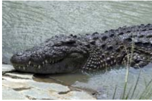
...leben über 150 Krokodile