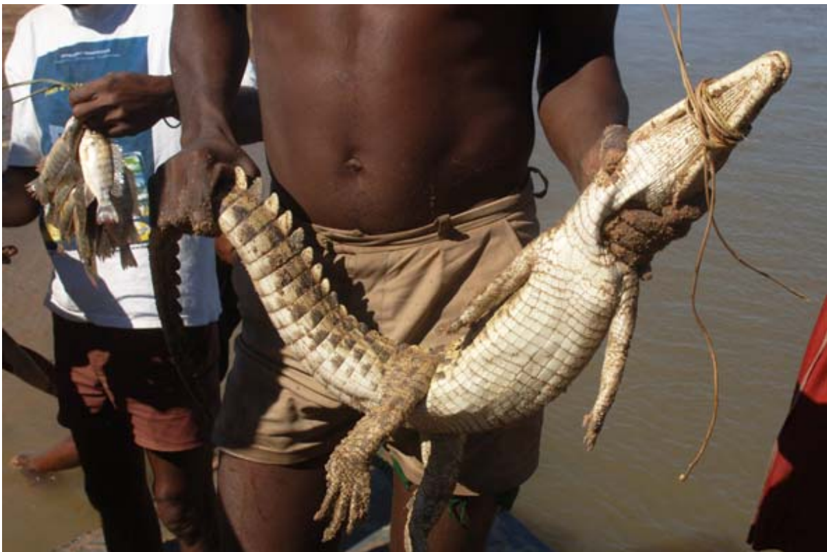
Fischer fangen mit ihren Netzen ein junges Krokodil im Mangoky