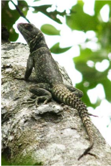
Echse im Palminarium (Oplurus spec)