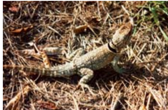
Halsband-Eidechse bei lfaty (Oplurus spec.)