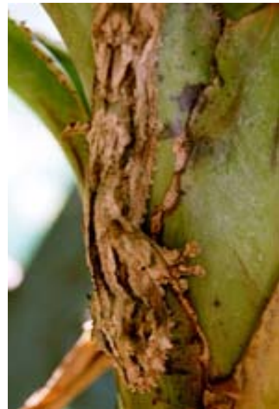
...Weltmeister im Tarnen