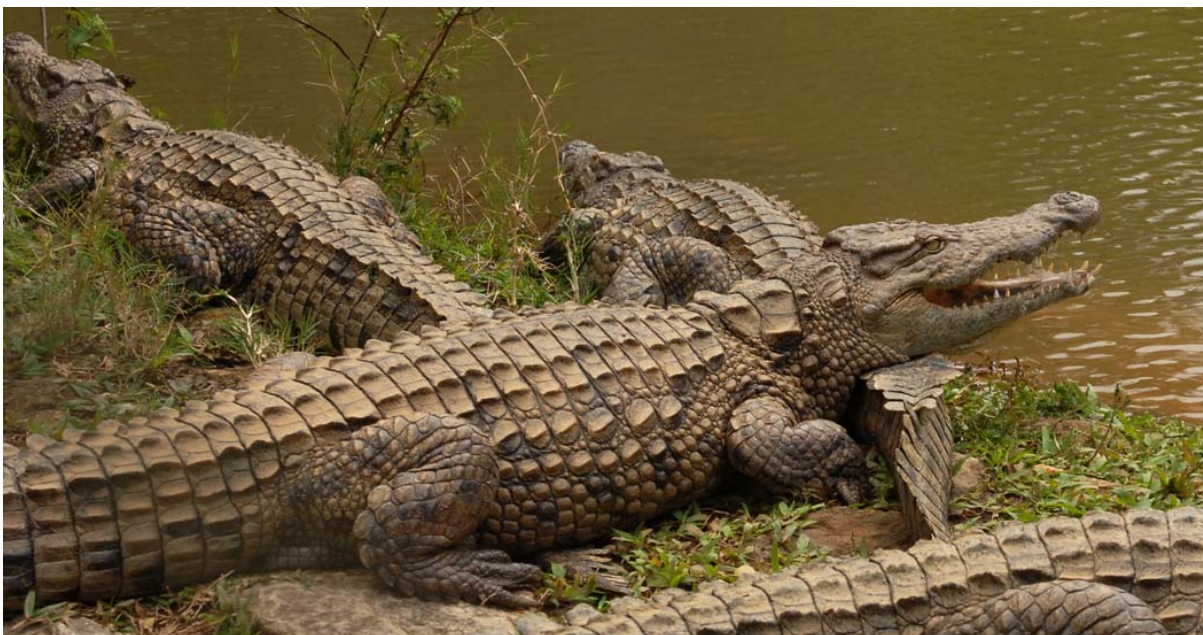
Krokodile im Privatpark d'Heaulme in Fort-Dauphin