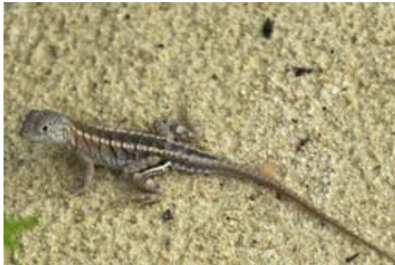
Schneller Läufer im Sand von lfaty ( Chalorodon madagascariensis )