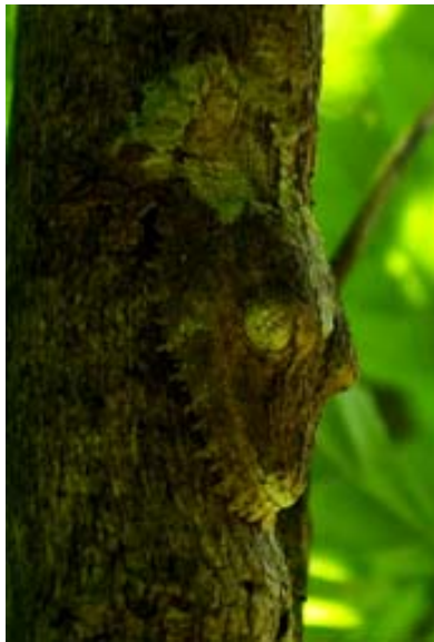
... Plattschwanzgecko , der...