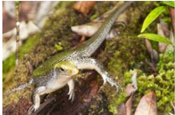
Echse in Fotopose im Palminarium (Zonosaurus spec.)