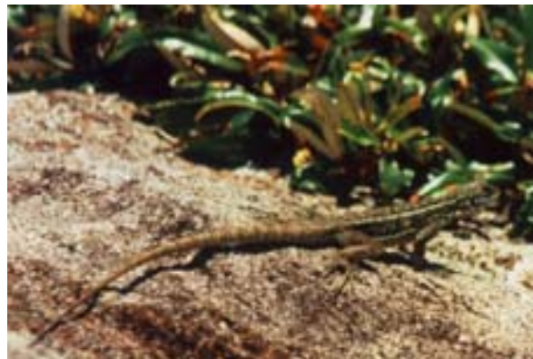
Gut getarnte Eidechse (Oplurus spec)