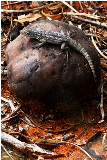
Echsen im Park Reniala...