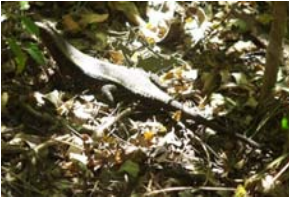
Schildchse (Zonosaurus spec.) bei Ankify