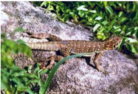
Eidechse im Park von Isalo (Oplurus spec)