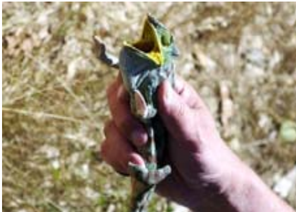
Chamäleon bei Mampikony an der RN 6