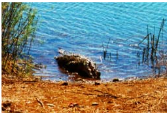
Krokodil im See bei Anivorano Nord