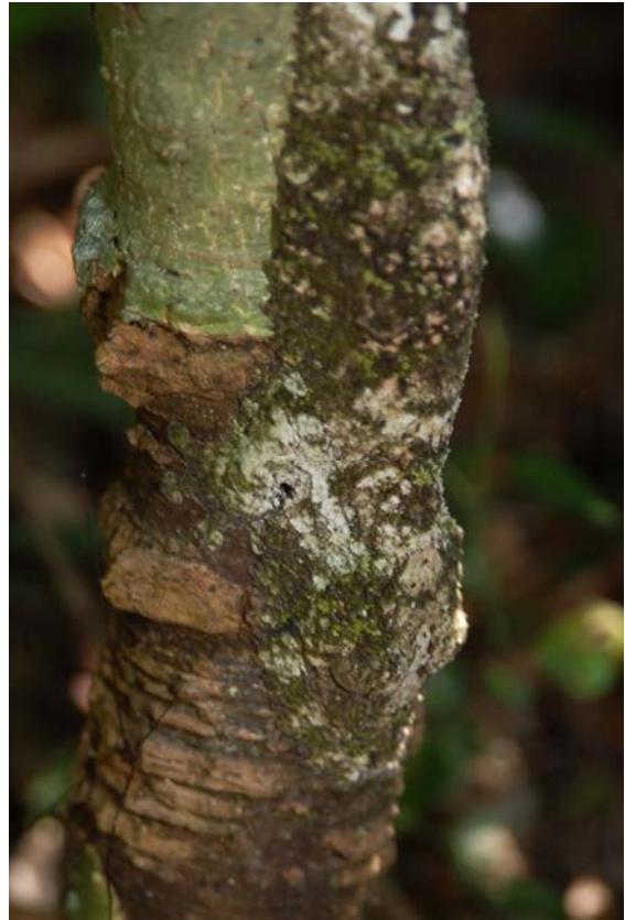
Plattschwanzgecko ( Uroplatus ) im Forêt d'Ambre