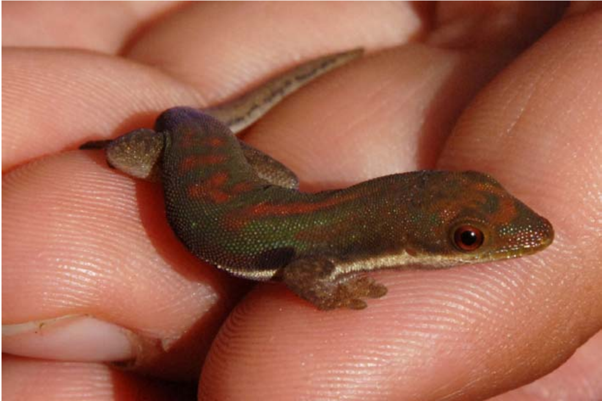
Taggecko-Art Phelsuma quadriocellata parva im botanischen Garten des Hotels Centrest in Ranomafana