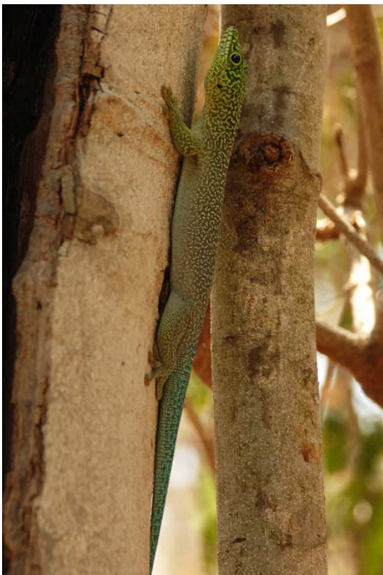
Grüne Echse und das von uns je gesehene...