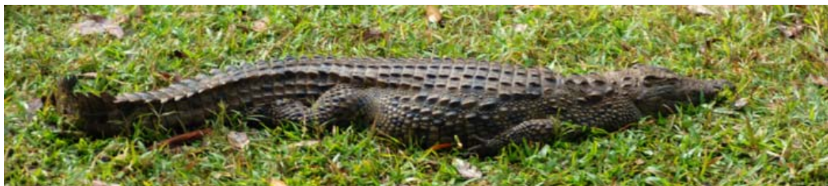
Krokodil im Zoo des Hotels Vakâlona Lodge in Andasibe