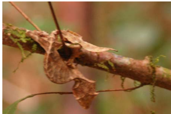
Plattschwanzgecko (Uroplatus) in Park von Ranomafana