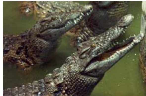
Fütterung von Krokodilen

▶ Siehe auch unter „ Exportgenehmigungen “, unter „ Glossar “ – mamba , voay , unter „ Hotels “ – Pangalanes , unter „ Naturschutzparks “ – Ankarana , Berenty-Park , Croc Farm , Nahampoana , unter „ Ortschaften “ – Anivorano-Nord , Brickaville , Marovoay , unter „ Reiserouten “ – Kleine Nord-Tour , Grosse Nord-Tour , Süd-Nord-Tour sowie unter Zusatzprogramm Diego-Suarez , Fort-Dauphin , unter „ Sportaktivitäten “ – Baden/Schwimmern , unter „ Souvenirs “ – Lederartikel , unter „ Tiere “ – Chamäleons und unter „ Touristik-Karten “ – Norden .