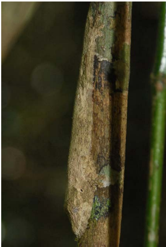
Plattschwanzgecko ( Uroplatus ) in Tarnstellung und...