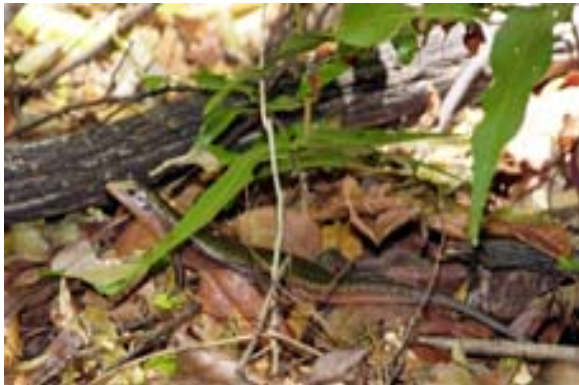
Eidechse im Park von Ankarana West