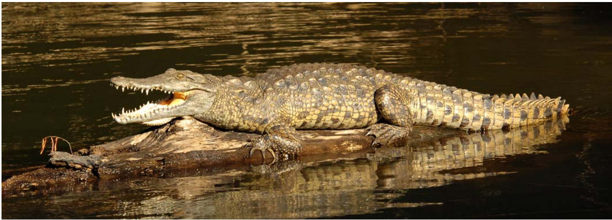
Kleines, auf schwimmendem Holz sich sonnendes Krokodil in See von Ankarafantsika