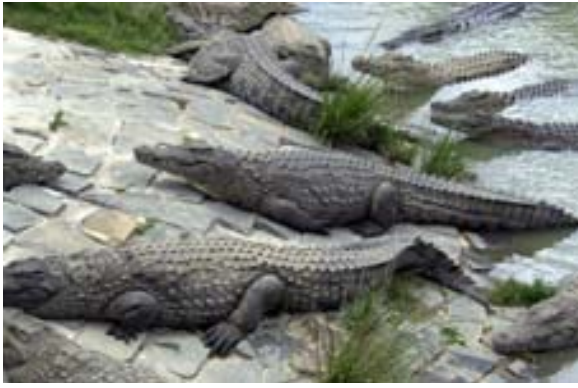
Im grossen See der Croc-Farm ...