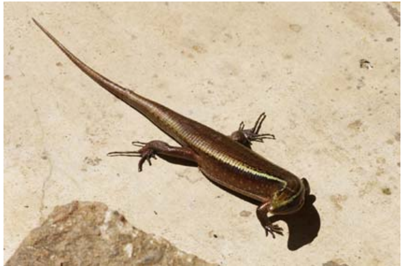
...und dem Spezial-Reservat von Périnet