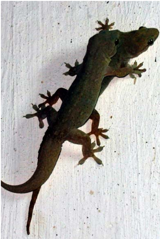
Geckos bei Paarung in Bezaha