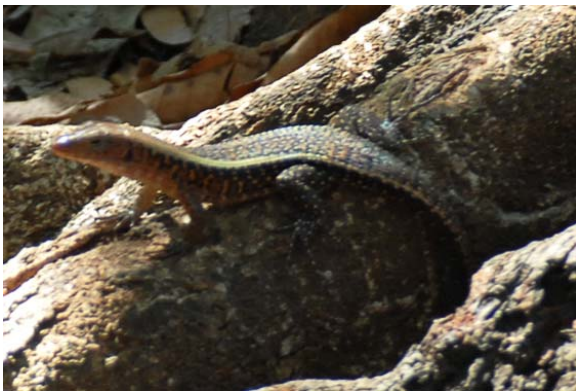
Echse im Park von Ankarafantsika