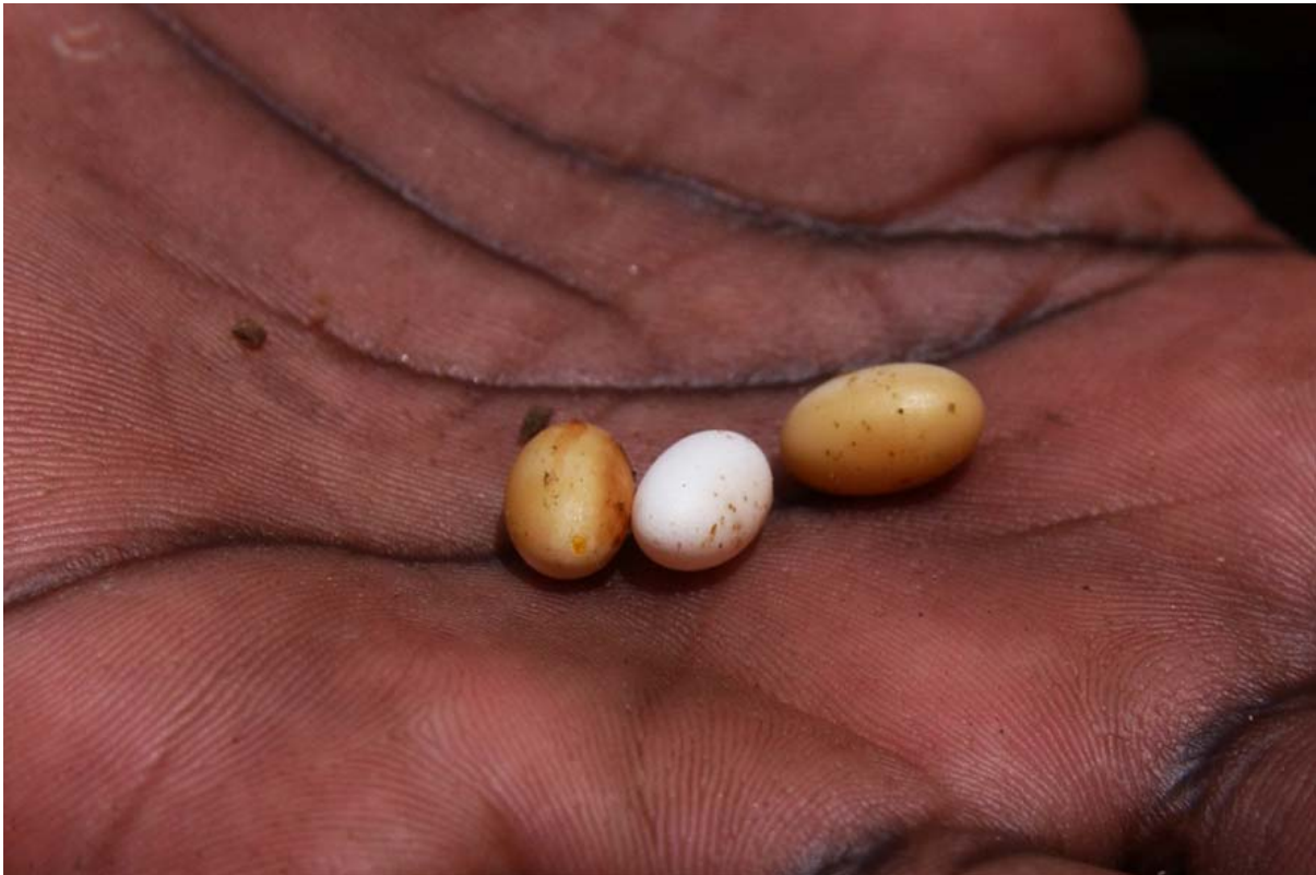
Eier eines Chamäleons

Je nach der Gattung dauert es 3 bis 12 Monate, bis aus den Eiern Jungtiere schlüpfen.