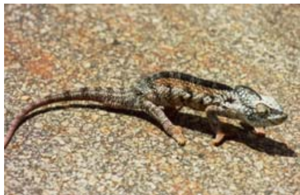
Perfekt an die Farbe der Strasse angepasst