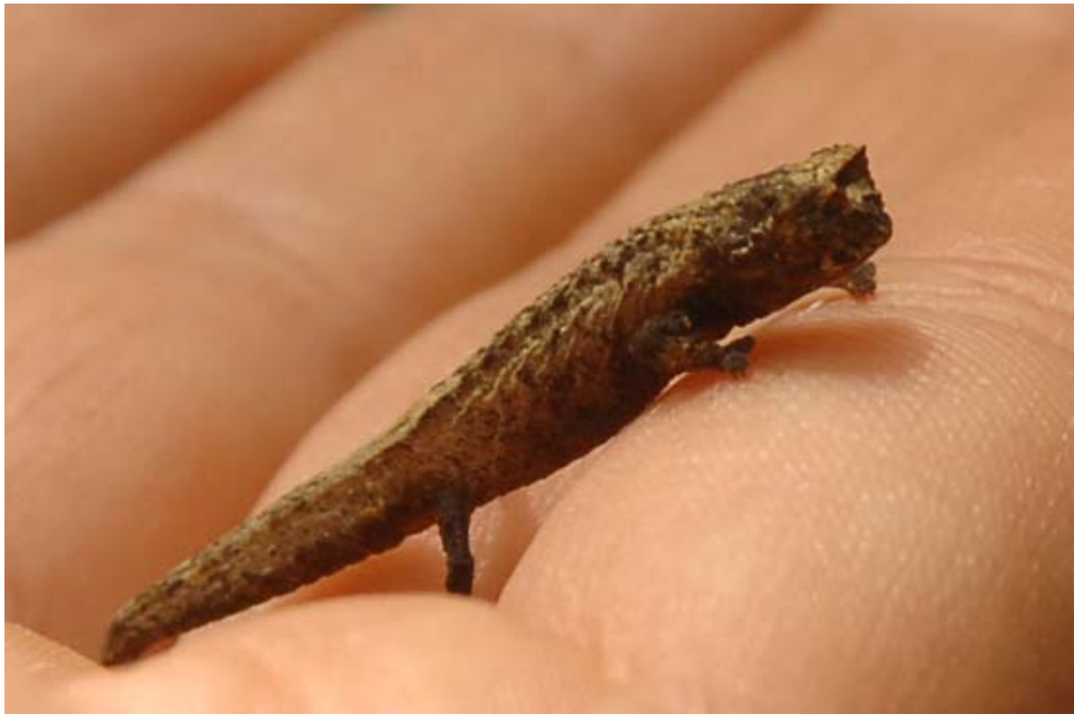
Brookesia nasilus (oben) und Brookesia minima (unten) in Park vom Forêt d'Ambre