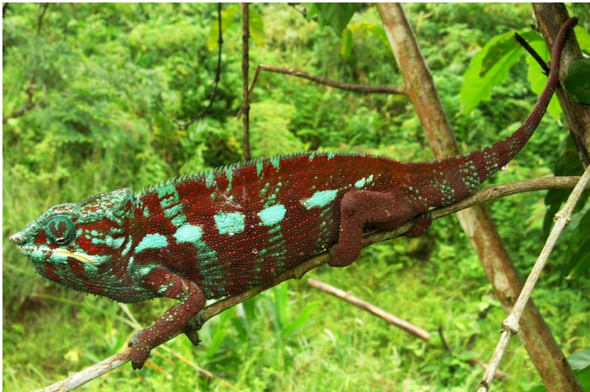
Stattliches Exemplar im Masoala -Gebiet – siehe auch Trekking