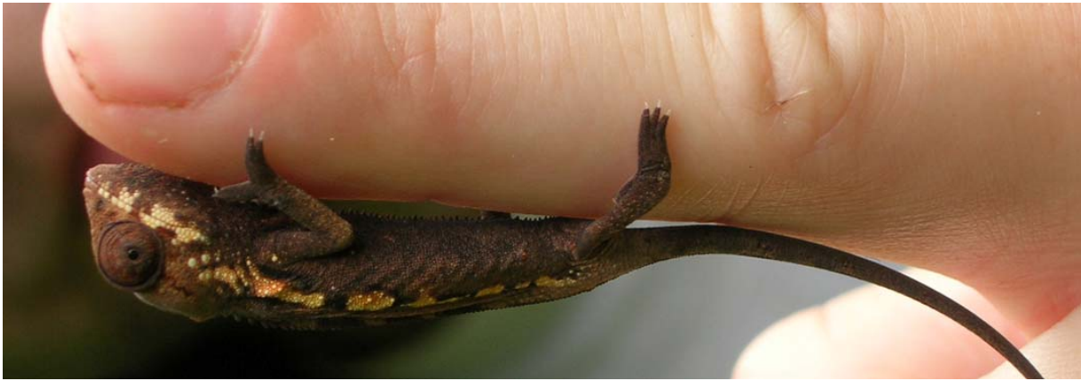
Winzling eines Chamäleon im Masoala -Gebiet – siehe auch Trekking