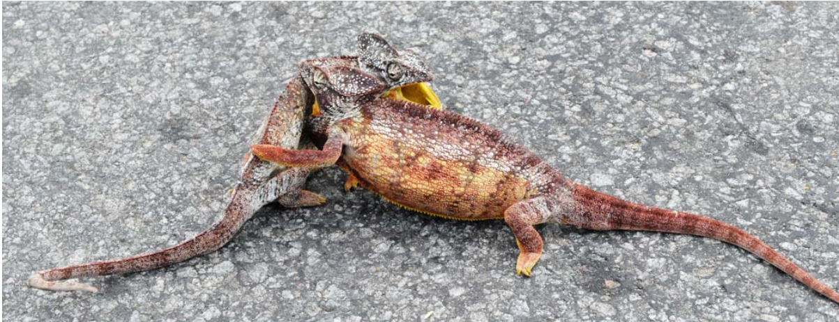
Zwei Männchen kämpfen verbissen auf der RN 6

Was bietet Madagaskar und warum mit der DILAG-TOURS Madagaskar erleben? Wegen: