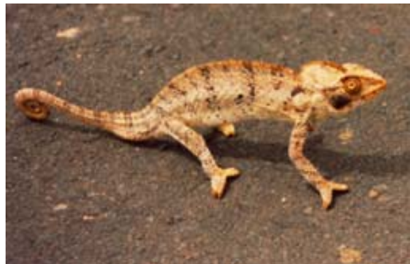
Mitten auf der Nationalstrasse