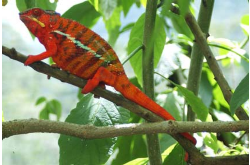
Rot wie die Feuerwehr