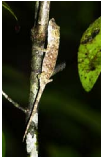
Brookesia im Palmarium