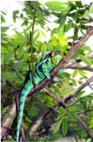
Leuchtend rote Augen