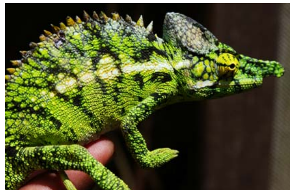
...grün in allen Tönen