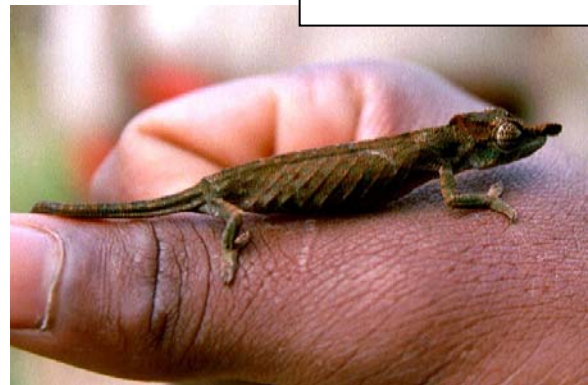
... in allen (Brookesia nasilus)...