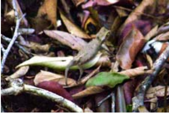
Sehr kleine Art in Ankarana