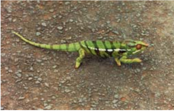
...grüner im Taktmarsch auf Strasse