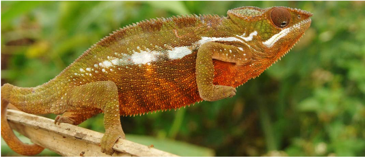
Chamäleon in „Angriffsstellung“ in Andapa