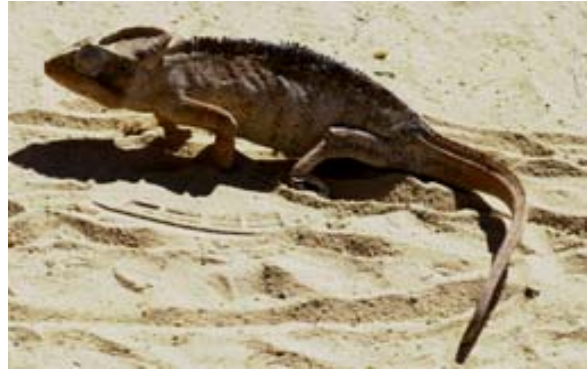
Den Farben des Sandes angepasst