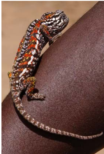
...Exemplare in rot-schwarz...