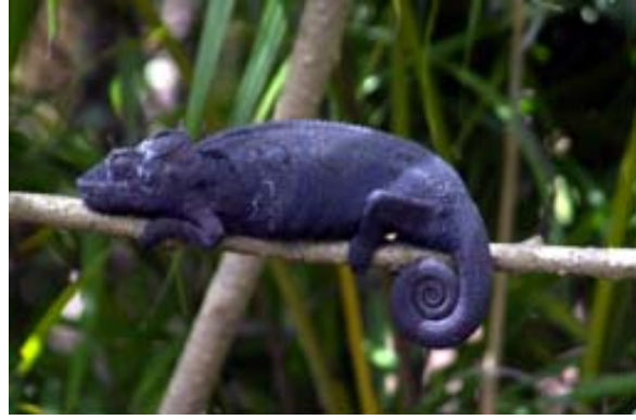
Schwarz vor Erregung ( Croc Farm )