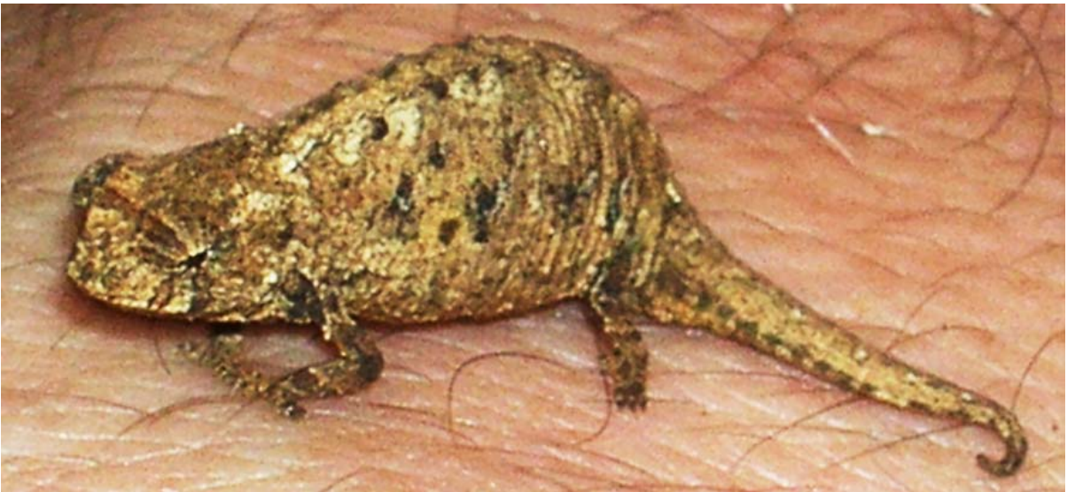
...im Nationalpark „ Forêt d'Ambre “ bei Diego-Suarez