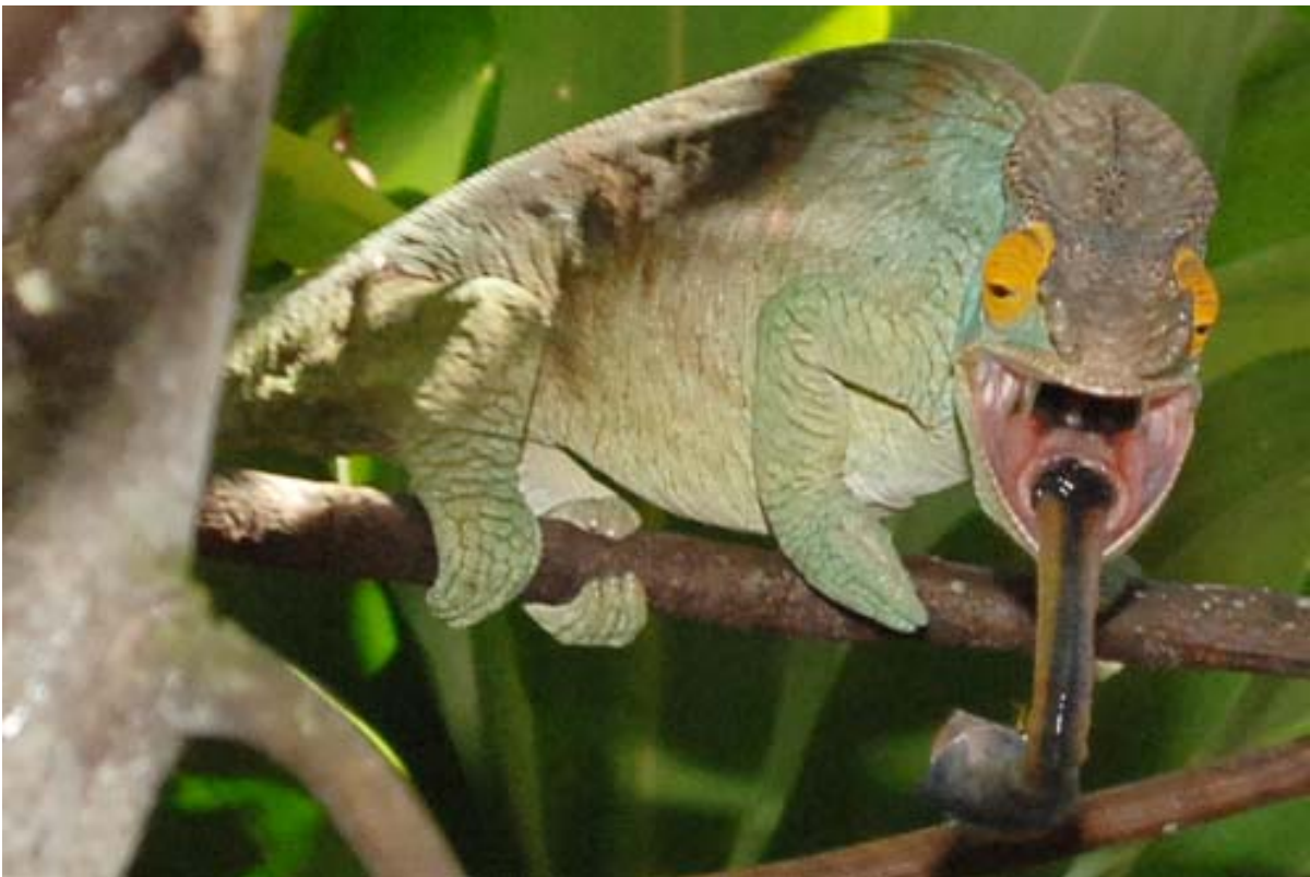
Herausschnellende Zunge in der Sammlung Peyrieras