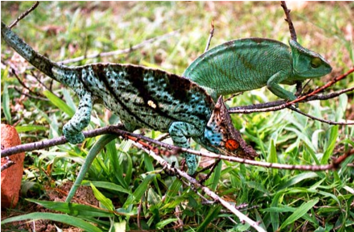
Männchen und Weibchen der Furcifer oder Calumma parsoni