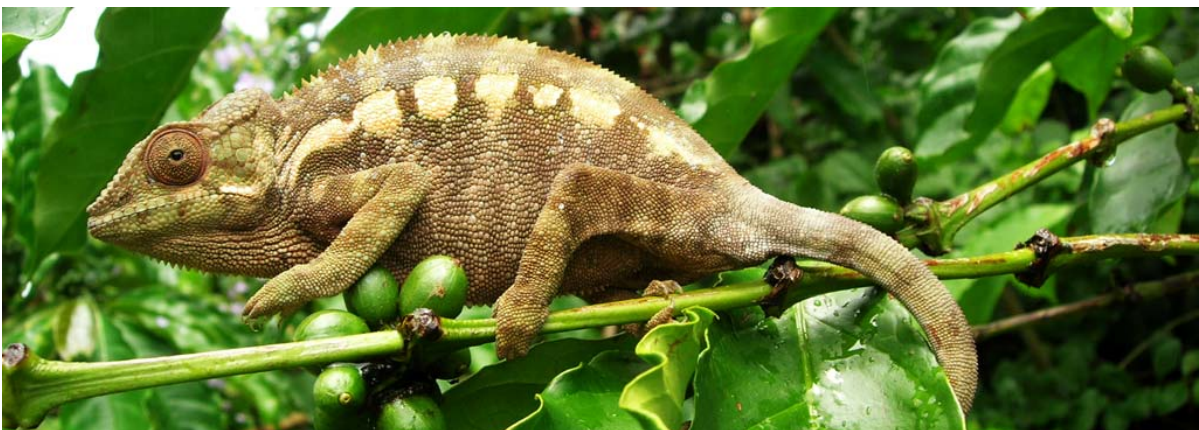
Chamäleon im Masoala -Gebiet – siehe auch Trekking

▶ Siehe auch unter „ Bevölkerung “, unter „ Exportgenehmigungen “, unter „ Geographie “ – Osten , unter „ Lebensgewohnheiten “, unter „ Naturschutzpärke “ – in fast allen, unter Reiserouten “ – Naturschutzpark-Tour (Foto) und unter „ Tiere “ – Echsen und Krokodile .