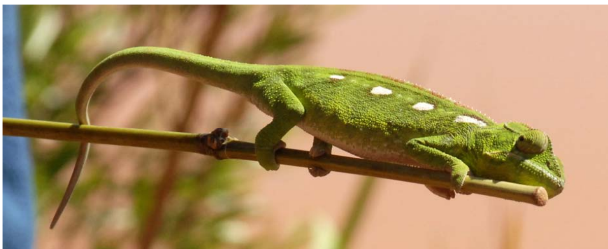
Grünes Chamäleon im Lemurenpark bei Tana