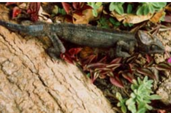
Mit grimmigem Blick