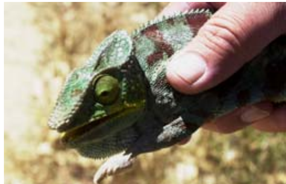
So grimmig bin ich gar nicht