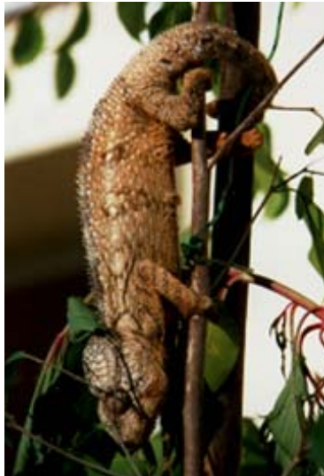
In Villa Mamisoa