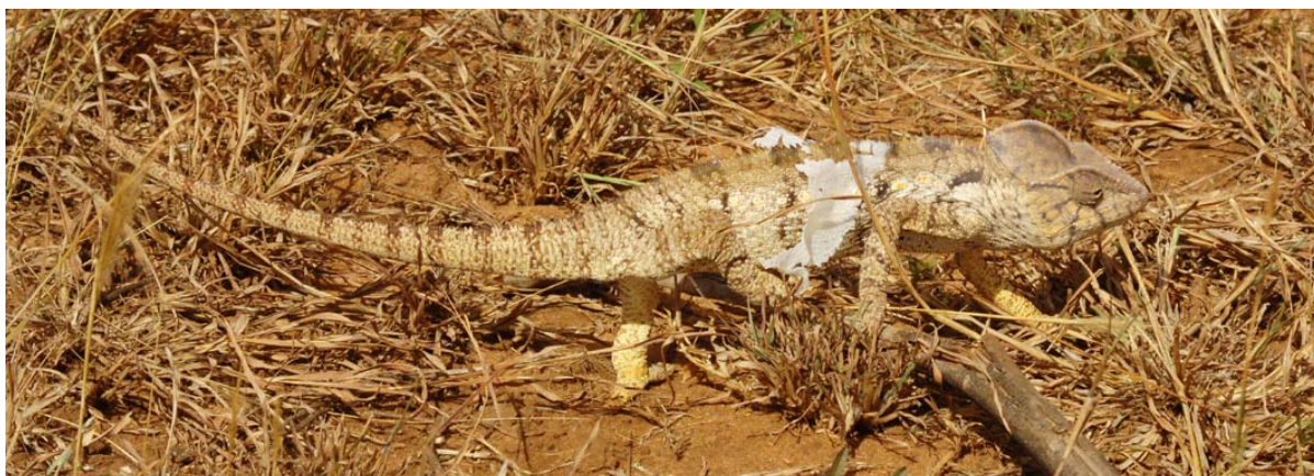
Wie alle Reptilien, häuten sich die Chamäleons von Zeit zu Zeit (bei den Tsingy Rouges )