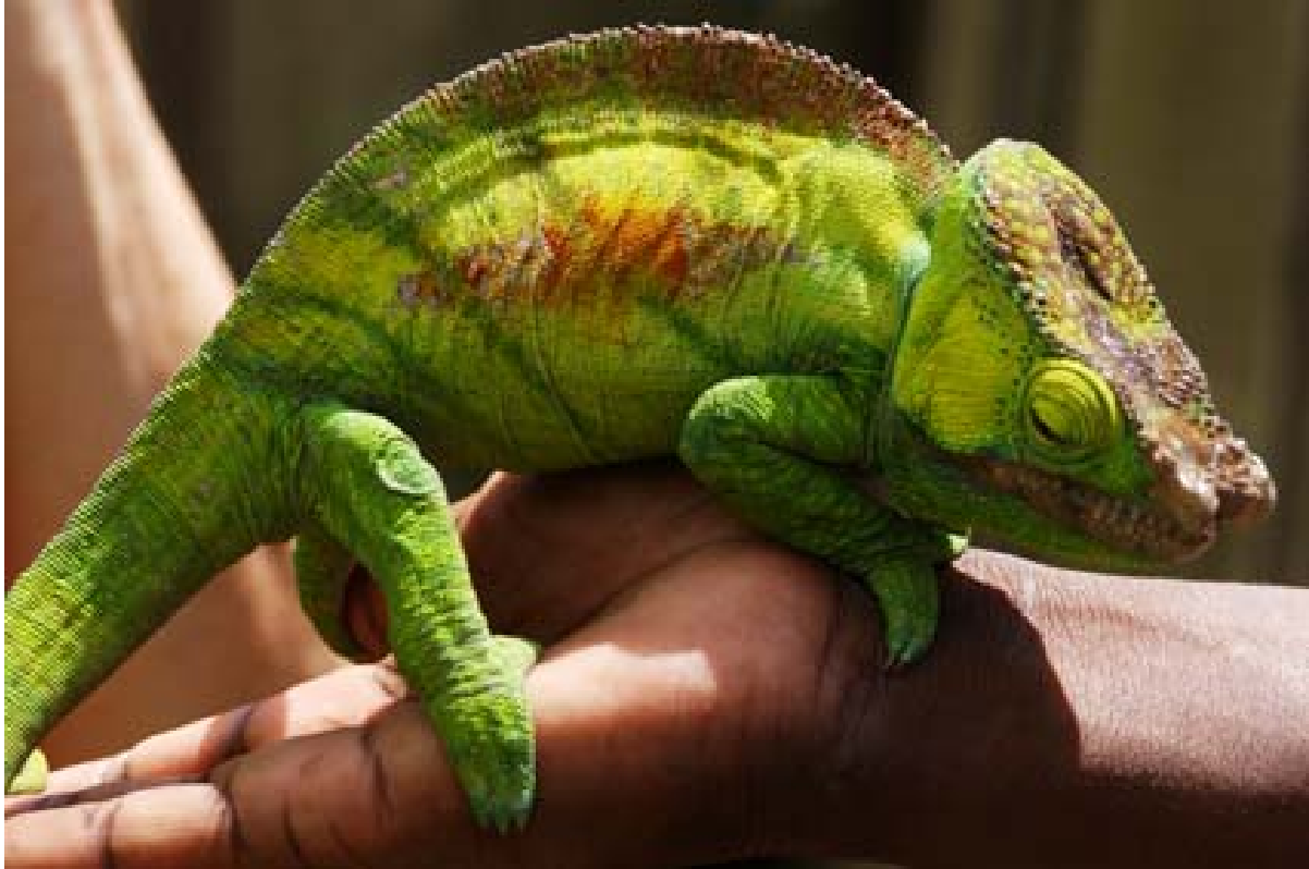
Grünes Exemplar in der Sammlung Peyrieras