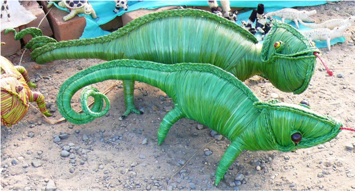
Eine Gattung aus Bast an der RN 7