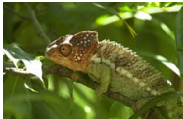
...findet man fast überall