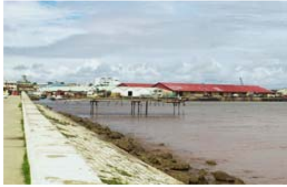
Hafen von Cap her