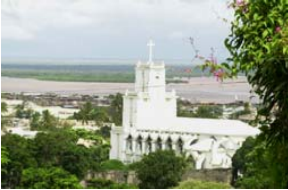
Kathedrale vom Rova aus