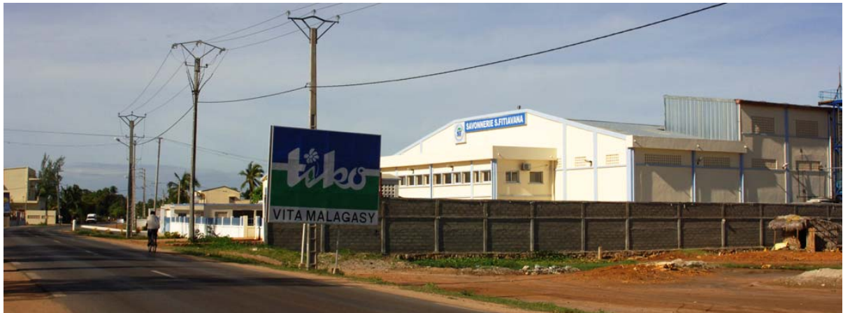
Neubau einer Seifenfabrik