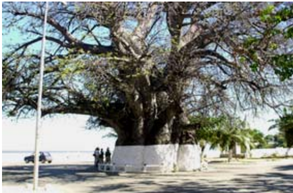
Grösster Affenbrotbaum des Landes