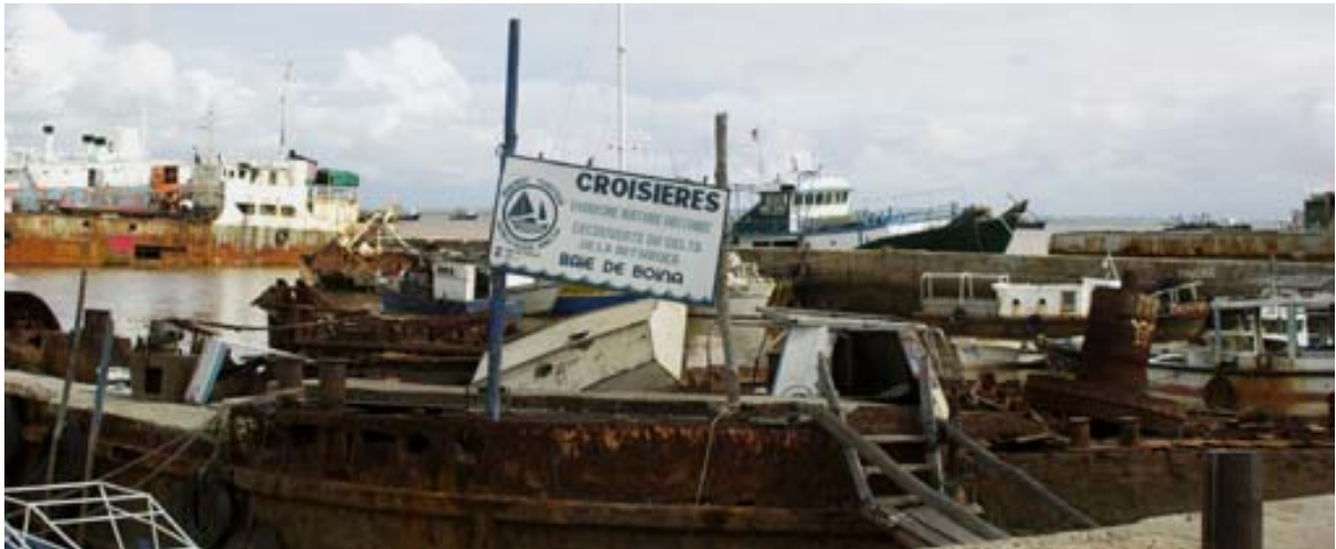
Nicht Vertrauen erweckende Flotte für Ausflugsfahrten