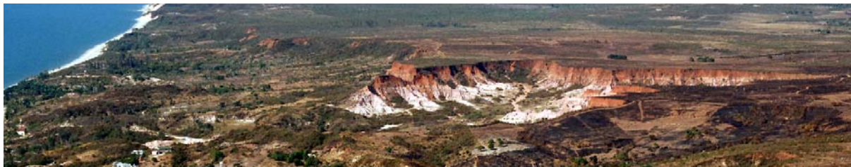
Luftaufnahme des „Cirque Rouge“ – siehe auch Panoramabilder