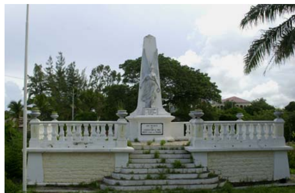
Kriegsdenkmal in Mahajanga

Mahajanga ist auch für sein lebhaftes Nachtleben bekannt. Seit dem die RN 4 durchgängig ausgebaut und geteert ist, fahren viel mehr Leute des Hochlandes nach der Provinz-Hauptstadt. Über Festtage sind allerdings oft alle Hotelbetten – an die 2000 – ausgebucht. Eine Reservation ist auf jeden Fall angezeigt, will man nicht im Auto oder am Strand übernachten.