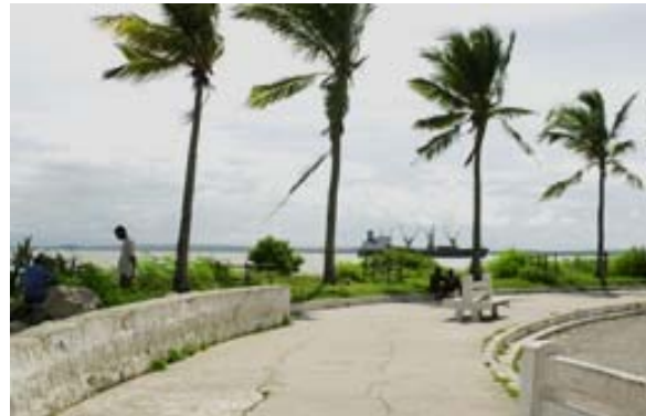
Cap beim Hafen