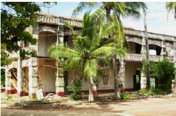
Alte Kaserne der Franzosen