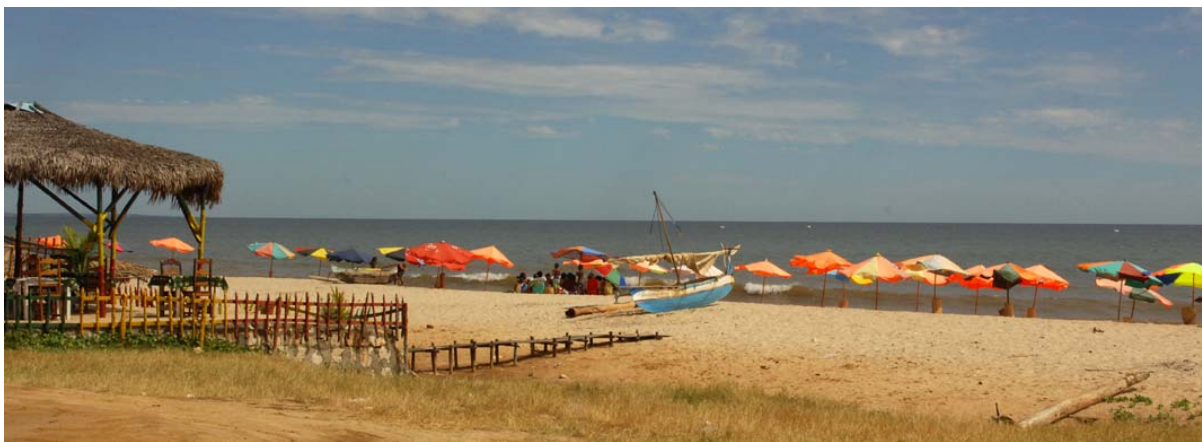
Offizieller Badestrand von Mahajanga in der Nähe des Cirque Rouge