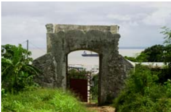
Tor des ehemaligen Rova von oben