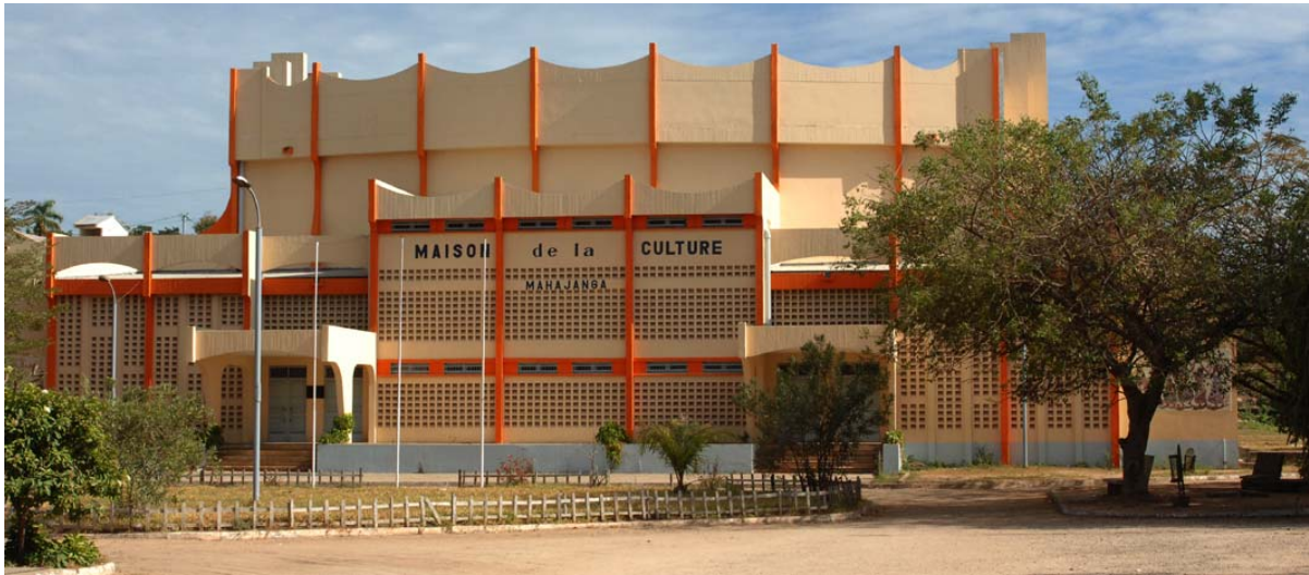
Neuer Kultur -Palast