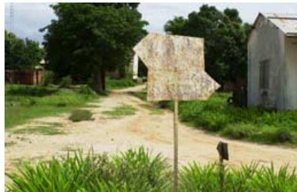
Viel sagende Wegweiser

Offenbar ist geplant, auch in Mahajanga einen Golfplatz zu errichten.