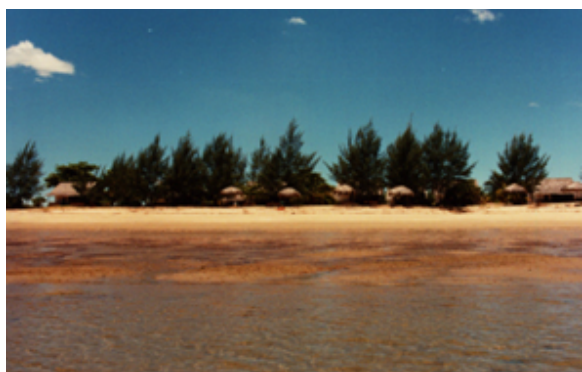
Strand von Ampazony beim ZahaMotel