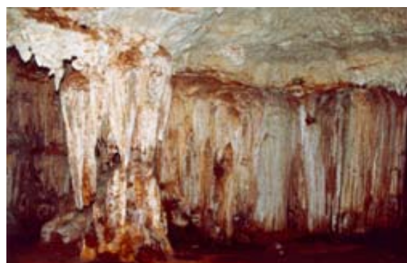
Grotte von Anjohibe

Es bestehen die folgenden Ausflugs- und Besichtigungsmöglichkeiten: