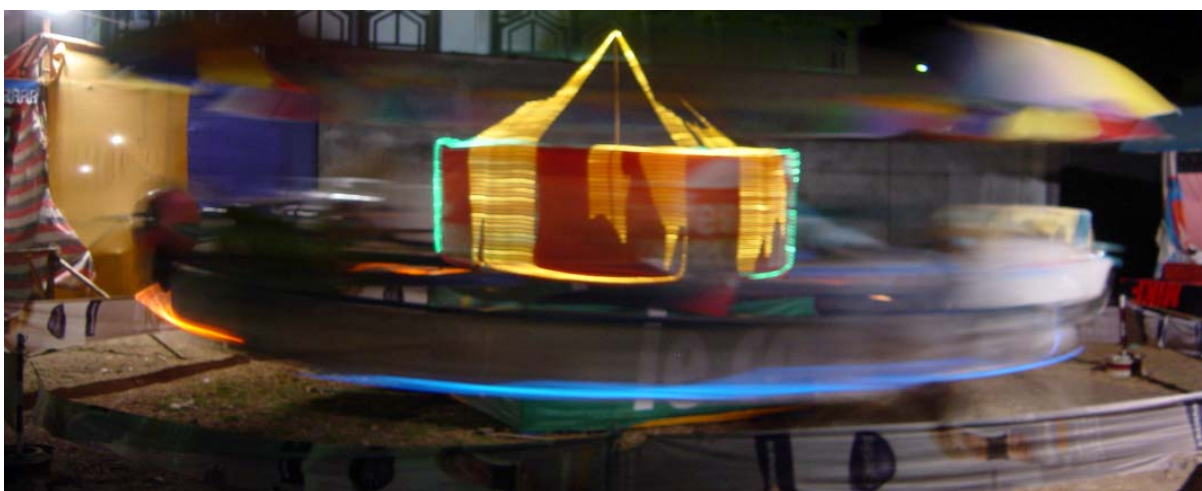
Karussell , welches mit Manneskraft angetrieben wird