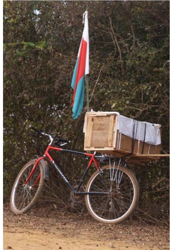
Transport einer Leiche auf dem Fahrrad