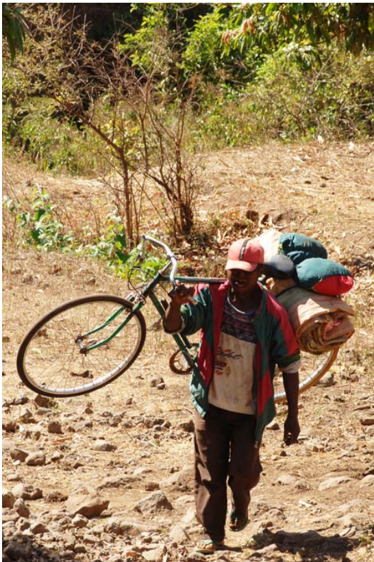
Bei schwierigem Terrain trägt man das Rad – Nähe der Geysire bei Analavory