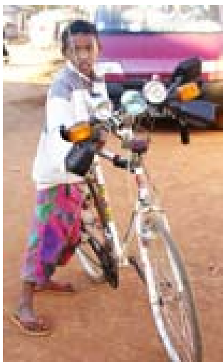
Junge mit „Luxus-Fahrrad“ in Tsiroanomandidy