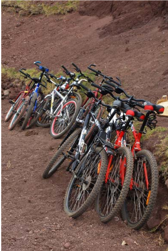
Miet-Räder am Lac Tritriva bei Antsirabe