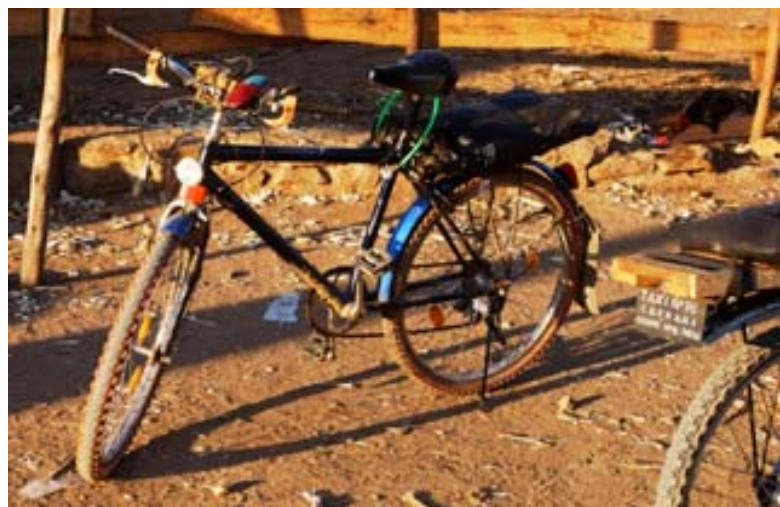
Sich einmal eine Fahrt mit einem Fahrrad-Taxi leisten ist in Ambatondrazaka möglich