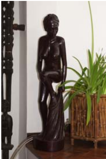
Figur aus Rosenholz

Solche Arbeiten werden vor allem in der Umgebung von Ambositra produziert. Geschäfte mit diesen Artikeln findet man in Antananarivo und Ambositra .