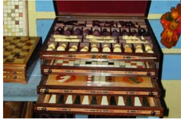
... in einem Geschäft in Ambositra

Truhen , Schachteln, Wandbilder , Tische, Schmuckkästchen, Spiel-Truhen und viele andere Gegenstände aus Holz mit farbigen Intarsien können ebenfalls bewundert werden. Sie werden von geschickten Händen erstellt und auf den Märkten angeboten.