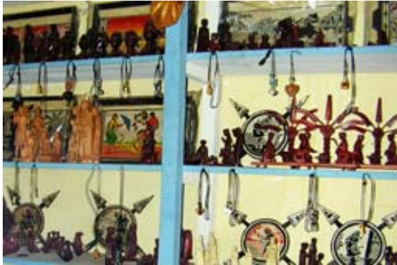
Geschnitzte Gegenstände aller Art...

Auf der Südtransversale und in der Umgebung von Ambositra können die Schnitzer bei ihrer Arbeit beobachtet werden.