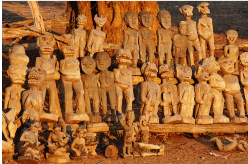
... – teilweise mit erotischem Charakter – in Betioky