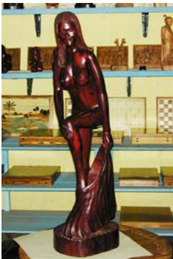
Akt in Rosenholz oder...