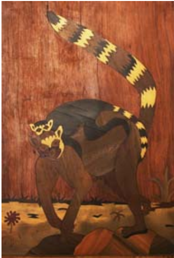
Bilder aus Intarsien ...