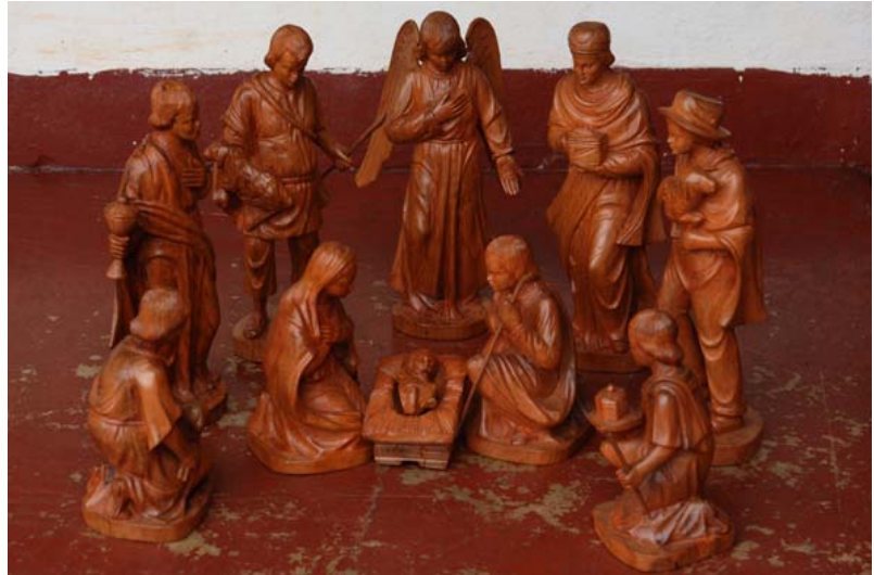
...und Krippen-Figuren in Ambositra