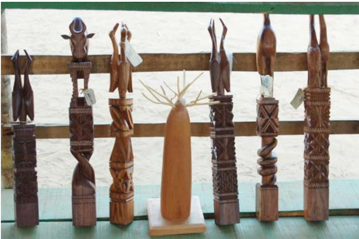
Zier- und Nutzgegenstände aus Holz an der Baobab -Allee bei Morondava

▶ Siehe auch unter „ Arbeiten “ (Foto eines Schnitzers), unter „ Baustil und Gebäude “ – Häuser aus Holz, unter „ Eckdaten des Landes “, unter „ Glossar “ – Aloala, unter „ Kinderspielzeuge “, unter „Kirchen“ (Schnitzereien als Kirchentüre), unter „ Klein- und Kleinst-Unternehmen “ – Holzverarbeitung, unter „ Kunst und Kultur “ – Holzschnitzereien, unter „ Märkte “, unter Naturschutzpärke – Privatpärke (Grabskulpturen), unter „ Orte-Info-Blätter “ – Ambositra , Moramanga (Holzdecke in Kirche, Morondava (Fotos mit Gräbern mit Holzschnitzereien), unter „ Ortschaften “ – Ambositra , Antalaha (Schiffsbau aus Holz), Betioky , Moramanga (Foto Holzdecke in Kirche), Morondava (Skulpturen auf Gräber), unter „ Reiserouten “ – Kleine Süd-Tour , Grosse Süd-Tour , Erlebnis-Süd-Tour , Ost-Tour , Süd-Nord-Tour , Grosse West-Tour sowie Eisenbahn-Tour , unter „ Souvenirs “ – Spielzeug-Autos , unter „ Totenkult “ (Fotos mit Holzschnitzereien auf Grab), unter „ Touristik-Karten “ – Hochland , Süden , unter „ Verkaufen “ – Möbel in Morombe und unter „ Verkehrsmittel “ – Lastwagen (Foto eines Modells aus Holz).