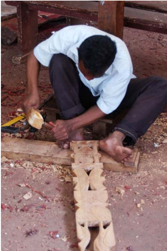
Schnitzer beim arbeiten an Aloal und...