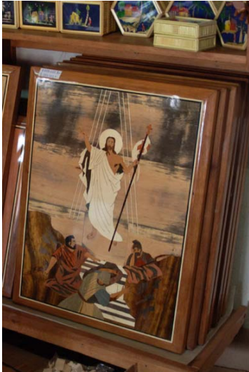
Bilder aus Holz-Intarsien ...