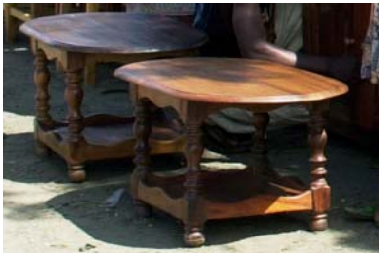
...Tische in Palisander und alles zu günstigen Preisen