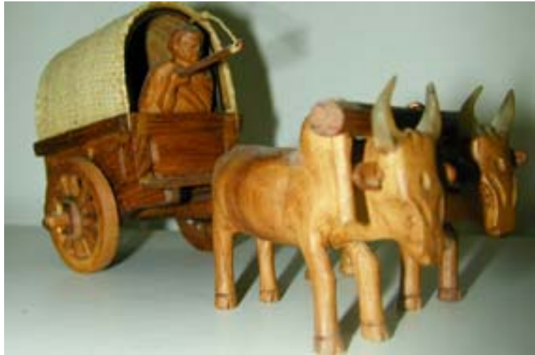
...oder Skulpturen mit Sujets des täglichen Lebens