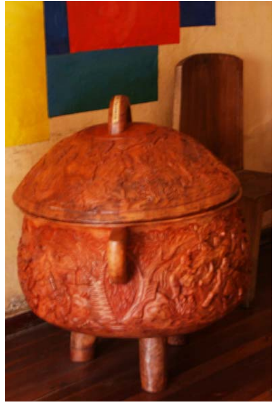
...riesiger Vorrats-Topf aus Holz in Ambositra