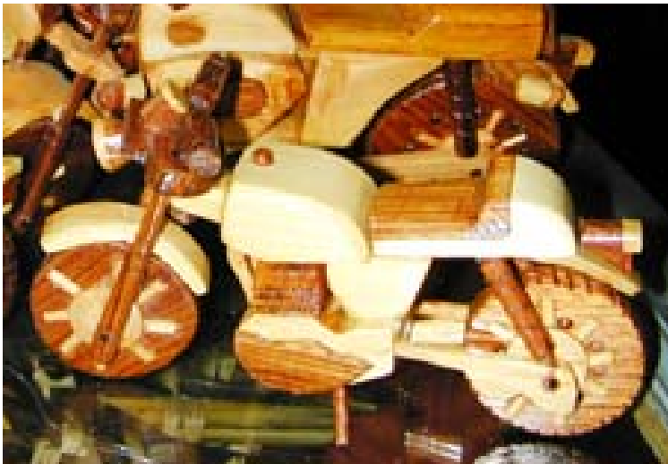
Motorräder in Ambositra , Aloale und...