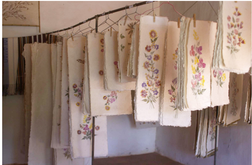
Laden in Ambalavao mit Produkten aus Büttenpapier