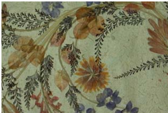
Nach Jahren etwas verblasst, aber immer noch attraktiv

▶ Siehe auch unter „ Arbeiten “, unter „ Bevölkerung “ – Antaimoro, unter „ Eckdaten des Landes “, unter „ Hotels “ – Liste der Hotels / Ambalavao , unter „ Kunst und Kultur “ – Papier der Antaimoro, unter „ Orte-Info-Blätter “ – Ambalavao , unter „ Ortschaften “ – Ambalavao , unter „ Reiserouten “ – Kleine Süd-Tour , Grosse Süd-Tour , Eisenbahn-Tour , Erlebnis-Süd-Tour , Naturschutzpark-Tour , Süd-Nord-Tour sowie Grosse West-Tour , unter „ Städte “ – Fianarantsoa und unter „ Touristik-Karten “ – Hochland , Osten , Süden .