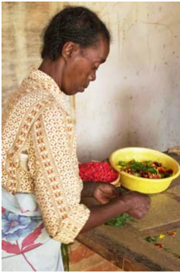
Frau beim Einlegen von Blumen