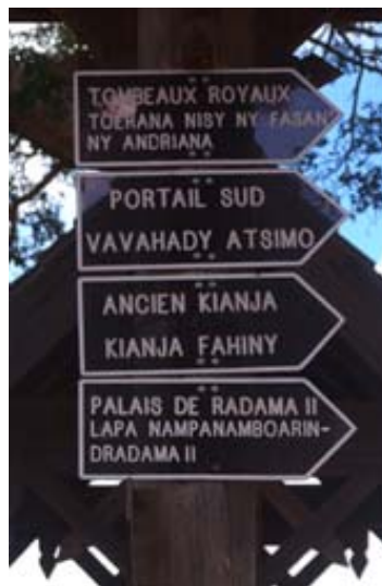
Wegweisen zu den Sehenswürdigkeiten