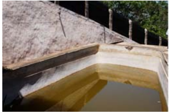
...welchem er mit Jungfrauen badete