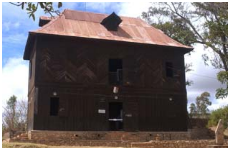
...Nordseite mit dem Haupteingang

Was ist neu Inhaltsverzeichnis Stichwortverzeichnis