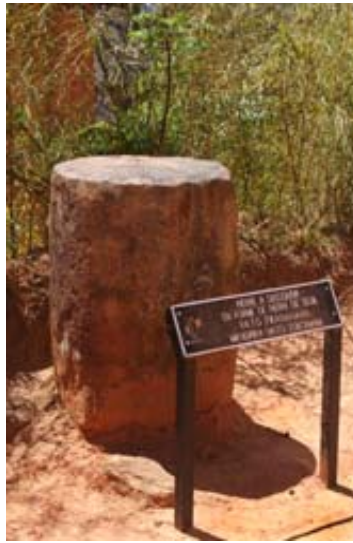
Stein für Ansprachen