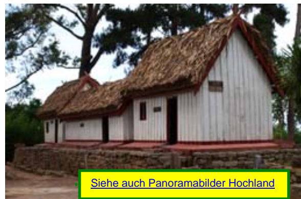
Siehe auch Panoramabilder Hochland