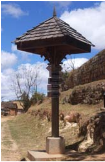
Wegweiser zu den Sehenswürdigkeiten wie