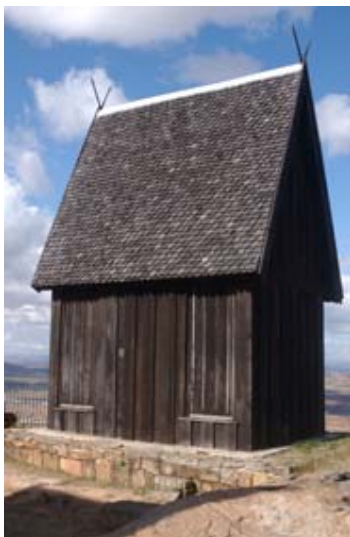
Eines der beiden Rova