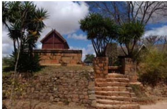
Treppe zur Anlage