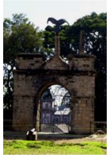
...Tor von der Innenseite

Wer an den spärlichen, kulturellen Gütern interessiert ist, besucht besser an Stelle des Rova in Tana, den Rova von Ambohimanga – siehe auch unter Zusatzprogramm Ambohimanga – und/oder das Rova von Ambohidratrimo . Auf letzterem befinden sich die Gräber der Königinnen . Weiter befinden sich dort zwei Kulturgegenstände: Eine Frau aus Stein. Wenn eine schwangere Frau mit geschlossenen Augen versucht, die Brüste der Skulptur zu ertasten, kann festgestellt werden, ob das Kind ein Knabe oder ein Mädchen wird. Ein grosser Stein mit einem kleinen Loch dient jungen Mädchen, ihren Wunsch für einen Gatten bei den Ahnen zu platzieren. Wer trifft, wird seinen Mann finden.