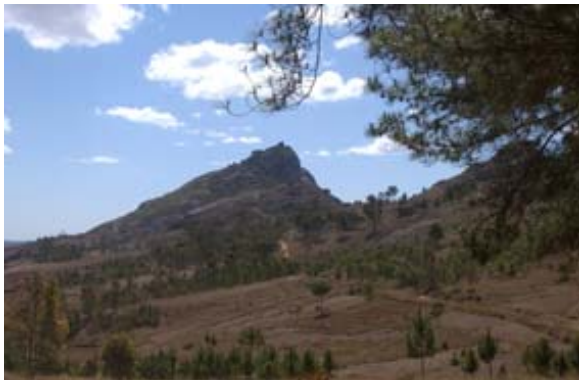
Felsen von Antongona von Fern und...

Die Anlage besteht aus drei Teilen: Antongona, Anbohiobato (im Osten) und Ambohimirandrana (1512 m.ü.M)