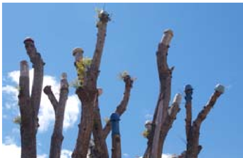
Gestutzter Baum mit Pfannen

Was ist neu Inhaltsverzeichnis Stichwortverzeichnis