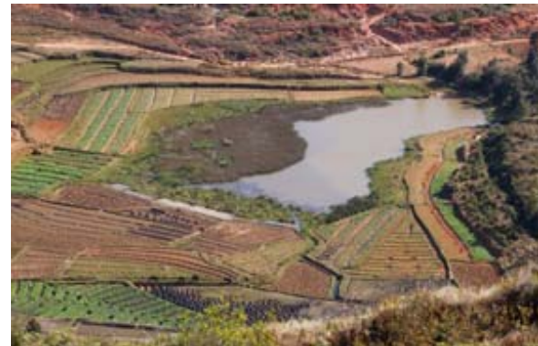
Bain du Roi