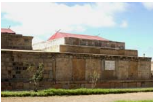
Gräber der Könige