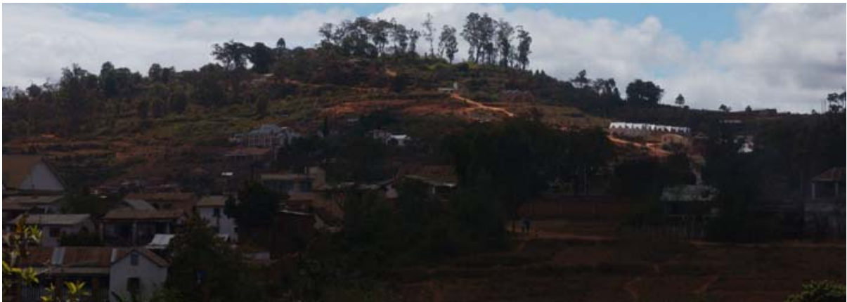
Hügel mit dem Rova von der RN 3a aus

Die Visite dauert maximal 30 Minuten. Wer die Sommer-Residenz von Ambohimanga besuchen will, kann auf der Hin- oder der Rückfahrt einen Abstecher zu diesen Rova unternehmen, da er an der gleichen Nationalstrasse liegt.