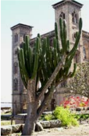
Westseite mit Sukkulente ,...