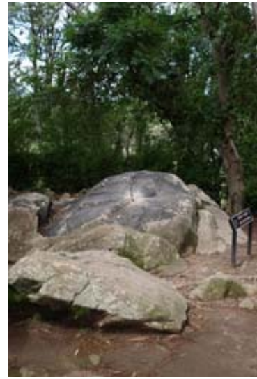
Stein der Wünsche