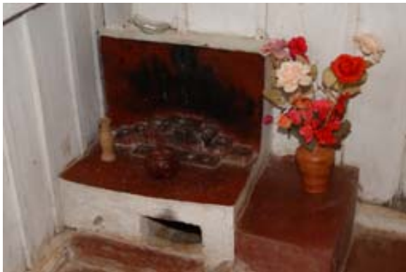
Altare in den Königinnen -Gräbern Ratrimo...