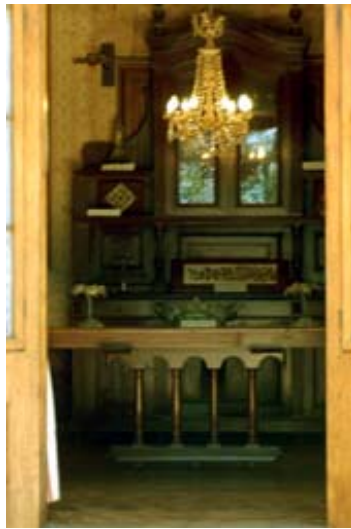
Das Esszimmer der Königin