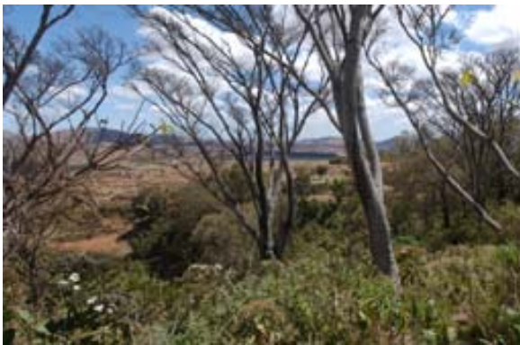
Ausblicke von oben...