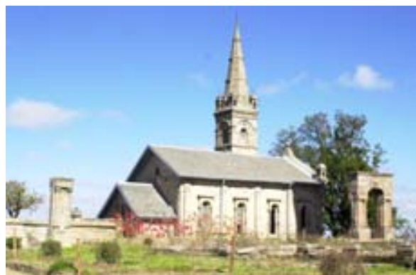
Kirche neben dem Rova

Was ist neu Inhaltsverzeichnis Stichwortverzeichnis