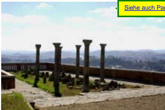
Rova von Tana: Reste der Säulenhalle