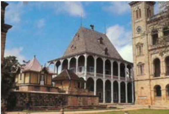
Manjakamiadana – auch Silberpalast (tranovola) genannt – von Tana, vor dessen Brand

Zudem hat man einen schönen Blick auf die Reisfelder , die Seen und die Stadt Antananarivo vom Norden her.