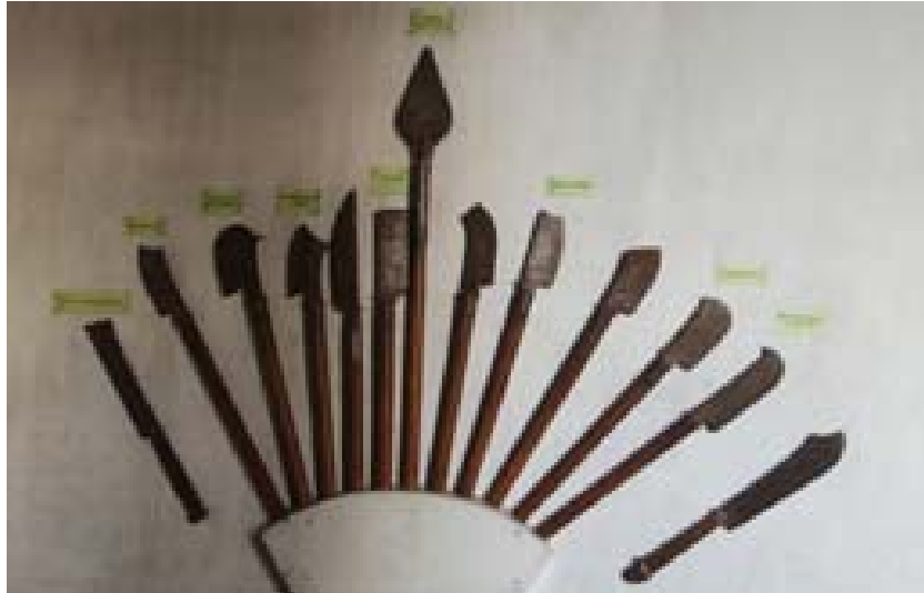
Exponate im Rova