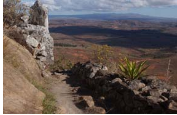
...Zugangsweg zum Rova