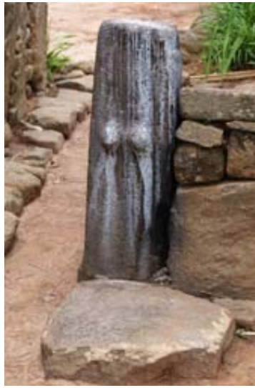
Stein des Kinderwunsches