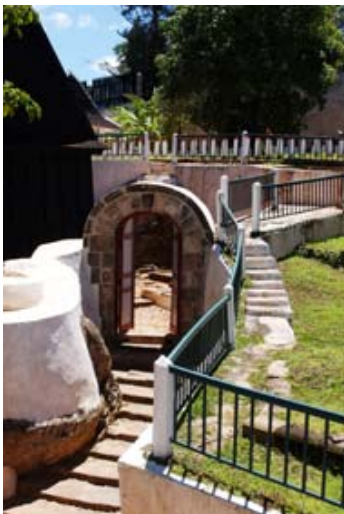
Tor des Königs und...