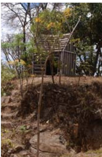
Hütte des Wächters