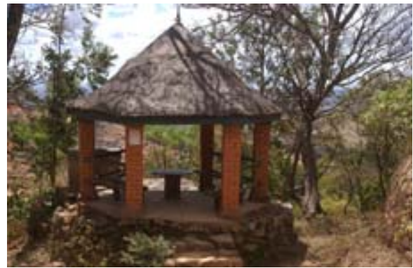
...den beiden Pavillons