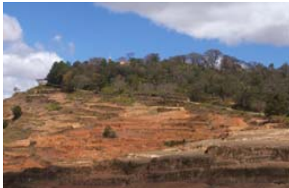
Hügel von Antsahadinta von der Piste her

☺ Der Rova Antsahadinta liegt ca. 15 Kilometer südlich der RN 1, Abzweigung in Ampitatafka . Die Zufahrt führt über eine Piste, welche bis auf den Hügel führt. Die Schlossanlage befindet sich eingebettet in ein Dorf. Vorhanden sind: Ein Museum , zwei Pavillons als Aussichtspunkte, ein Heiliger Stein, die Grundmauern des ehemaligen Rova, mehrere Gräber unter anderem dasjenige des ersten König Andriamangarira (1725 – 1775).