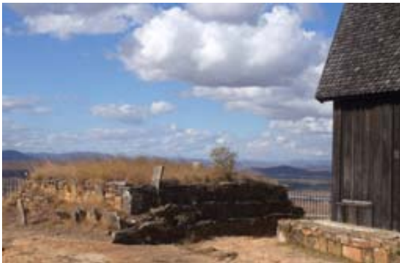
Grab des Königs und Rova