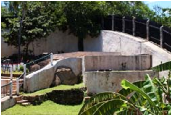
Bad des König Andrianampoinimerina , in...

Ambohimanga erreicht man über die RN 3, Abzweigung nach links mit Wegweiser. Man kann bis ganz nach oben fahren, sofern genügend Platz auf dem Parkplatz vorhanden ist.