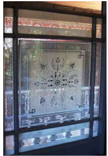
Fenster des Minister-Zimmers