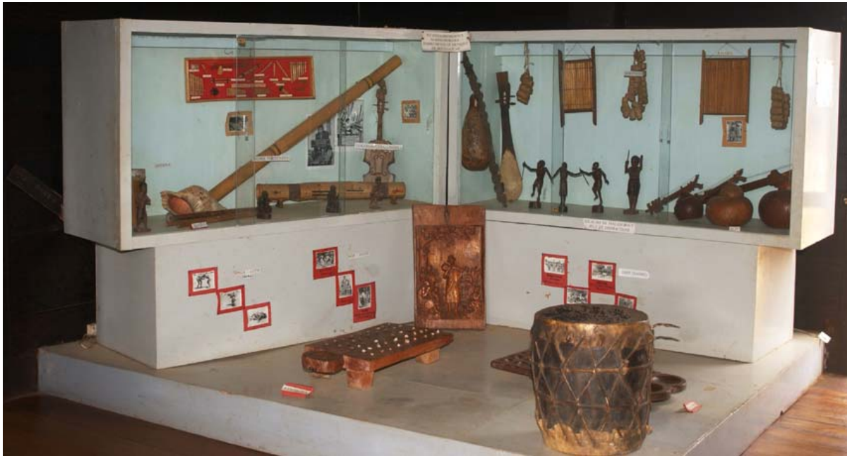
Umfangreiche Ausstellungen zu verschiedenen Themenkreisen im Inneren des Rova