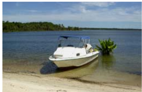
Boot am Strand vor Ony Hotel