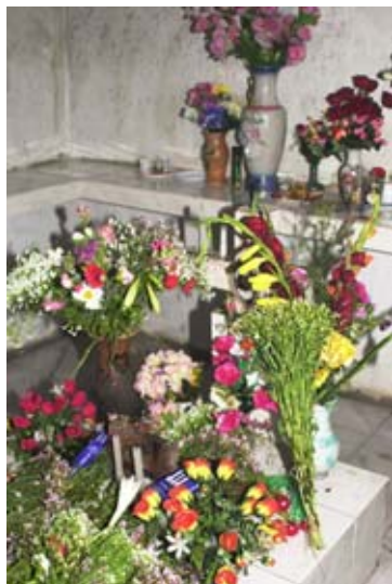
Grab „Farantsa“ innen auf dem Gemeindefriedhof