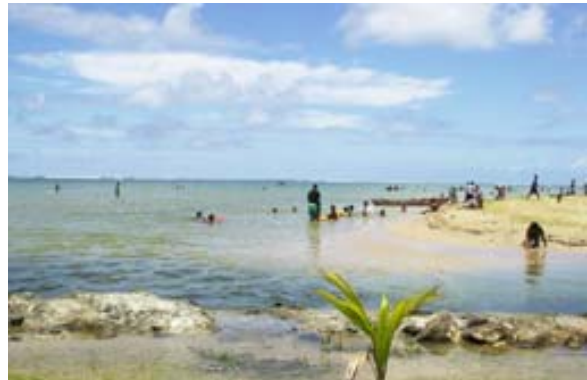
Strand von Foulepointe beim Hotel-Restaurant Au Gentil Pêcheur