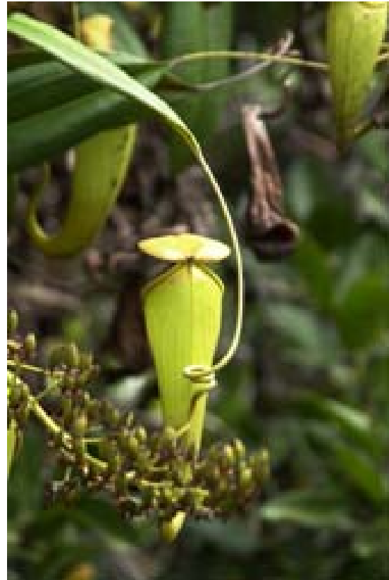
Becherpflanzen am Kanal

Hinweis: Das Hotel-Schiff der Softline ist seit den Unruhen im Jahre 2001 nicht mehr in Betrieb