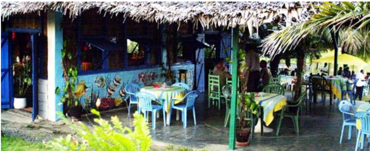
Restaurant „La Récréa“, welches von einem Wirt aus dem Wallis geführt wird

Gut essen kann man in den folgenden Restaurants : Hotel Joffre, Restaurant La Récréa, Restaurant Le Bateau Ivre, im Hotel Neptune, im Restaurant La Veranda, im Restaurant Le Zoreol.