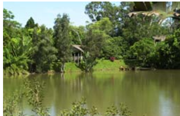
See im Park von Ivoloïna

Gut essen kann man in den folgenden Restaurants : Hotel Joffre, Restaurant La Récréa, Restaurant Le Bateau Ivre, im Hotel Neptune, im Restaurant La Veranda, im Restaurant Le Zoreol.