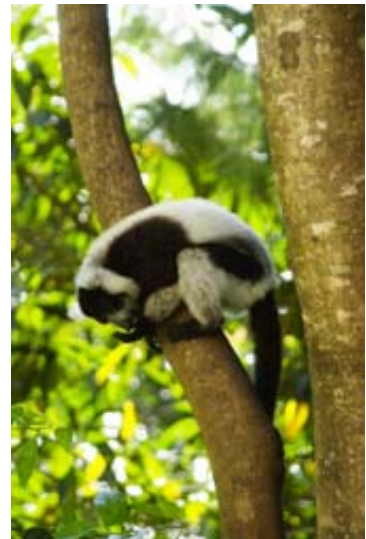
Sifaka im Park von Ivoloïna