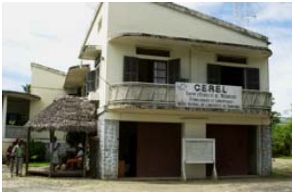
Museum gegenüber dem Nachklub „Queens“