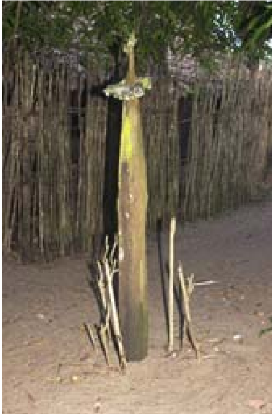
Kultplatz in Andranokoditra