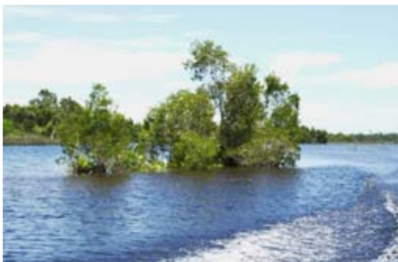
Baumgruppe im Kanal Pangalanes

Auch besondere Vereinbarung hin, kann für Hin- oder Rückfahrt mit der Micheline erfolgen. Allerdings muss diese auf Pneurädern fahrende Personenlokomotive – sieht aus wie der „Rote Pfeil“ der SBB – für die Fahrt geartert werden.