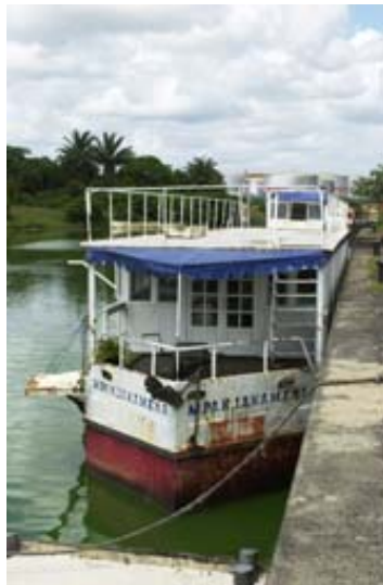
Hotelschiff der Soft-Line für Kanalfahrten