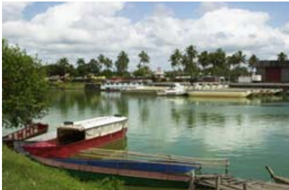
Flusshafen für Fahrten auf dem Pangalanes