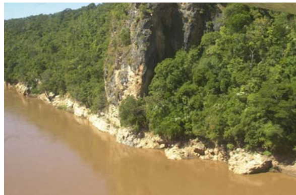
... und Tsiribihina