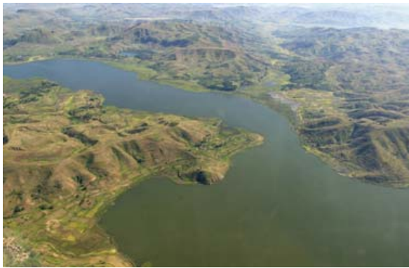
Lac Itasy und...