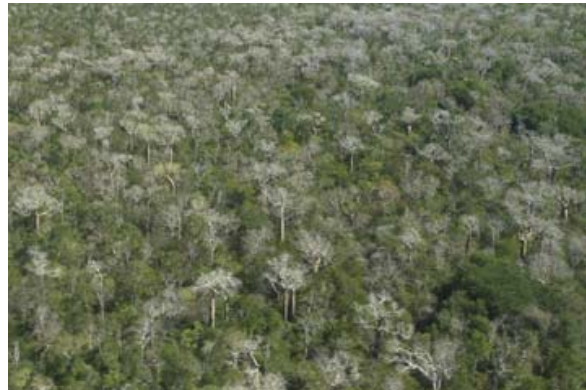
Trockenwald mit unzähligen Baobab

▶ Siehe auch unter „ Baden “ – Liste der Badestrände / Westen , unter „ Baustil und Gebäude “ (Fotos Ringsiedlungen), unter „ Bevölkerung “ – Sakalava, unter „ Distanz- und Fahrzeit-Tabellen “ – Fahrzeiten sowie Tabelle „Distanzen - ganze Insel“ sowie Tabelle „Distanzen – Westen“, unter „ Flughäfen “, unter „ Fotos / Film / Video “, unter „ Geographie “ – Hochland , Westen , unter „ Gewässer “, unter Naturschutzpärke “ – Bemaraha Sud und Bemaraha Nord , Forêt von Kirindy , unter „ Orte-Info-Blätter “ – Morondava , unter „ Ortschaften “ – Morondava , Miandrivazo , unter „ Pflanzen “ – Affenbrotbäume , unter „ Reis “, unter „ Reiserouten “ – Kleine West-Tour , Grosse West-Tour , Flussfahrt auf dem Manambolo unter „ Touristik-Karten “ – Westen , unter „ Tsingy “ – Bemaraha, unter „ Vegetationszonen “, unter „ Verkehrsmittel “ – Fähren , Schiffe , und unter „ Wahrzeichen und Highlights “ – Flussschiff-Fahrten, Gräber, Lemuren, Tsingy.