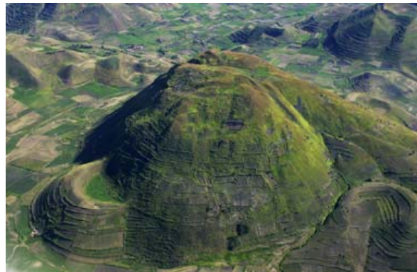
...einem der zahlreichen Vulkanhügel