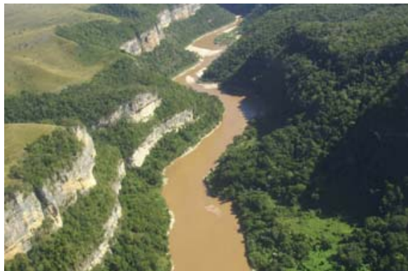
Flüsse : Manambolo...