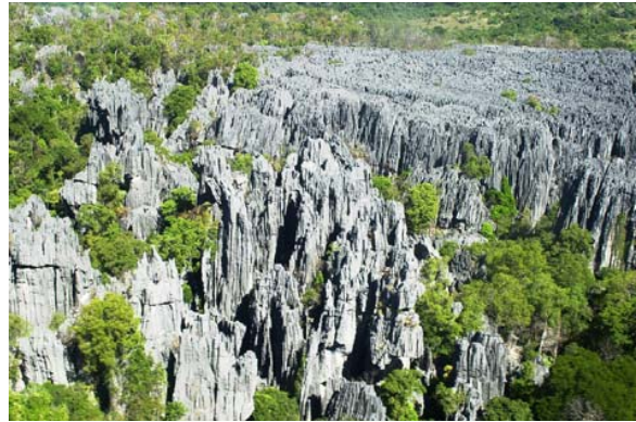
Tsingy von Bemaraha