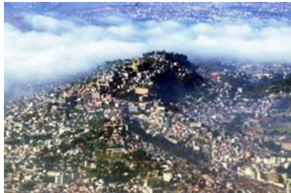
Tana im Morgennebel