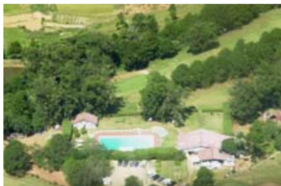
Golfanlage „Golf du Rova“ aus dem Flugzeug

In Mahajanga und auf Nosy Be bestehen Projekte für den Bau je einer neuen Golfanlage.