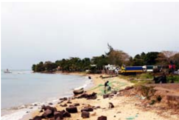
Strand beim Hafen und...