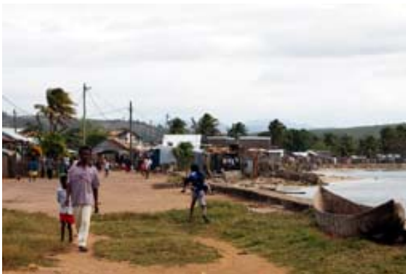
Promenade am Meer