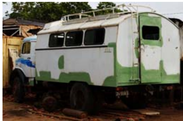
...ein Lastwagen seines Fuhrparks