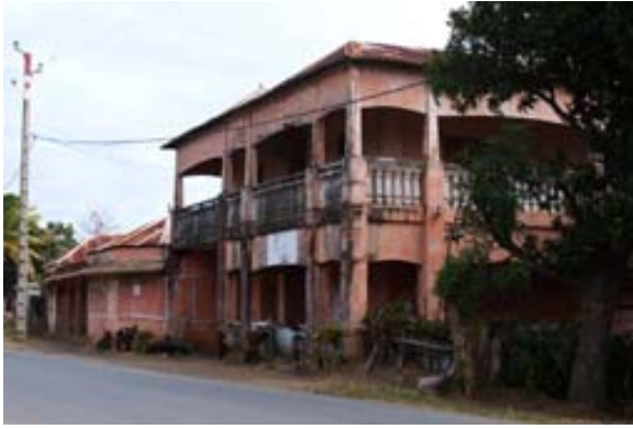
Alliance Française und das...