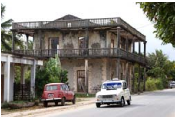
Verfallene ehemalige Residenzen und...