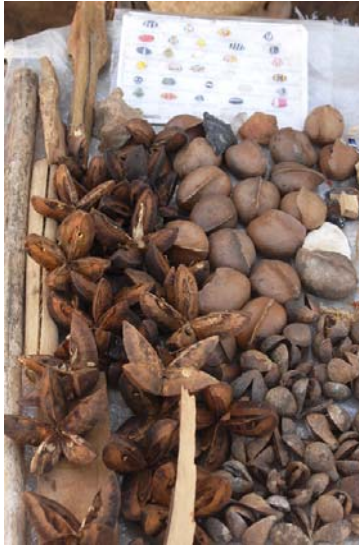
Naturheilmittel auf dem...