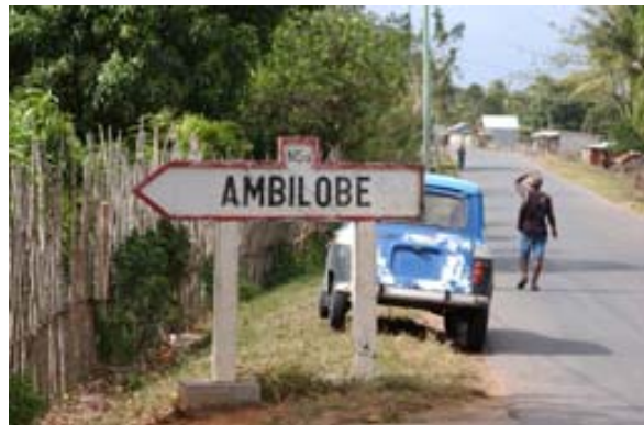
Beginn der wirklich schlechten Piste