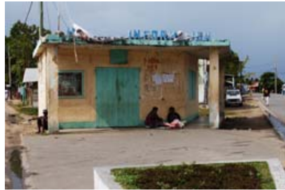
...Informationsgebäude in desolatem Zustand