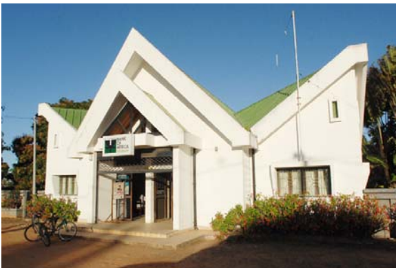
Bankgebäude der BOA