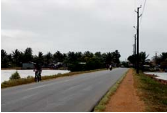
RN 5a auf Damm, der zur Stadt führt