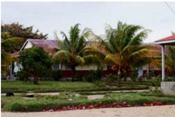
Der Spital gilt als der Beste des SAVA-Gebietes