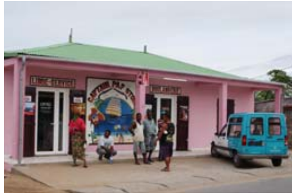
Bäckerei und Kiosk in modernem Haus