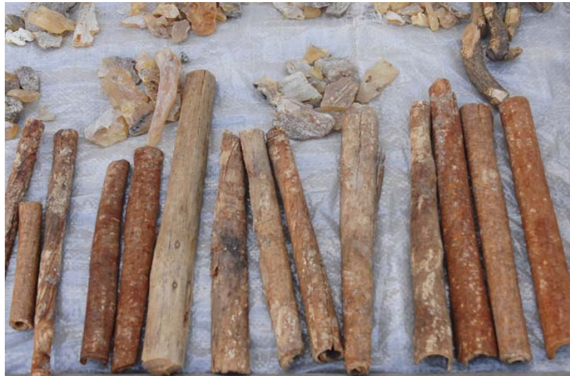
...Markt (Fana Fody Masy)