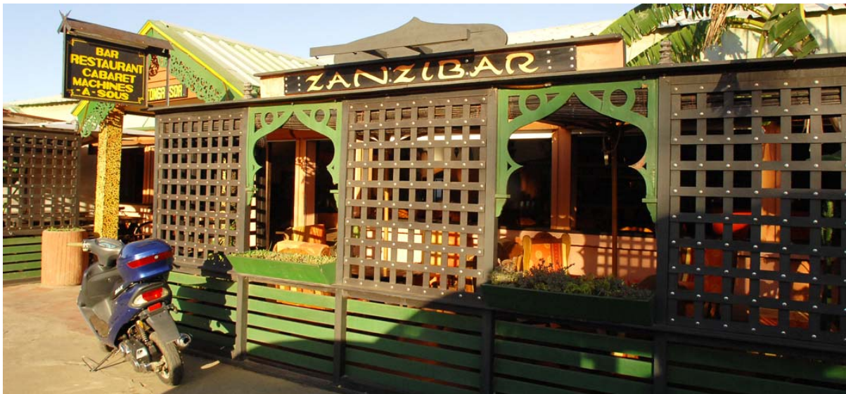
Spielsalon, Kabarett und Restaurant