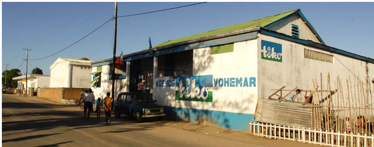
Filiale der TIKO