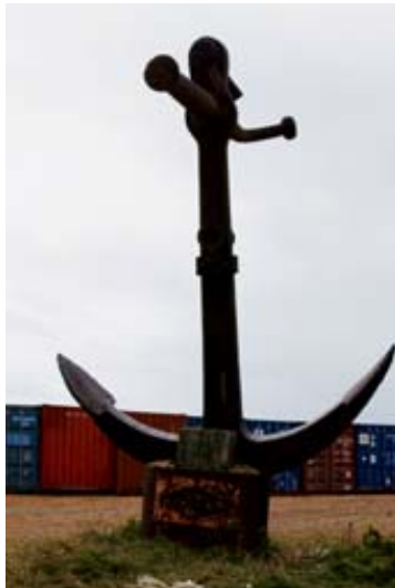
Anker- Denkmal und...