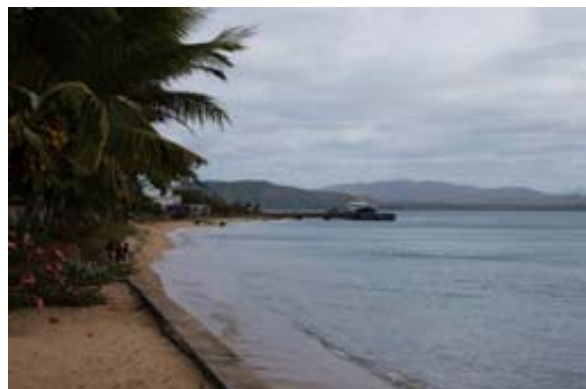
...derjenige beim Hotel Sol y Mar