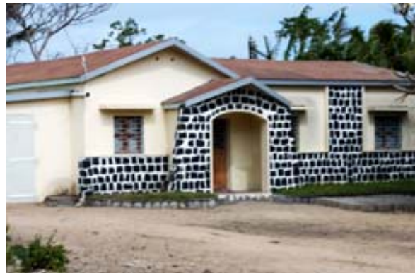
...moderne, schöne Villen