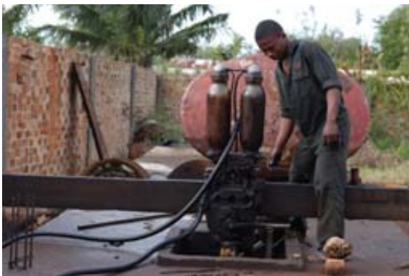
Private Tankstelle eines Chinesen und...