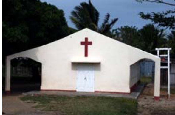
...die Katholische Kirche