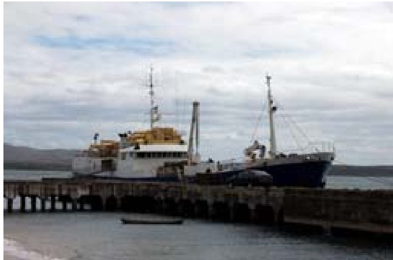
Meerschiff mit Matratzen im Hafen