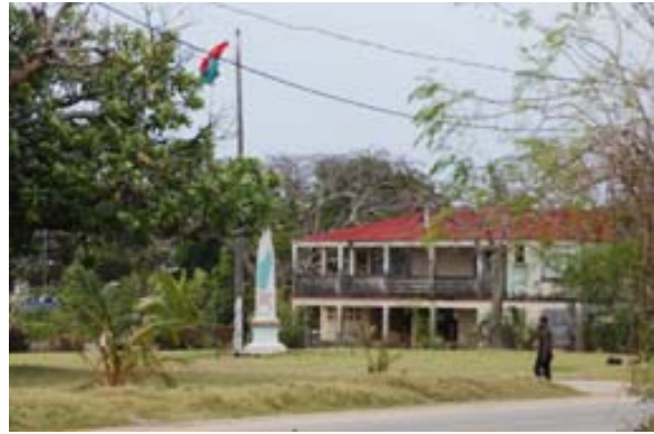
Platz der Unabhängigkeit mit dem Denkmal