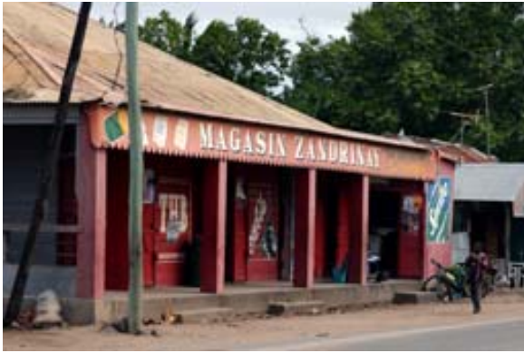
Geschäftshaus an der Hauptstrasse