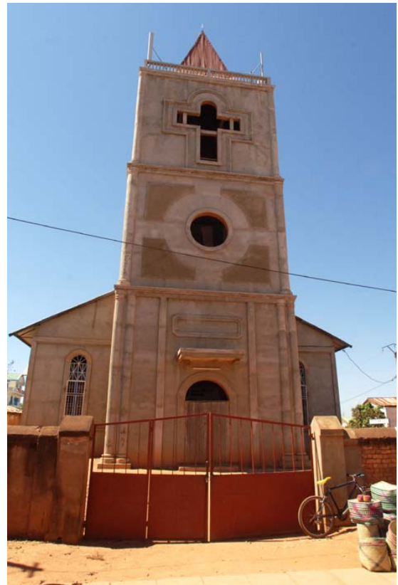
...aber noch nicht vollendet