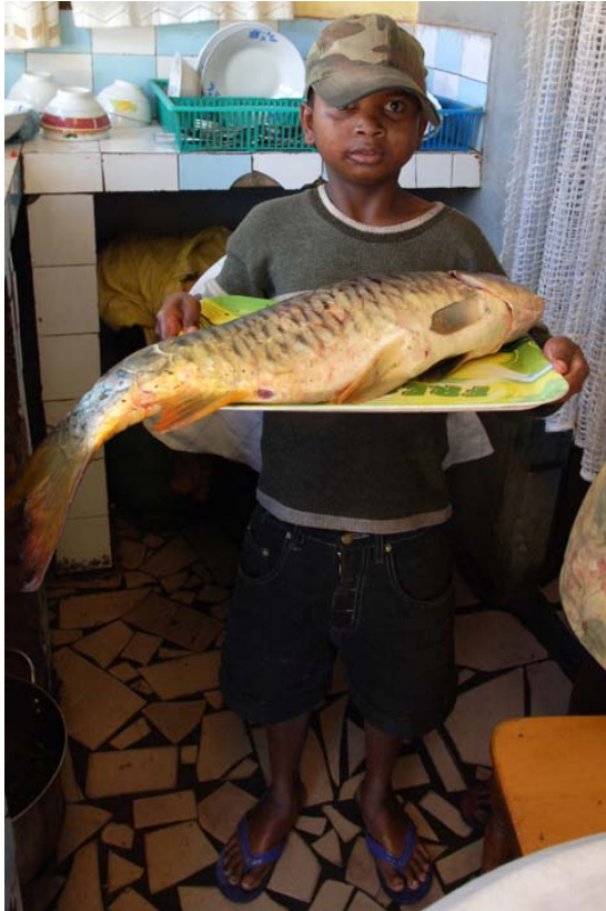
Kleiner Mann mit grossem Fisch