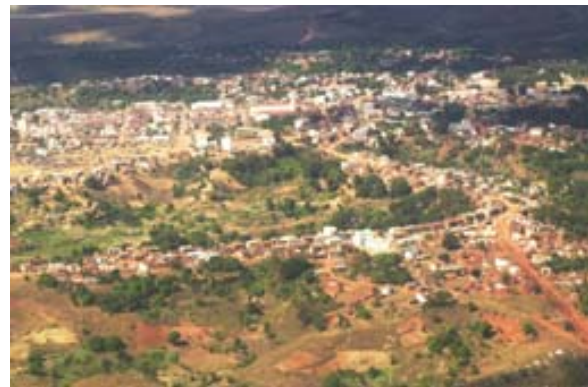
Luftaufnahme aus Antonov