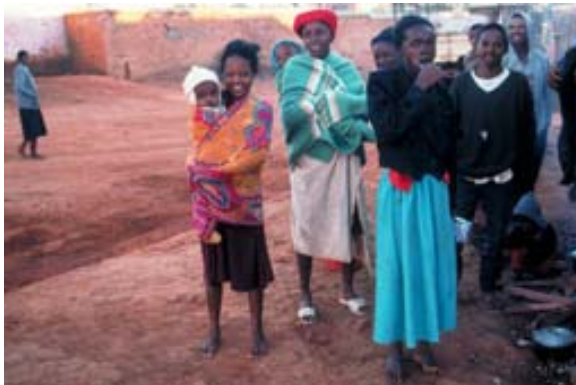
Beim Zähneputzen auf der Strasse