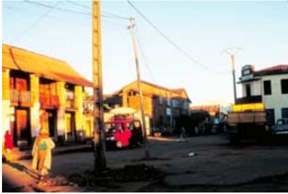
Platz vor dem Hotel in Morgensonne