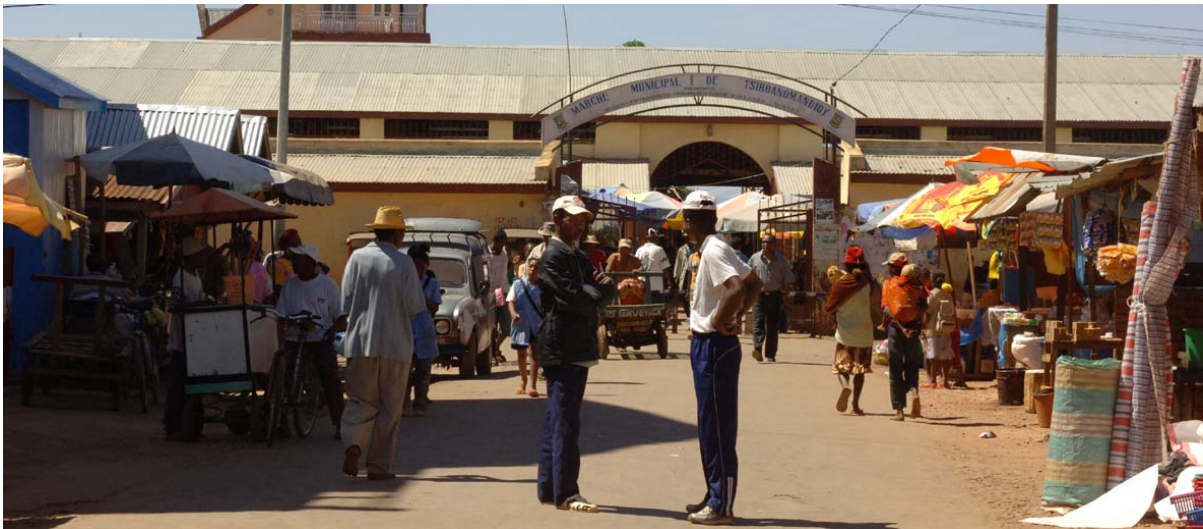
Haupt-Eingang zum gedeckten Markt