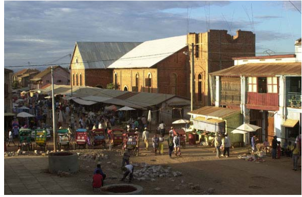
Hauptstrasse mit Kirche im Bau (2001)...