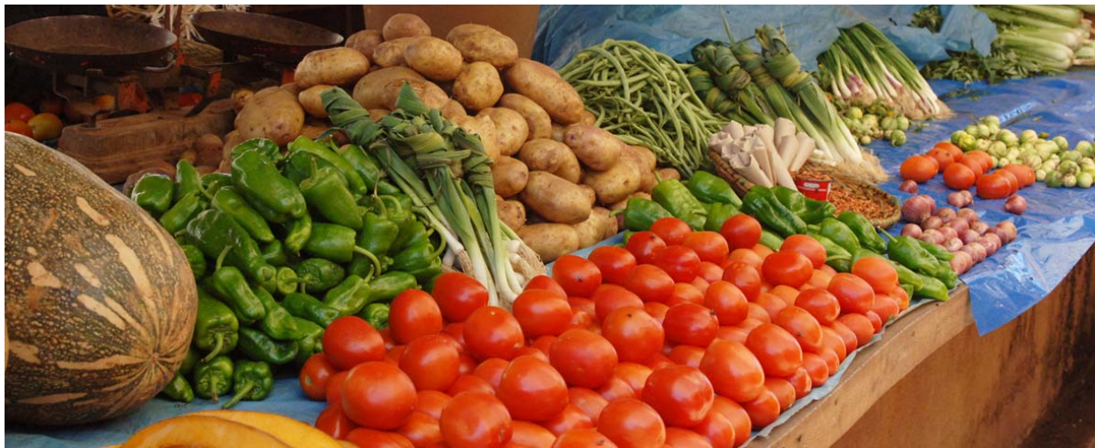
Reichhaltiges Angebot an Gemüse