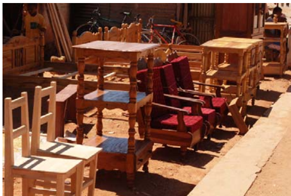
Möbelmarkt in Freien