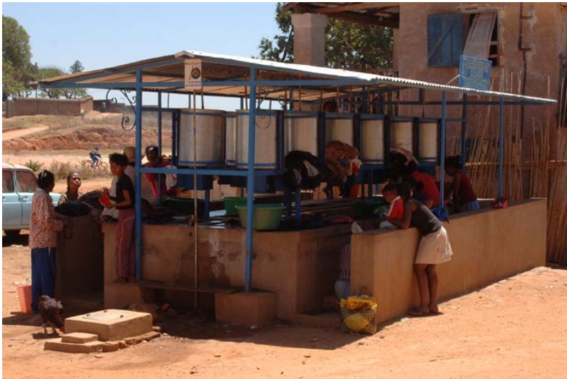
Washhaus in welchem das Wasser bezahlt werden muss – Spende...