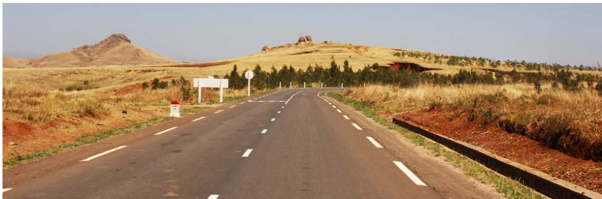
RN 1 ca. 50 Kilometer vor Tsiroanomandidy