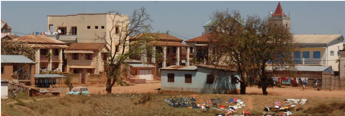
Ansicht der Stadt vom Norden her