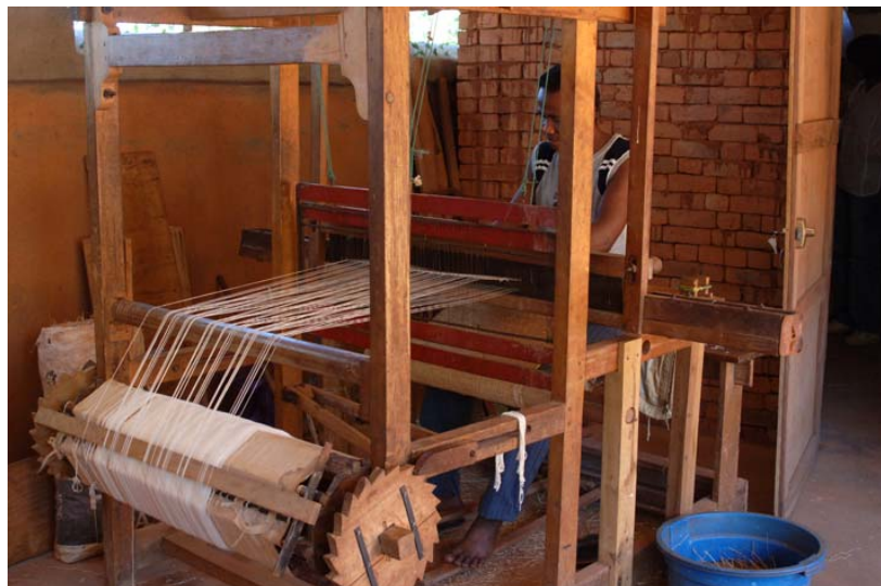
...Mann am Webstuhl und...