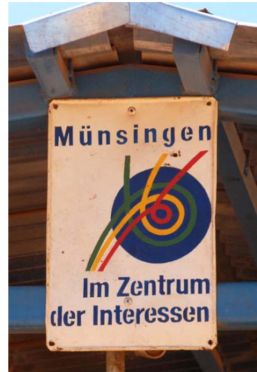
...einer NRO aus der Schweiz