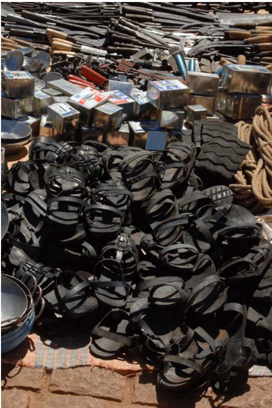
Schuhe aus Altpneu