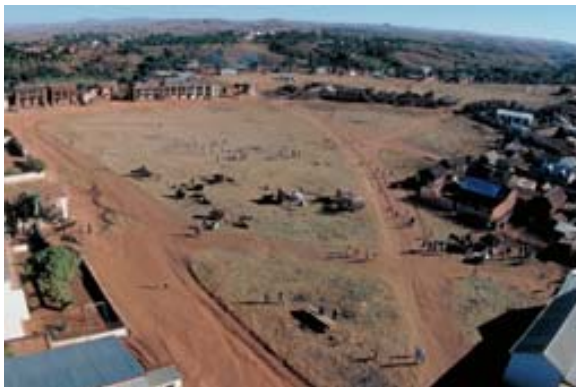
Vieh -Marktplatz aus Heissluftballon