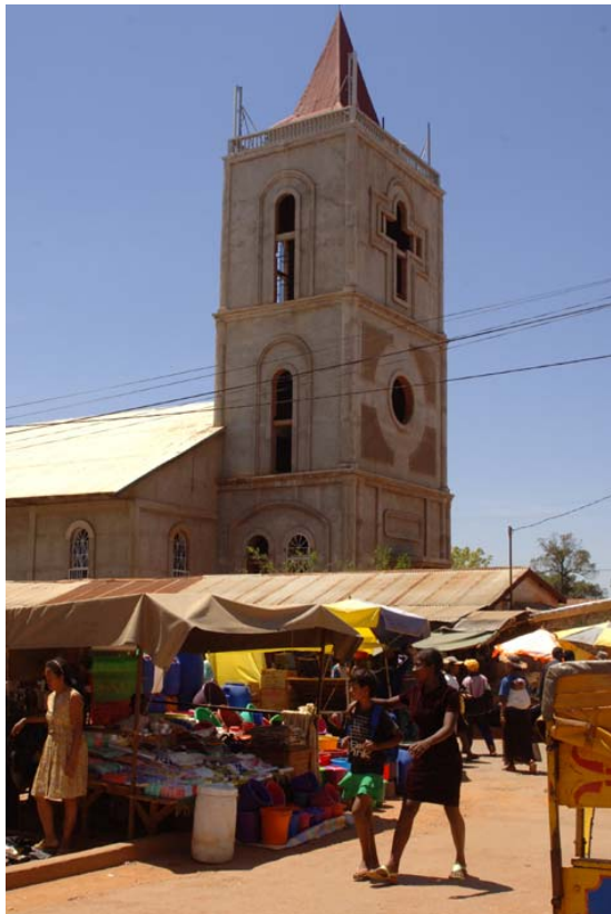
...und 2006 zwar weiter fortgeschritten,...