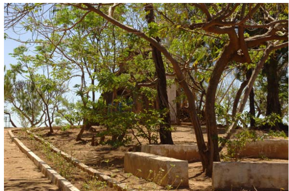
Marien- Denkmal in geschlossenem Park

Was ist neu Inhaltsverzeichnis Stichwortverzeichnis