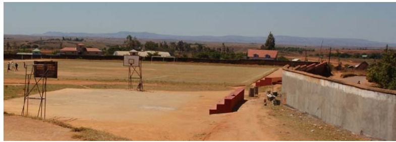
...verblüffend grossen Sport-Stadion