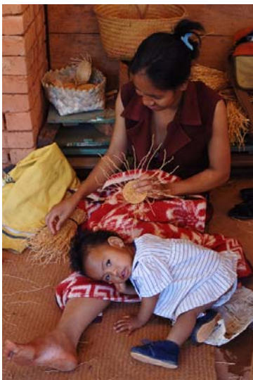
Frauen beim Arbeiten ,...