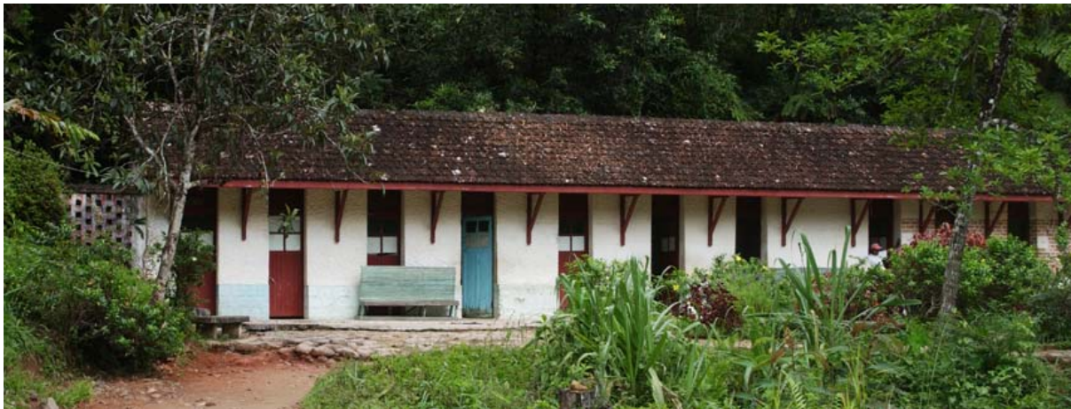
Badehaus mit Badekabinen mit Thermalwasser