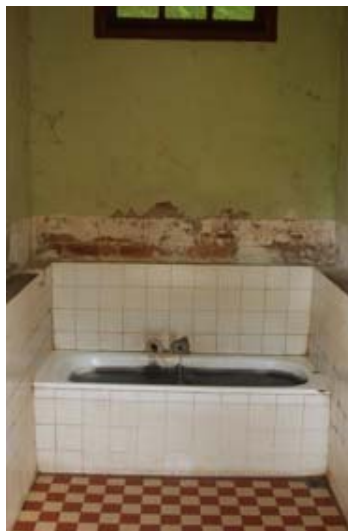
Badekabinen der Thermalstation