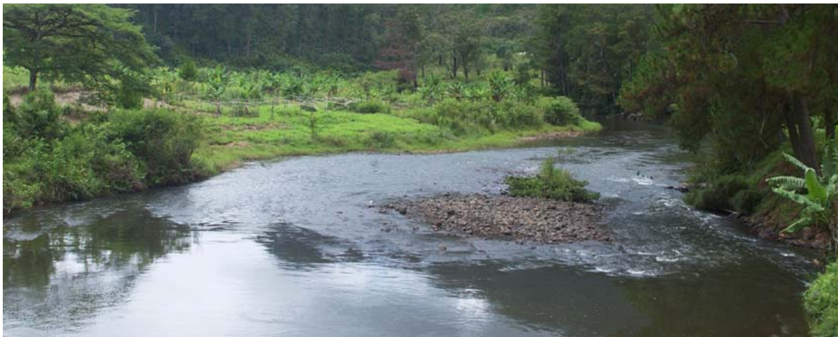
Fluss Namorona unterhalb der Brücke