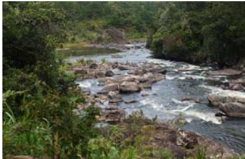
...und Flusses Namorona unterhalb des Ortes