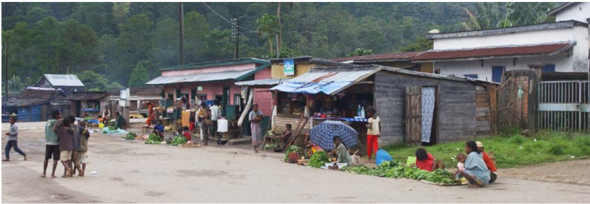
...kleiner Markt am Hauptplatz