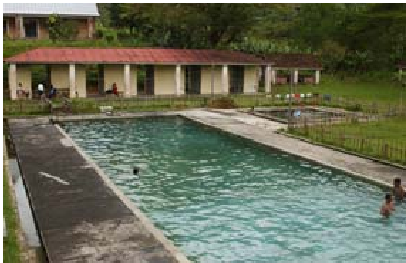
Öffentliches Schwimmbad mit Thermalwasser