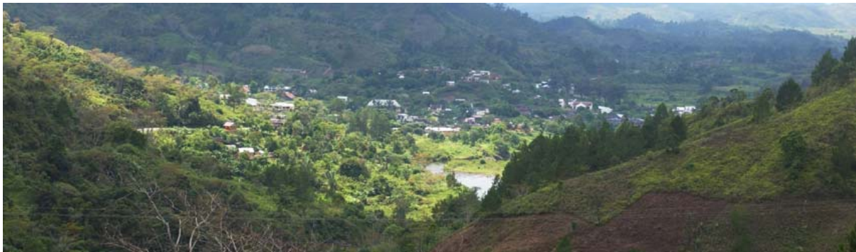
Blick von der RN 25 auf Ort