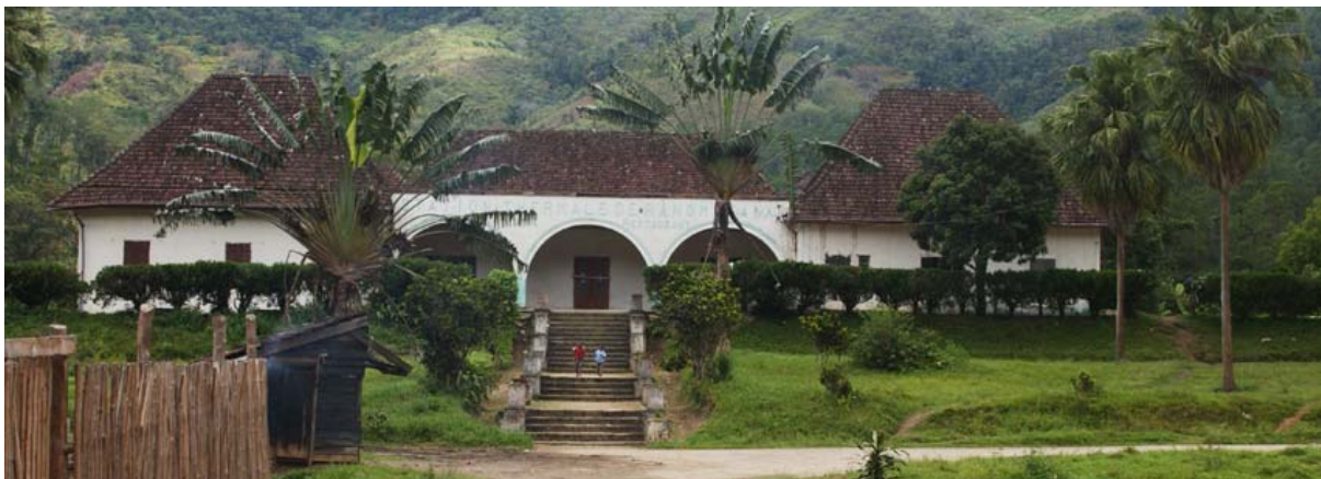
Ehemalige – heute geschlossene – Station Thermale