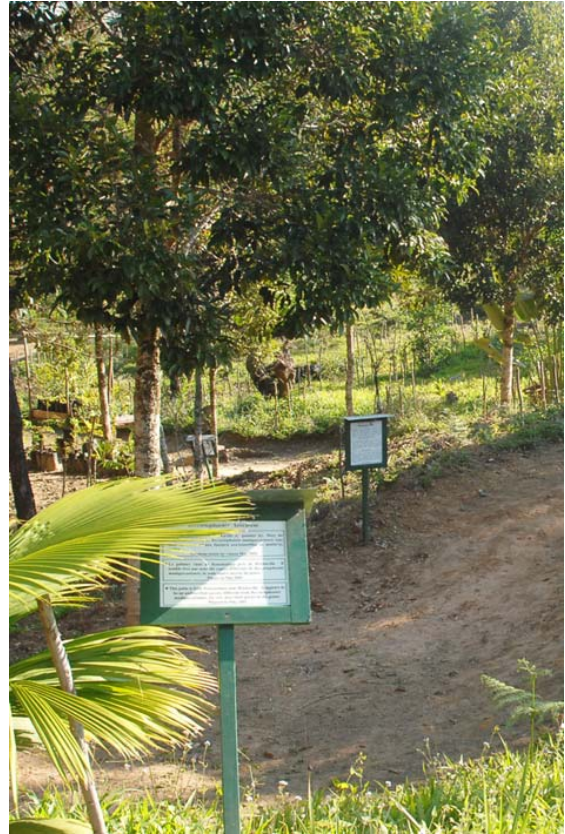
Arboretum mit 150 Pflanzen und Bäumen, die weitgehend endemisch sind

Was bietet Madagaskar und warum mit der DILAG-TOURS Madagaskar erleben? Wegen: