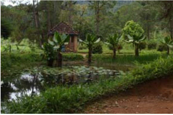
Parkanlage bei den Thermen