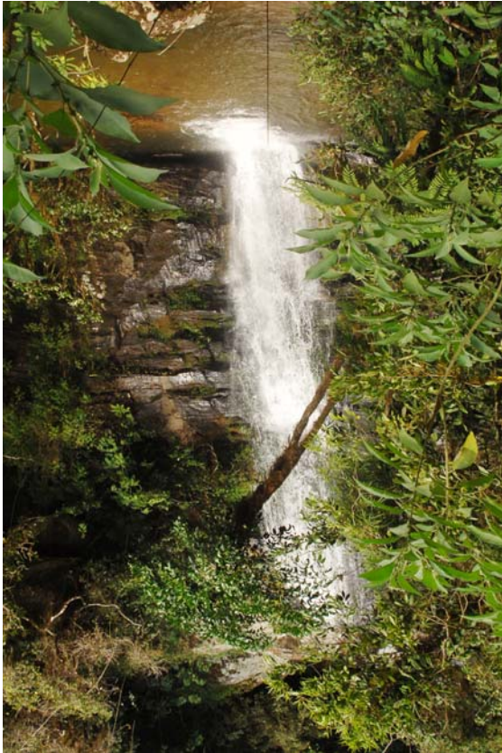
Wasserfall „Sakaroa“ in Nationalpark von Ranomafana, wo man auch Baden kann