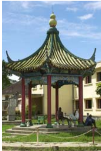
... Chinesische Pagode...