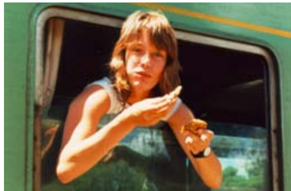
...Touristin am Fenster des Bahnwagens

Moramanga ist ein wichtiger Verkehrsknotenpunkt der Eisenbahnlinien des Hochlandes . Die Unterhaltsdienste der Bahnlinien von Tana über Moramanga nach Tamatave und Moramanga nach Ambatondrazaka sind hier stationiert.