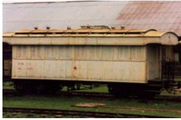
... Sanitätswagen ,...