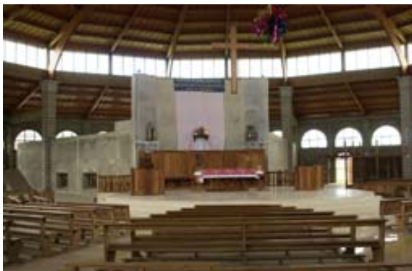
..innen mit dem Altar und...