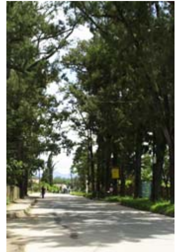
...und RN 2 in Moramanga