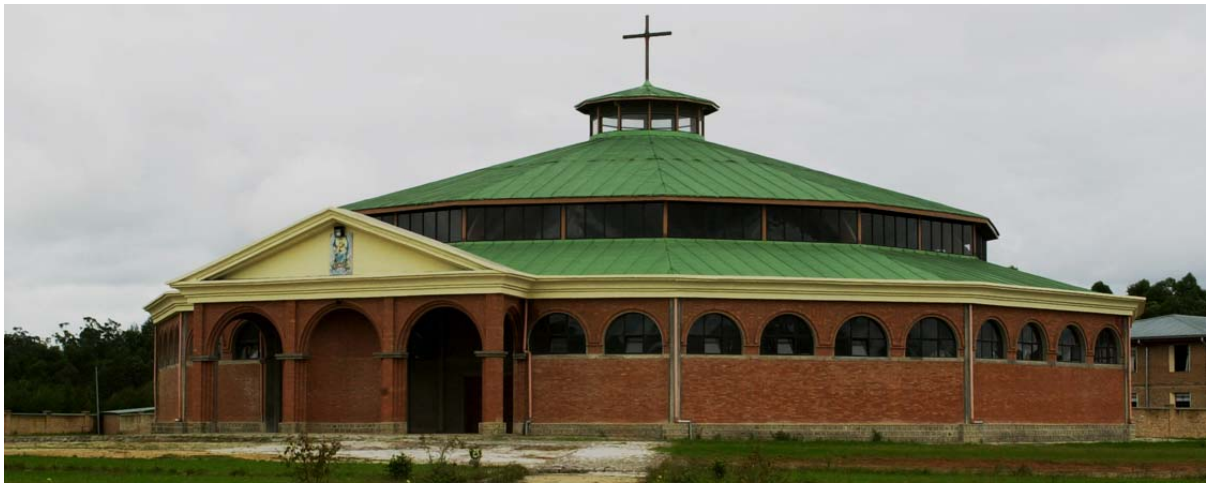
Neue, zwölfeckige katholische Kirche von aussen und...