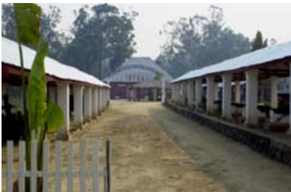
Eingang zum Museum

Stadtplan , welcher sich am Hauptplatz befindet