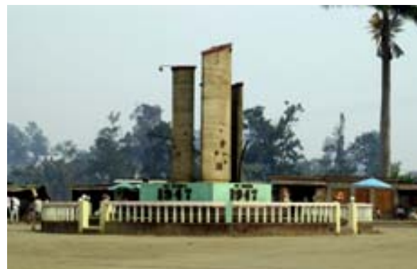
Denkmal am Kreisel beim Bahnhof