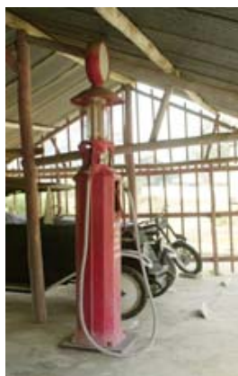
Tanksäule und alte Uniformen

Das Museum beinhaltet eine Sektion „ Geschichte “ mit Zeitdokumenten, Uniformen, und Utensilien, eine Sektion „Kriminologie“ mit Tatwaffen, Gewehren, Pistolen, am Zoll konfiszierter Kultgegenständen usw. Eine weitere Abteilung zeigt Exponate von Fahrzeugen (PW, Motorräder, Kutsche, Pousse-Pousse, Pirogen, eine alte Zapfsäule usw. Im Bereich des Zugangs sind Kanonen verschiedener Zeitepochen und zwei Eisenbahnwagen (Rekonstruktionen), in welchen Freischärler des Aufstandes des Jahres 1947 erschossen worden ausgestellt.