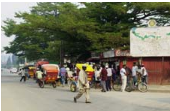
Hauptplatz mit vielen kleine Hotely

Das Verkehrsmittel der Stadt sind die Pousse-Pousse .