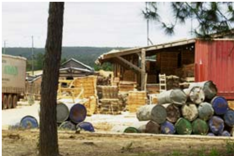
...und eine der zahlreichen Sägerei-Betriebe ausserhalb der Stadt

Die zahlreichen Holzverarbeitungs-Betriebe in der Umgebung von Moramanga stammen viele Produkte für die Bauwirtschaft von Madagaskar.