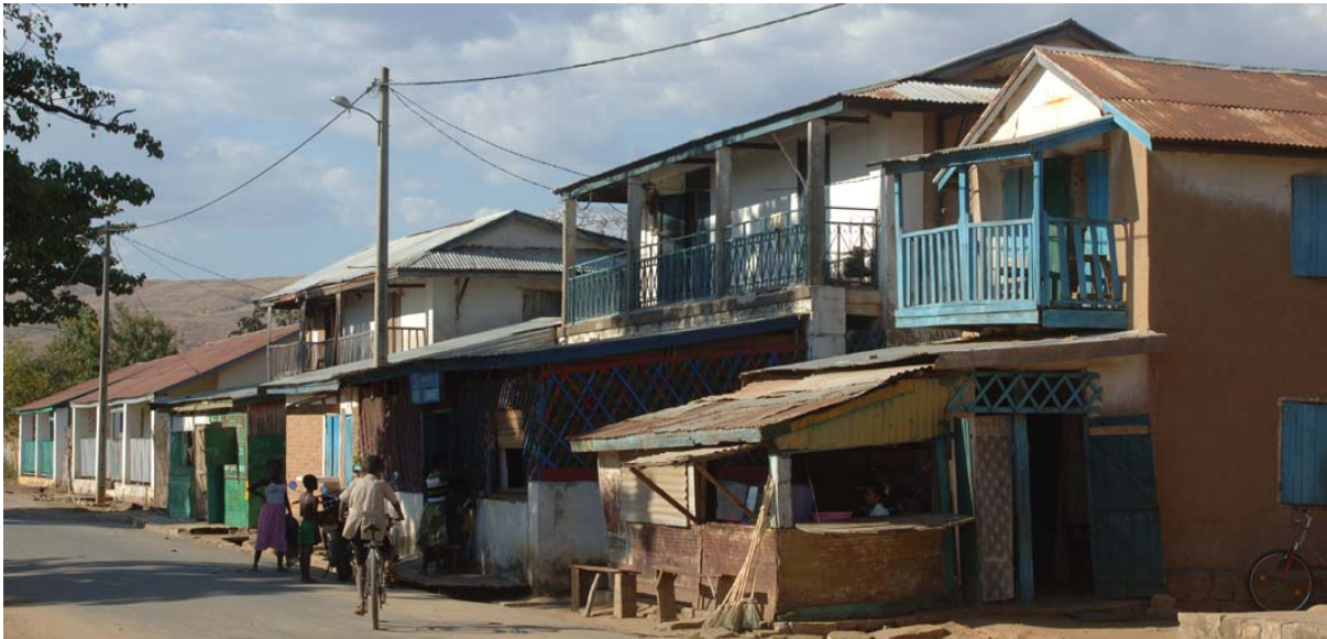
Ordentliche Wohnhäuser , aber...