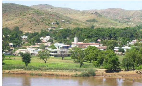
Miandrivazo und Fluss aus Flugzeug

Kleine Hotels, in welchen eine Nacht durchaus verbracht werden kann, sind vorhanden.