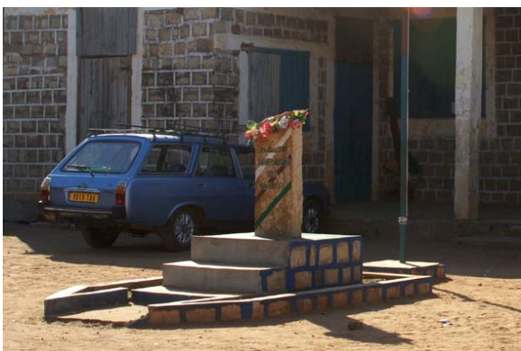
Denkmal vor dem Gemeindehaus