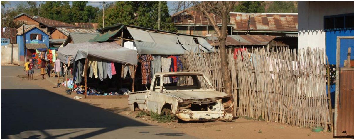
...auch Hütten einfachster Art findet man