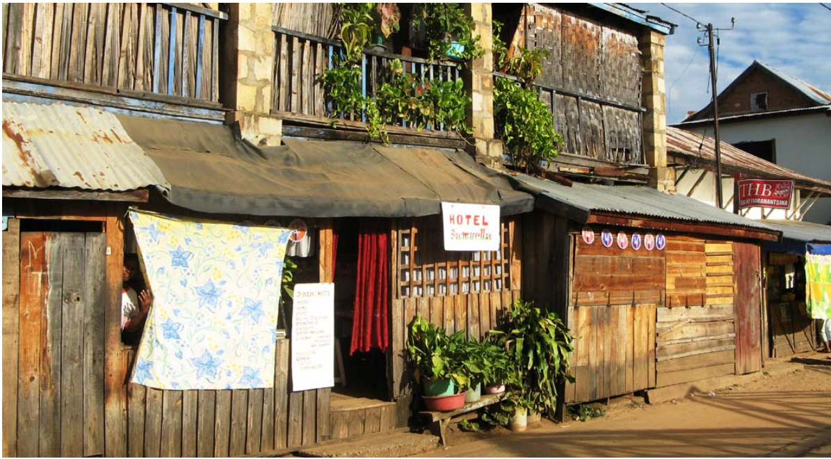
Eine sehr einfache Unterkunft