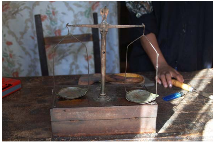
Goldwaage eines Edelsteinhändlers