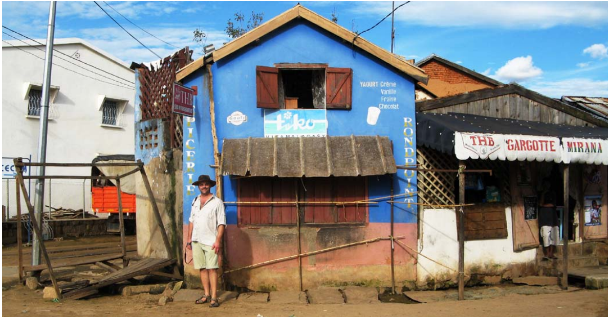
Bunte Geschäftshäuser ...