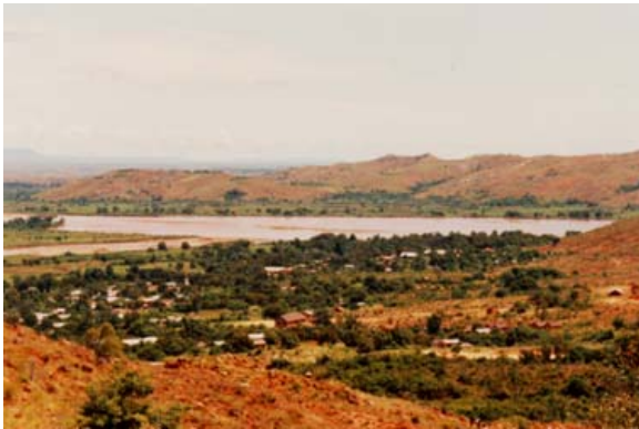
Fluss und Ort während der Trockenzeit

Von Miandrivazo aus unternimmt man die Flussfahrt auf dem Tsiribihina . In der Umgebung kann man auch der Jagd fröhnen.