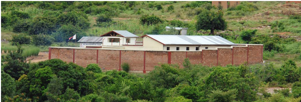
Neues, zweites Gefängnis, wo vor Allem Zebudiebe eingesperrt werden