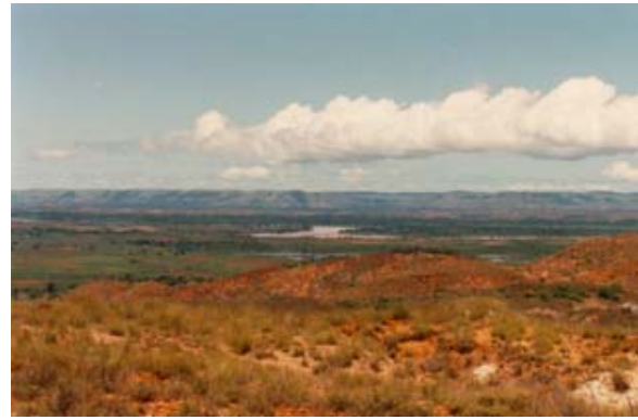
Fluss und Tal bei Miandrivazo

Oberhalb der Ortschaft genießt man eine sehr schöne Aussicht über das breite Tal, in welchem sich die Flüsse Mania , Sakeny und Mahajio zum Tsiribihina vereinen.