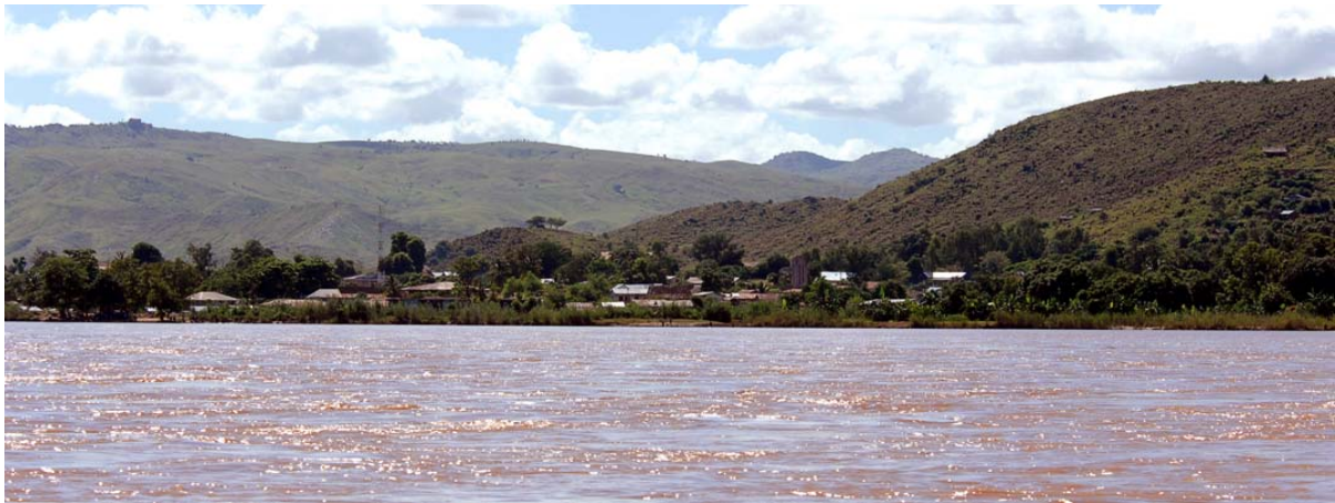
Miandrivazo vom Fluss aus, nach dem Beginn einer Kleinen West-Tour