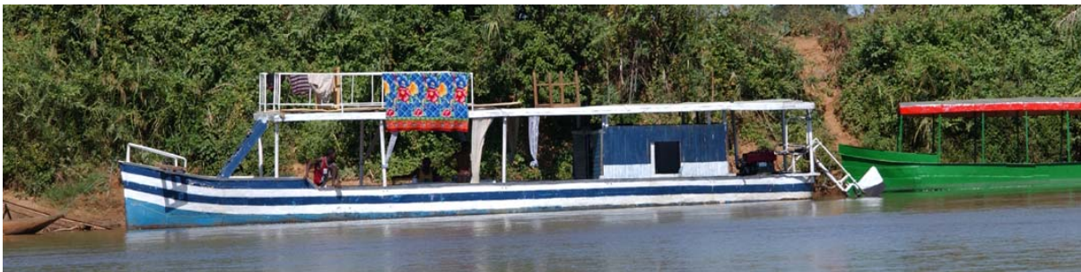
Zwei der an die zwanzig Boote die den Tsiribihina befahren