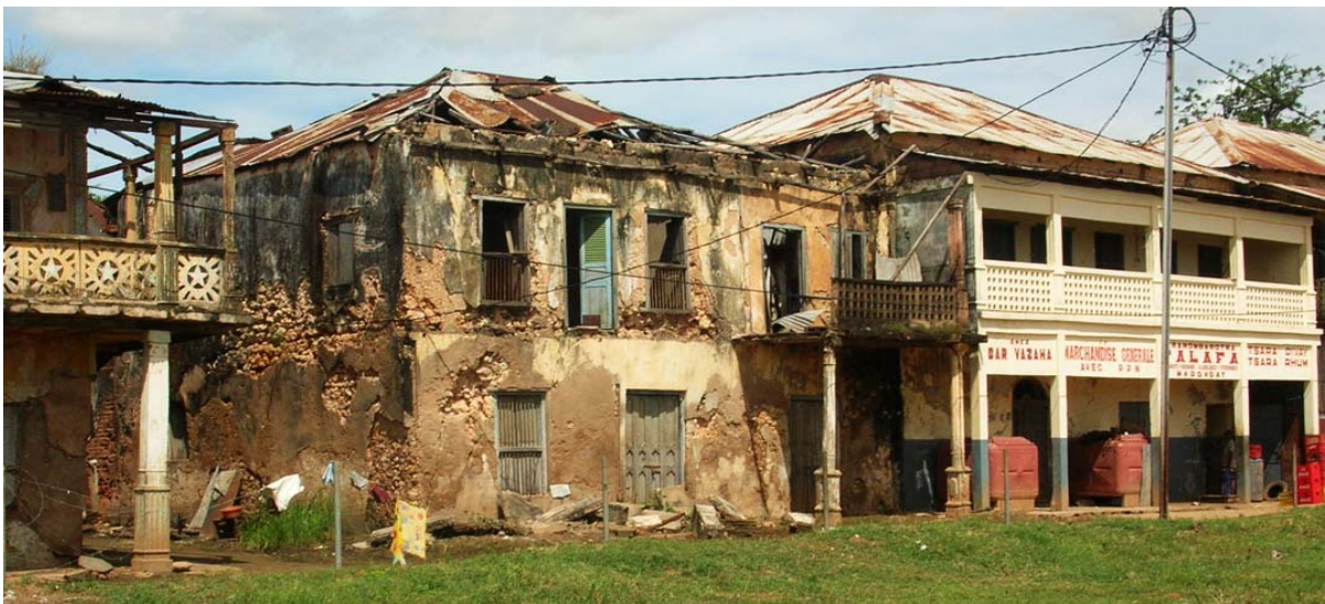
...die daran liegenden Gebäude sind völlig verrottet

Je nach Höhe des Wassertandes kann man von Marovoay aus mit Booten nach Mahajanga gelangen. Den Fahrpreis konnten wir leider noch nicht ausfindig machen.