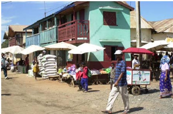
Hauptplatz mit Läden und Ständen ...