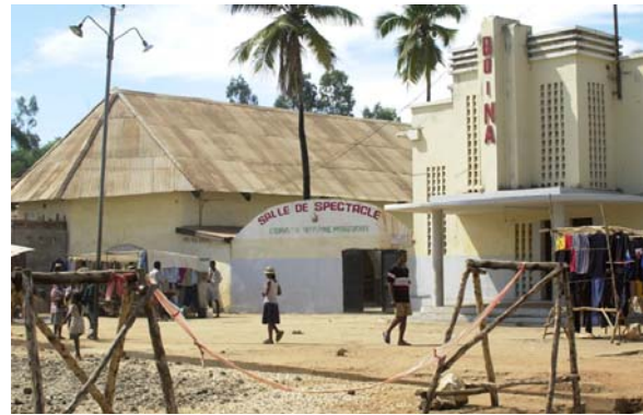
...und dem „Salle de Spectacle“

In Marovoay kann man sich auf dem Markt noch mit dem Notwendigsten (Kerzen, Petrollampe, Lampenöl, Mineralwasser, Früchte usw.) eindecken, wenn man im Park von Ankarafantsika campieren möchte.