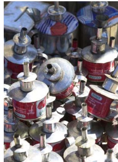
Stand mit Petrollampen aus alten Konservendbüchsen |

Die Gegend östlich von Marovoay gilt als eine der grossen Reiskammern von Madagaskar, in welchen Reis zwei Mal jährlich angebaut wird.