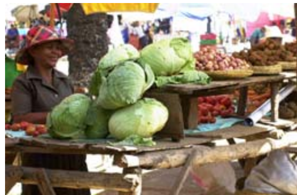
Gemüsestand auf dem Markt

Beachten: In Madagaskar gibt es noch weitere Orte mit dem gleichen Namen, so u.a. an der RN 44 von Moramanga nach Ambatondrazaka