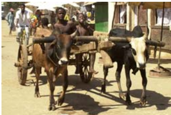
Junge mit Ochsenkarren im Ort

In Marovoay kann man sich auf dem Markt noch mit dem Notwendigsten (Kerzen, Petrollampe, Lampenöl, Mineralwasser, Früchte usw.) eindecken, wenn man im Park von Ankarafantsika campieren möchte.