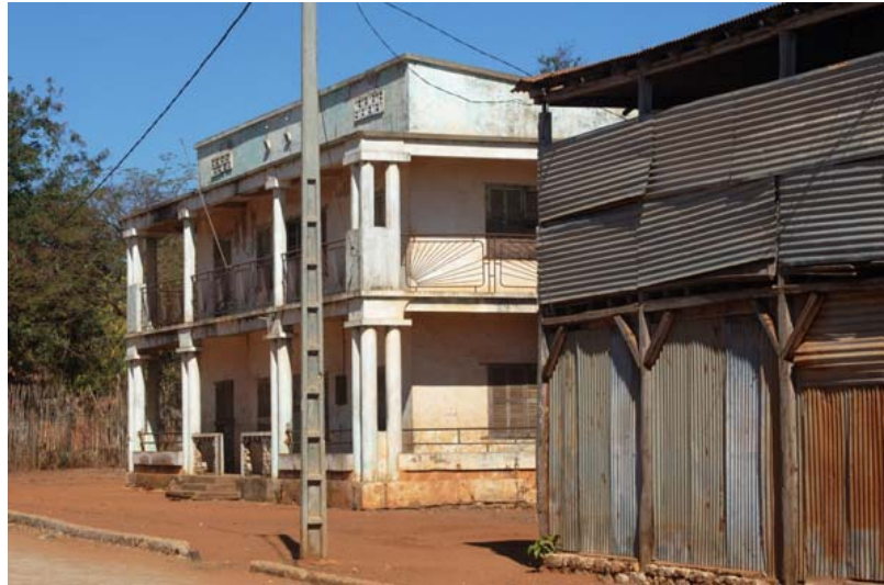
Wohn- und Geschäftshäuser