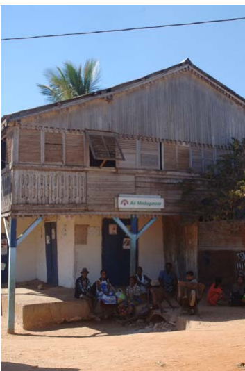
Büro der Air Madagascar