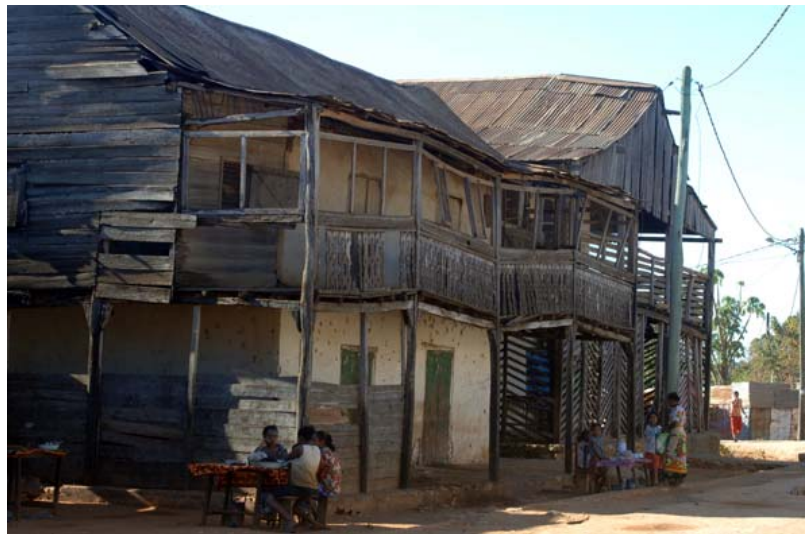
Halb zerfallenes Haus

Was ist neu Inhaltsverzeichnis Stichwortverzeichnis