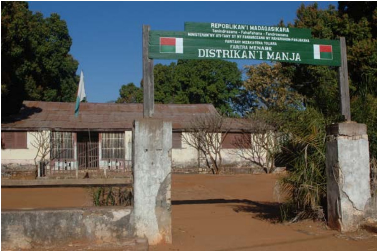
Verwaltungsgebäude am Hauptplatz

▶ Siehe auch unter „ Distanz- und Fahrzeit-Tabellen “ – Fahrzeiten sowie Tabelle „Distanzen – ganze Insel“ sowie Tabelle „Distanzen - Westen“, unter „ Geographie “ – Westen , unter „ Glossar “ – Manja, unter „ Hotels “ – Liste der Hotels / Manja , unter „ Hotelliste “ – Manja, unter „ Postleitzahlen “, unter „ Reiserouten “ – Grosse West-Tour , unter „ Toten- und Ahnenkult “ und unter „ Touristik-Karten “ – Westen .