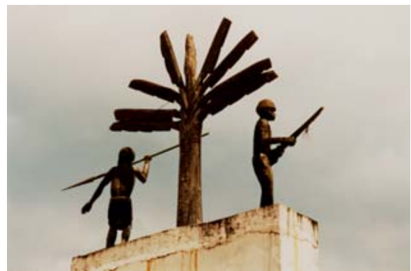
Denkmal in Vohilava

▶ Siehe auch unter „ Baden “ – Liste der Badestrände / Osten , unter „ Bevölkerung “, unter „ Distanz- und Fahrzeit-Tabellen “ – Fahrzeiten sowie Tabelle „Distanzen - ganze Insel“ sowie Tabelle „Distanzen – Osten“, unter „ Einwohner “, unter „ Geographie “ – Osten , unter „ Glossar “ – ACN, Ambohitsara, Ankatafana, unter „ Hotels “ – Liste der Hotels / Mananjary , unter „ Hotelverzeichnis “ – Mananjary, unter „ Infrastruktur “ – Brücken , Strassen , unter „ Nationalstrassen “, unter „ Orte-Info-Blätter “ – Mananjary , unter „ Ortschaften “ – Mananjary , unter „ Postleitzahlen “, unter „ Reiserouten “ – Grosse Süd-Tour , Ost-Tour , Süd-Nord-Tour und Eisenbahn-Tour , unter „ Tiere “ – Insekten , und unter „ Touristik-Karten “ – Osten .