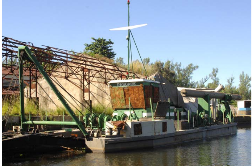
... Schiffe im Flusshafen am Pangalanes von Mananjary