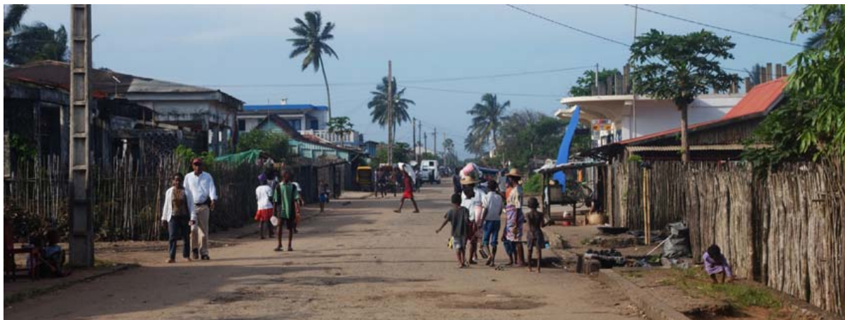
Hauptstrasse in Richtung Norden zum Flughafen