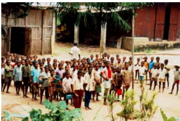
Fahnenaufzug in Landschule