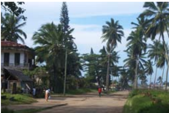
Strasse am Meer bei den beiden Hotels