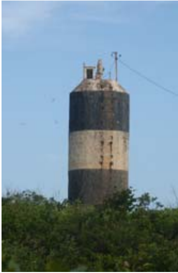
Der Leuchtturm ,...