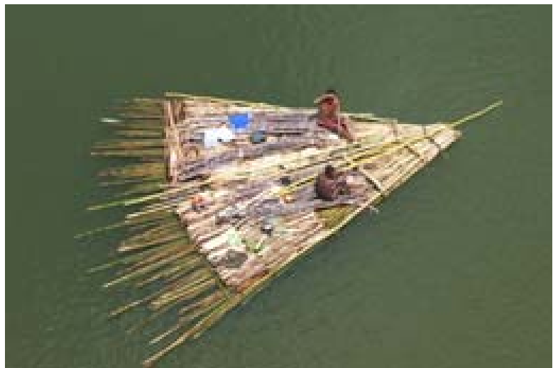
... Anjilanjila über den Mananjary- Fluss und Floss aus Bambus