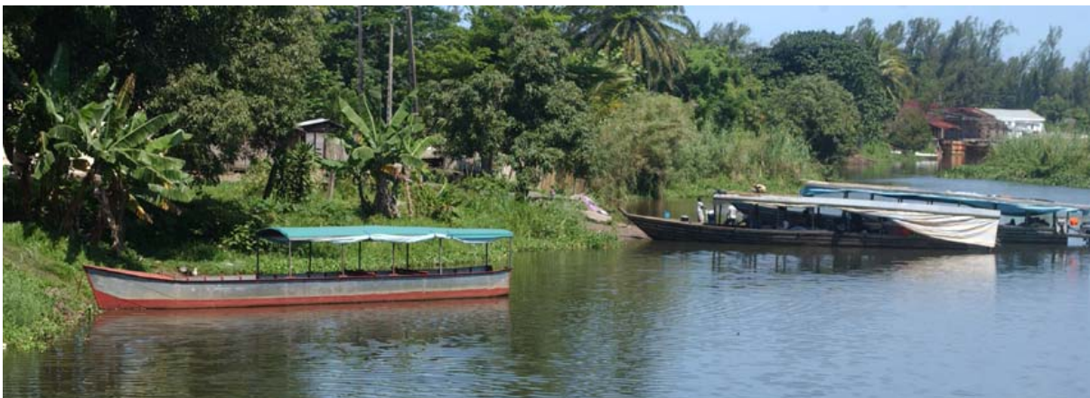
Flusshafen am Kanal Pangalanes

Was ist neu? Inhaltsverzeichnis Stichwortverzeichnis