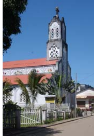
...Kirchen prägen das Bild