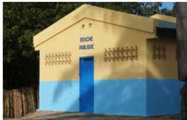
Öffentliche Dusche am Kanal

Was ist neu? Inhaltsverzeichnis Stichwortverzeichnis