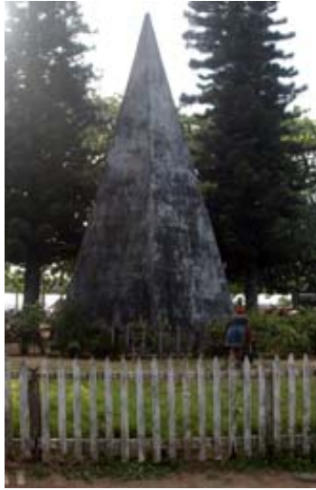
...ein Denkmal und...