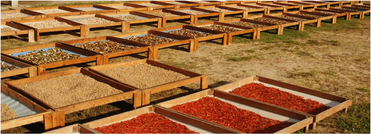
Trocknen von Gewürzen aller Art in der „La Plantation“ beim Vahiny Hotel