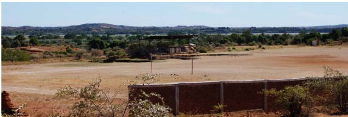
Sport- und Fussball-Stadion an der RN 4