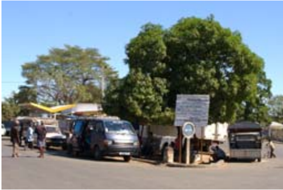
Hauptplatz mit Tankstelle an der RN 4