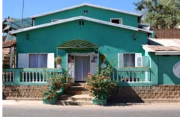
Restaurant Chou Chou

▶ Siehe auch unter „ Distanz- und Fahrzeit-Tabellen “ – Tabelle „Distanzen - Norden“ und Tabelle „Distanzen – Westen“, unter „ Geographie “ – Hochland, Norden , unter „ Gewässer “, unter „ Glossar “ – Maevatanana, unter „ Infrastruktur “ – Strassen , unter „ Klein- und Kleinst-Unternehmen “, unter „ Nationalstrassen “ – RN 4, unter „ Ordnungskräfte “, unter „ Orte-Info-Blätter “ – Maevatanana , unter „ Ortschaften “ – Maevatanana , unter „ Postleitzahlen “, unter „ Reiserouten “ – Kleine Nord-Tour , Grosse Nord-Tour sowie Zusatzprogramm Mahajanga , unter „ Touristik-Karten “ – Westen und unter „ Verkehrsmittel “ – Taxi Brousse .