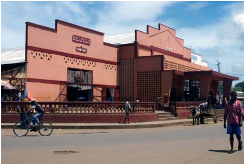
Grosse Markthalle mitten im Ort – Fassade wie in DDR-Zeiten und...