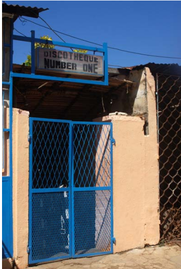
Eines der zahlreichen Dancings