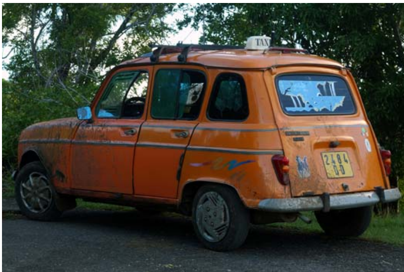
Taxi auf dem Mont Passot und das einzige Motorrad mit...