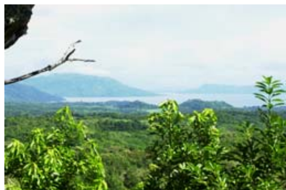
Blick gegen Hell Ville vom Mont Passot

Was ist neu Inhaltsverzeichnis Stichwortverzeichnis