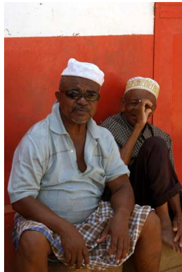
Muslime am Strassenrand sitzend