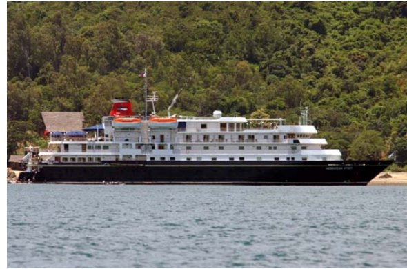
Kreuzfahrtschiff angelegt bei Nosy Komba