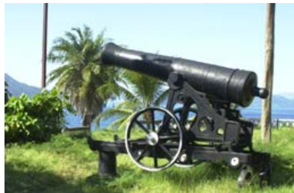
Kanonen von Hell Ville