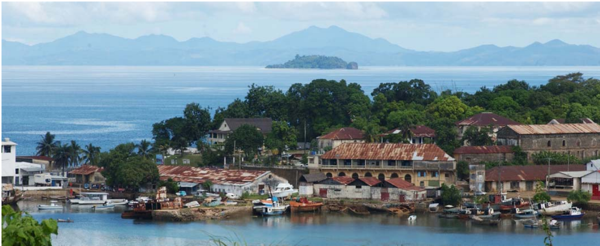
Hafengebiet mit Nosy Tanikely im Hintergrund