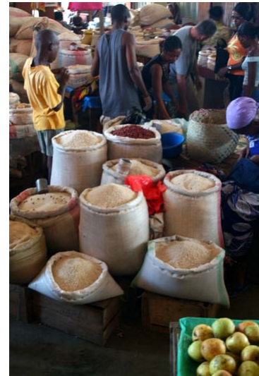
...einem reichhaltigen Angebot im Innern