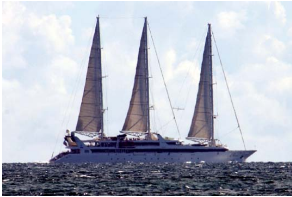
Luxus-Jacht vor Nosy Be