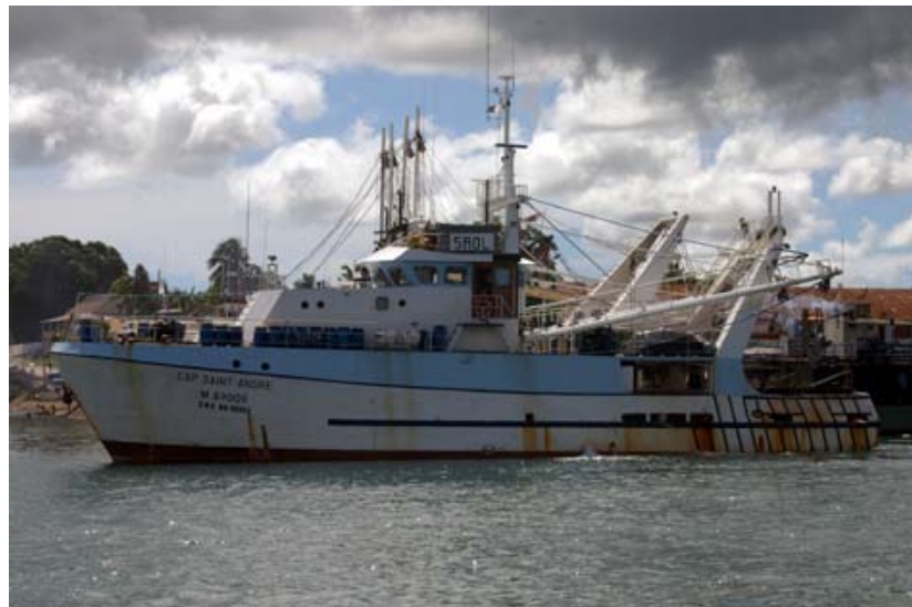
... und Fischer -Kutter – prägen das Bild des Hafens