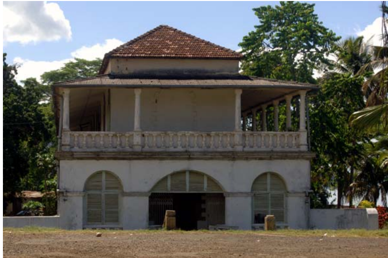
Ehemalige herrschaftliche Villa