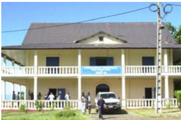
Liegenschaft mit der Distrikts-Regierung