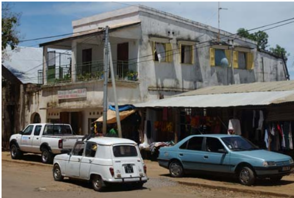
Gebäude mit Laden...