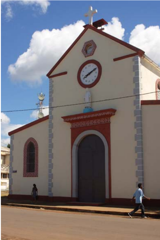
Kirche mit Uhr und einem...