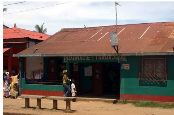
...an der Hauptstrasse