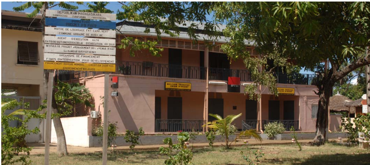
Filiale einer der verschiedenen Banken (oben) und die Post (unten)