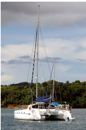
Schiffe – ein Katamaran...