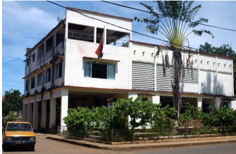
Stadthaus von Hell Ville