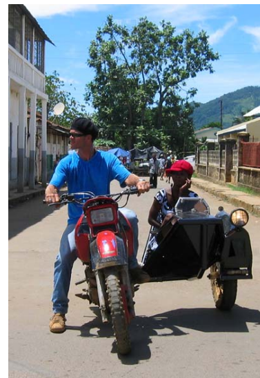
...Seitewagen im Land