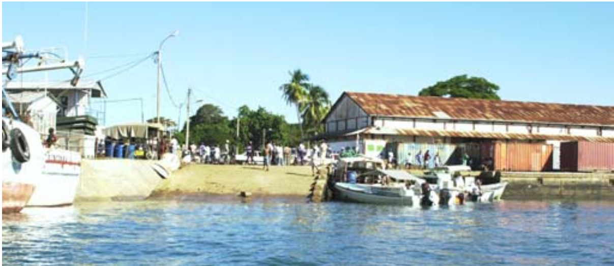
Landeplatz der Schnellboots von Ankify im Hafen