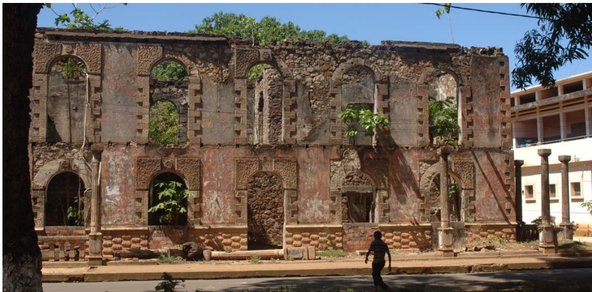
Ruine eines ehemaligen prunkvollen Gebäudes