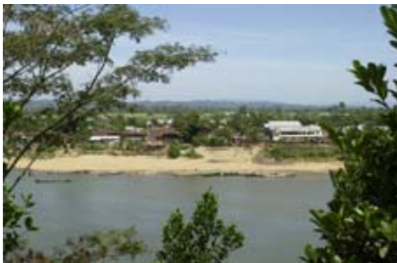
Blick auf den Ort