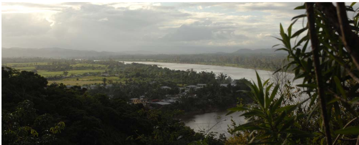
...den Häusern auf der rechten Flussseite des Rianala

▶ Siehe auch unter „ Distanz- und Fahrzeit-Tabellen “ – Fahrzeiten sowie Tabelle „Distanzen - Osten“, unter „ Geographie “ – Osten , unter „ Glossar “ – Rianila, unter „ Infrastruktur “ – Brücken , unter „ Ortschaften “ – Vatomandry , unter „ Postleitzahlen “, unter „ Reiserouten “ – Zusatzprogramm Tamatave , unter „ Schreibweise der Ortsnamen “, unter „ Touristik-Karten “ – Osten und unter „ Überschwemmungen/Hochwasser “.