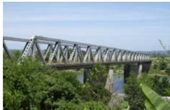
kombinierte Eisenbahn- und Strassenbrücke

Ca. 11 km in Richtung Tamatave zweigt die Piste nach Ambila Le Maitso ab. Am Kanal sind verschiedene Hotels gelegen.