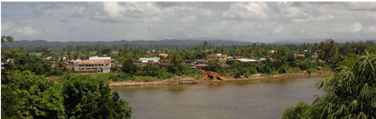
...auf der linken Flussseite (von Ferne) und...