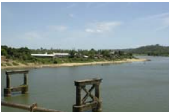
Überreste der alten und neue,...