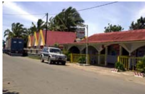
Restaurant Florida und Hotel Bricka Cool