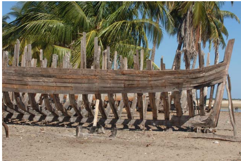
...neue Holzbarken die so genannten Boutry gebaut