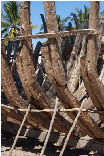
Am Strand werden laufend...