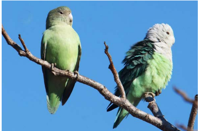
... und die Grauköpfchen – les Inséparables - genannt