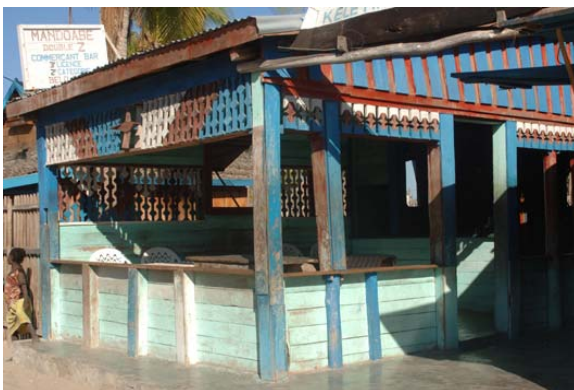
Double Z in Dorf, wo immer was los ist und...