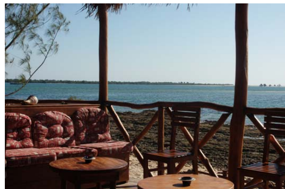
...Restaurant des Hotels La Marina

▶ Siehe auch unter „ Baden “ – Liste der Badestrände / Westen , unter „ Distanz- und Fahrzeit-Tabellen “ – Fahrzeiten / Westen, unter „ Geographie “ – der Westen , unter „ Hotels “ – Liste der Hotels / Belo-sur-Mer , unter „ Hotelliste “ – Belo-sur-Mer, unter „ Industrie “, unter „ Orte-Info-Blätter “ – Morondava , unter „ Ortschaften “ – Belo-sur-Mer , unter „ Pflanzen “ – Affenbrotbaum , unter „ Reiserouten “ – Flussfahrt auf dem Manambolo , Kleine West-Tour , Grosse West-Tour sowie Zusatzprogramm Rundflug Lac Itasy/Tsingy/ Morondava , unter „ Sportaktivitäten “ – Baden und Schwimmen , Tauchen , Wassersport , unter „ Touristik-Karten “ – Westen / Symbole und unter „ Wahrzeichen und Highlights “ – Korallenriffe.