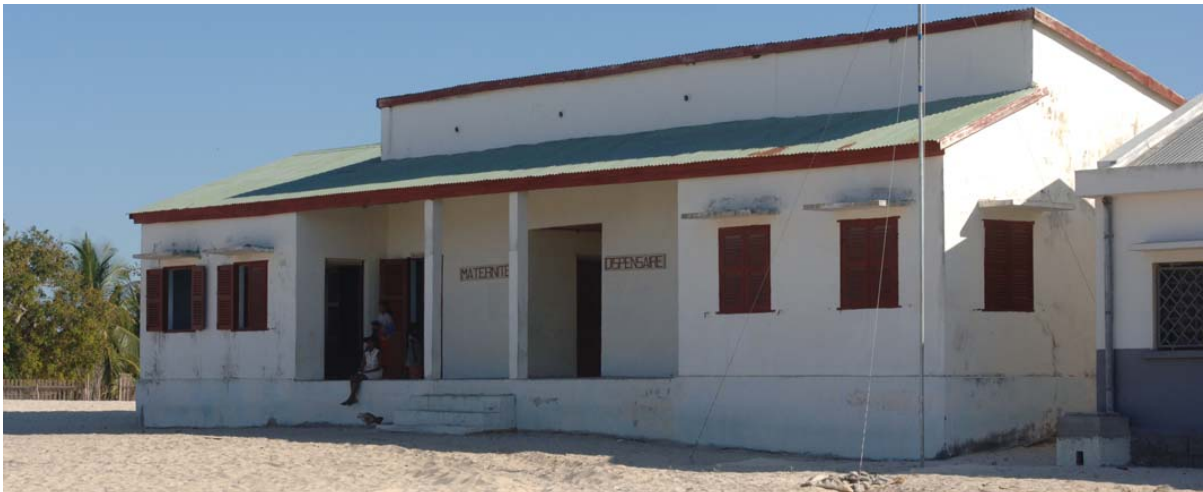
Spital mit drei Patienten-Betten