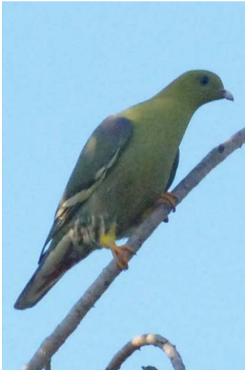
Graunasen-Grüntaube , die auch gejagt werden ...