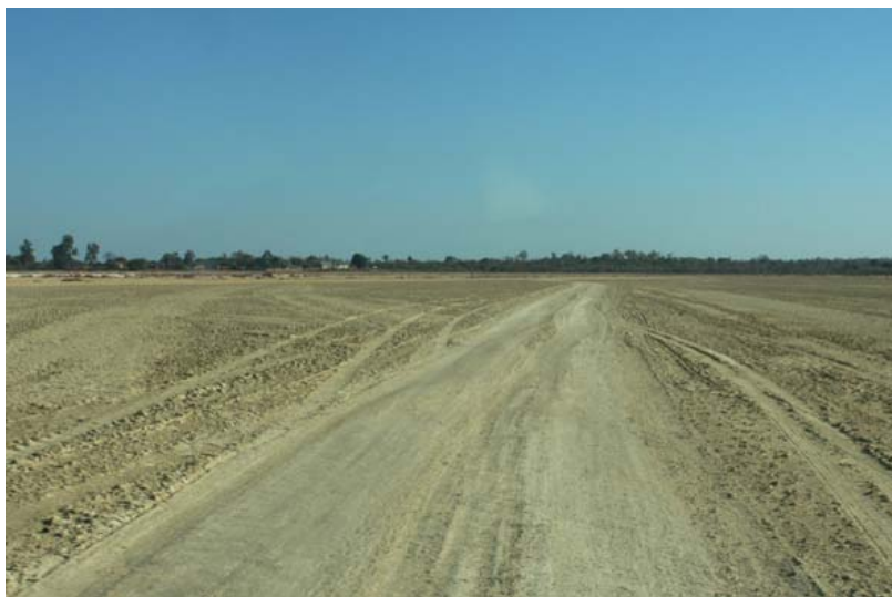
Die Zufahrt führt über ein flaches, oft überschwemmtes Gebiet über...

Vorhanden sind: 🍷 📺 🏠 ✈️ Privatpiste 🌿 🦋 Baobabwald 🌳