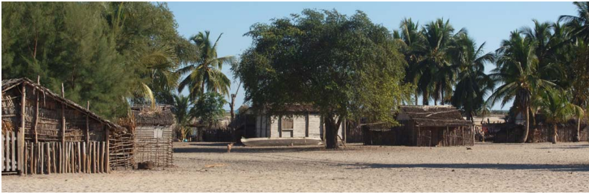
Dorfplatz mit Bäumen und tiefem Sand, in welchem man gerne stecken bleibt