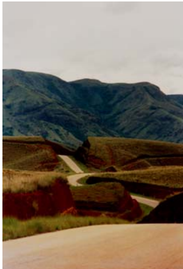
RN 31 nach Bealanana