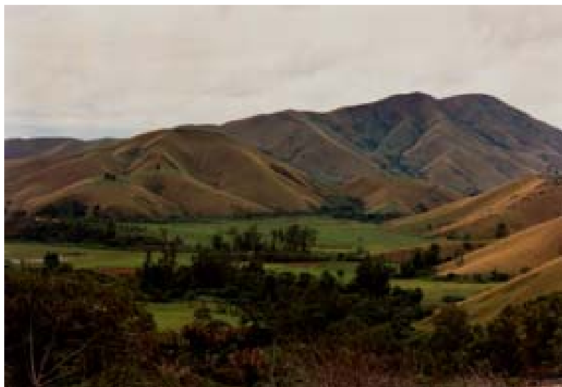
Völlig abgeholzte Berge bei der Ortschaft

Was ist neu? Inhaltsverzeichnis Stichwortverzeichnis