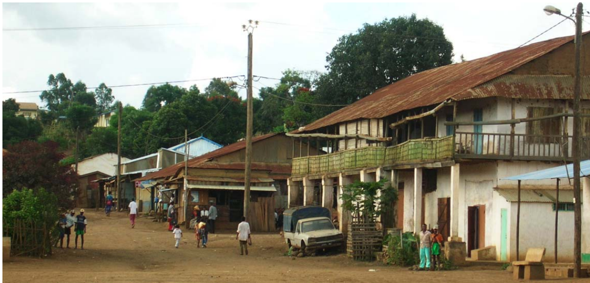
Seitenstrasse des Ortes