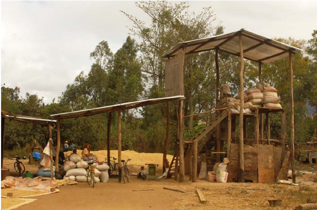
Mechanisierte Reismühle am Eingang zum Ort