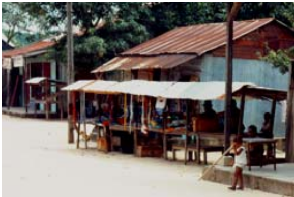
Hauptstrasse mit Ständen...

Ebene vor der Ortschaft – siehe Panoramabilder