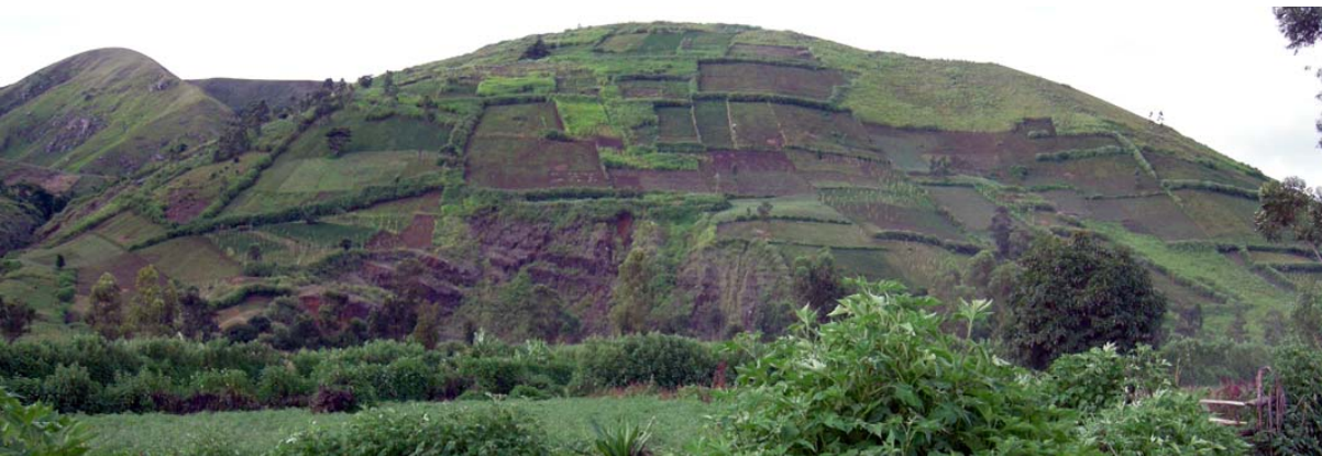
Auch steile Hänge werden landwirtschaftlich genutzt