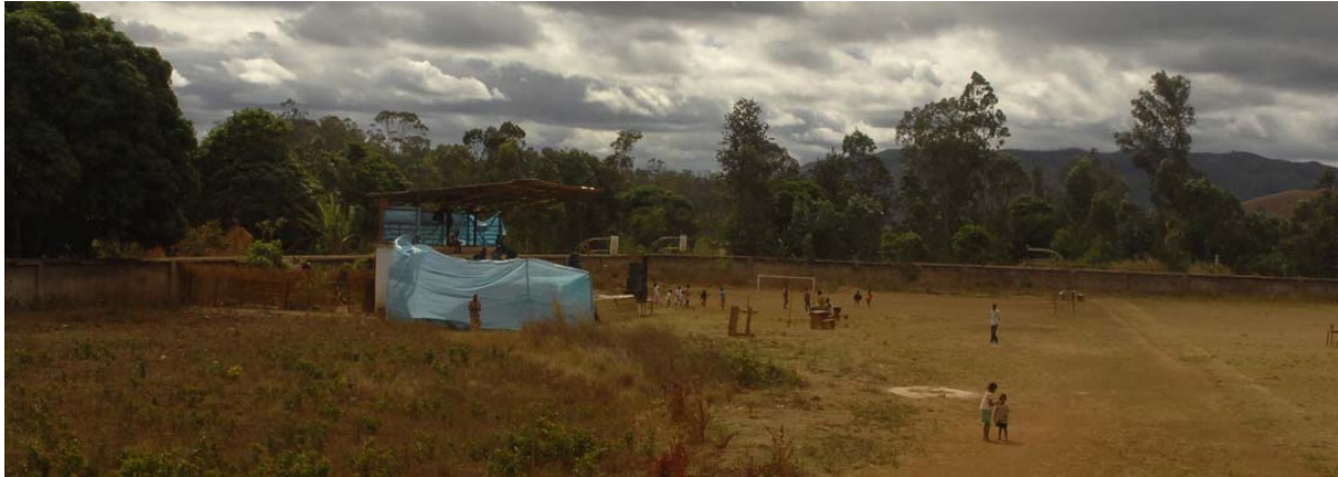
Sportstadion mit Volksfest in Vorbereitung