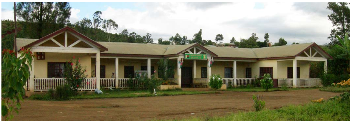
Stadthaus an Ortschaftseingang und...

Die Gegend wird als Reiskammer des Nord-Westens von Madagaskar bezeichnet.