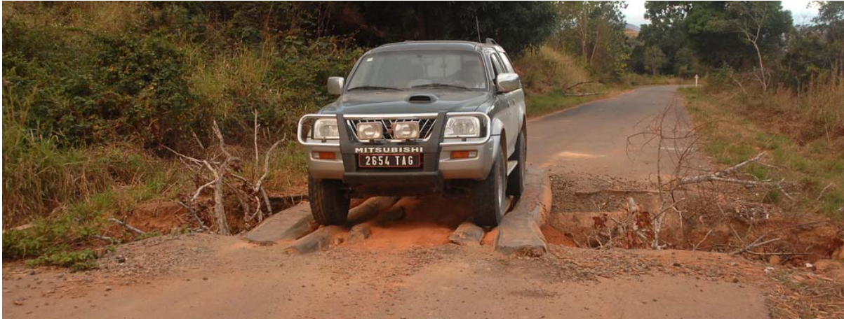
L200 der DILAG-TOURS auf einer provisorischen Brücke