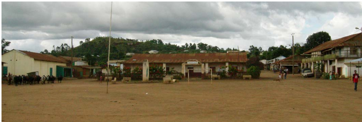
...der Hauptplatz mit einem Fussballfeld