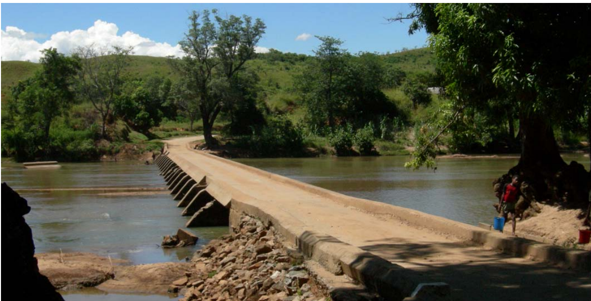
Brücke , als Furt gestaltet, über den Fluss Ankofia (2007 völlig zerstört – siehe Brücken Seite 18! )