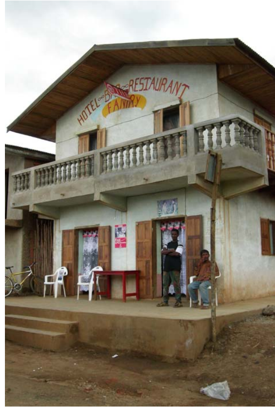
...ein Hotely , in dem man gut essen kann