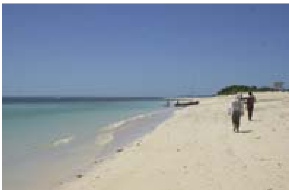
Strand auf Nosy Ve