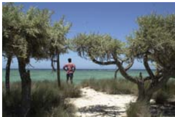
... Euphorbien und Blick auf Meer auf Nosy Ve