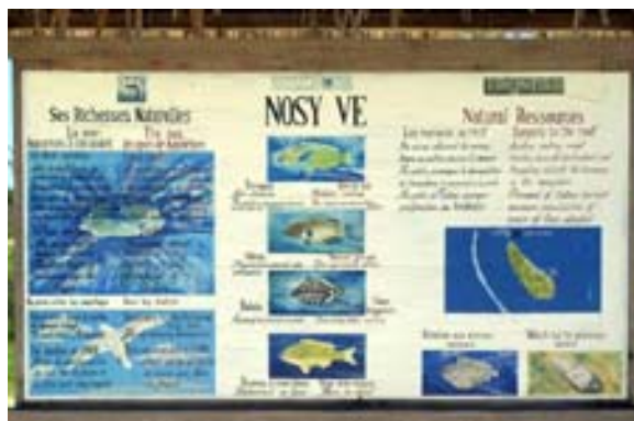
Tafel über die Fauna auf Nosy Ve

Gegenüber dem Strand liegt in ca. 4 Kilometern Entfernung die unbewohnte Insel „Nosy Ve“. Je nach der Jahreszeit brüten dort Vögel , welche sich beobachten und fotografieren lassen. Mit den oben umschriebenen Booten oder mit einer Piroge der Fischer kann man die Insel jederzeit erreichen und dort Picknick machen, baden, tauchen oder spazieren. Es ist ein Eintrittsgeld von FMG 10'000 / Ariary 2'000 / CHF 1.35 / EUR 0.80 pro Person zu entrichten. Schatten spendende Bäume – Euphorbien – sind nur wenige vorhanden. Gemäss der Auskunft unserer Kunden lohnt sich das Schnorcheln leider nicht, weil die Unterwasser-Welt schon weitgehend verstört sei.