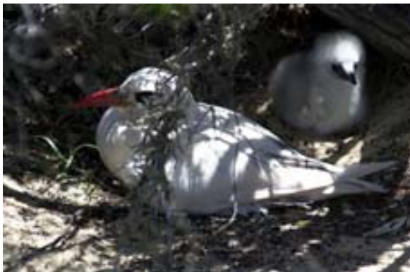
Brütender Paille en queue rouge mit Jungtier...