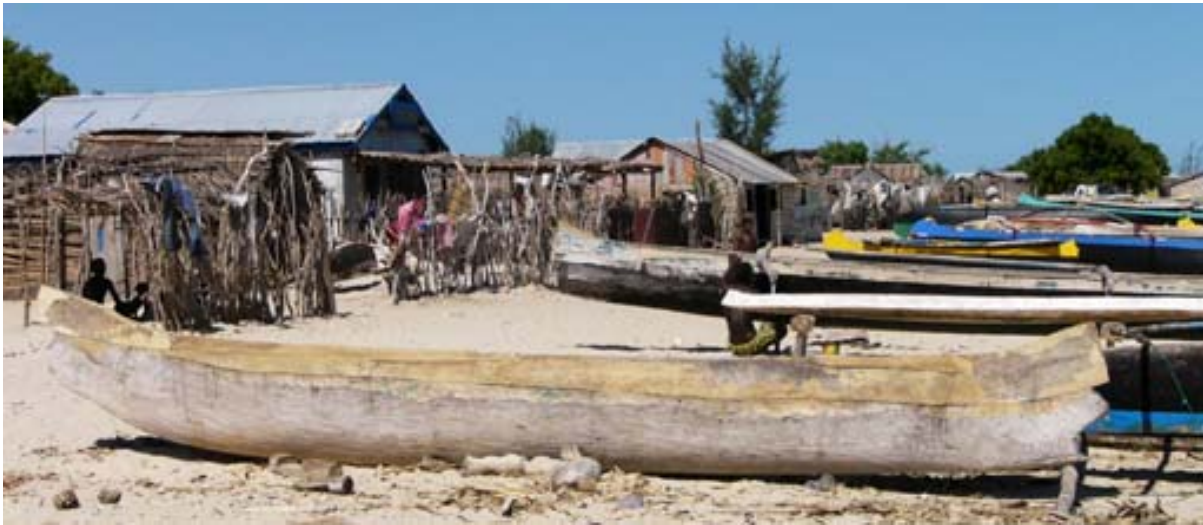
Hütten und Pirogen am Strand