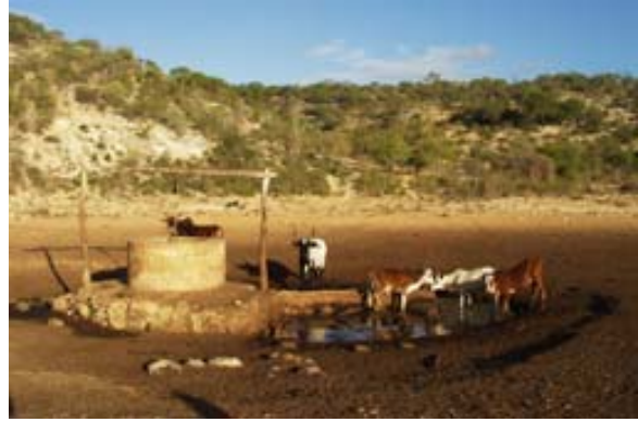
Brunnen mit Zebus