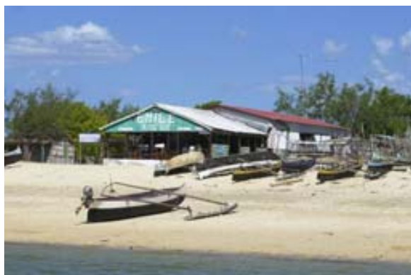
Hotel-Restaurant Chez Emil und...

Anbieter von Booten, Tauchausrüstungen . Wassersportgeräten sind vorhanden.