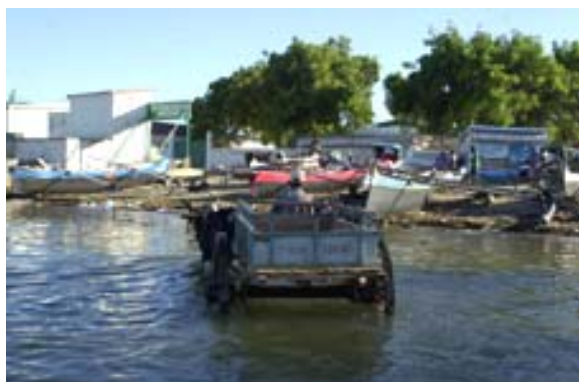
Einschiffen per Ochsenkarren in Tuléar

Im Südwinter sollen Delphine und Wale im Meer beobachtet werden können. Boote für den Fischfang und das Tauchen können gemietet werden. Auch werden Motorräder mit vier Rädern (Quattros) für Exkursionen entlang des Strandes oder ins Landesinnere vermietet.