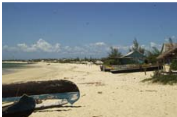
... Strand beim Hotel