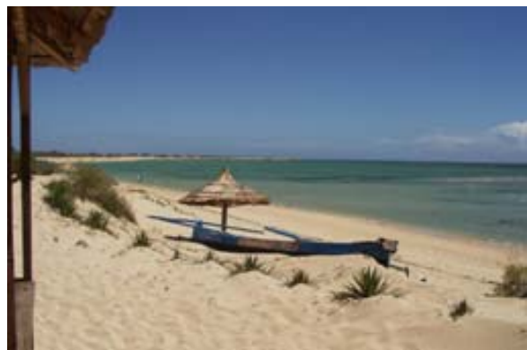
...Strand bei Hotel Longo Vezo