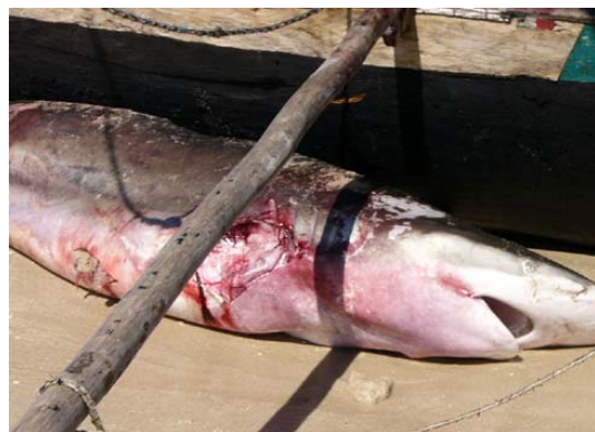
Gefangener Hai am Strand