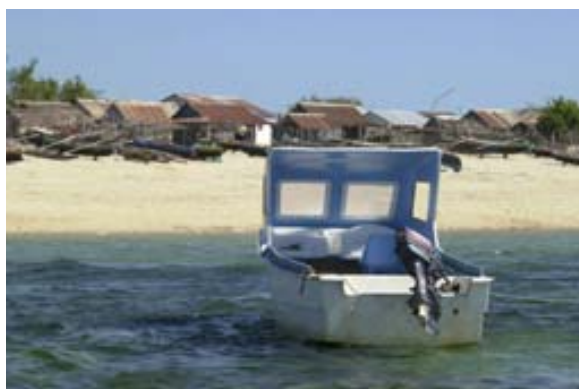
Langsames Boot und Dorf