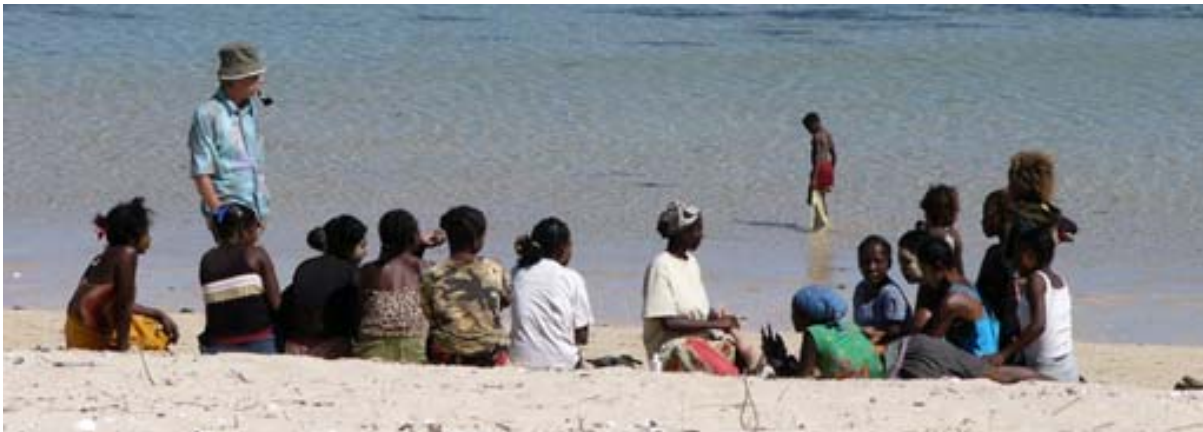
Taucht ein Weisser auf, versammelt sich alles und will verkaufen , quatschen oder massieren