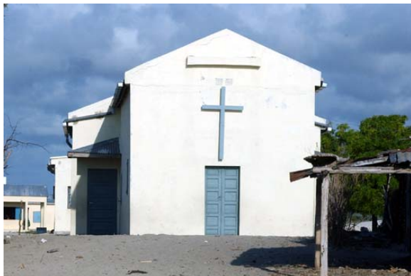
Kirche von Anakao