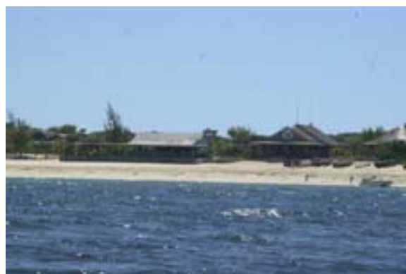
Hotelanlage am Strand

Was ist neu Inhaltsverzeichnis Stichwortverzeichnis