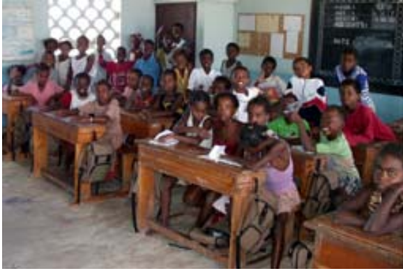
Schule im Ort