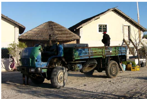
LKW des Prince Anakao für den Landtransport