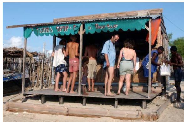
Super- Markt am Strand