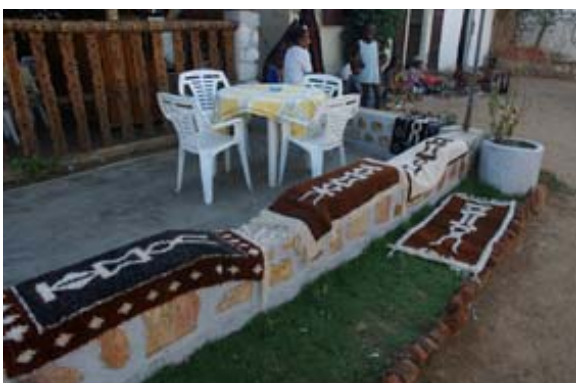
Teppichauslage vor dem Hotel Angora