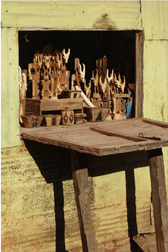
Laden mit Holzschnitzereien