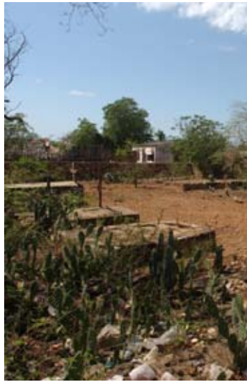
Friedhof mitten in der Stadt