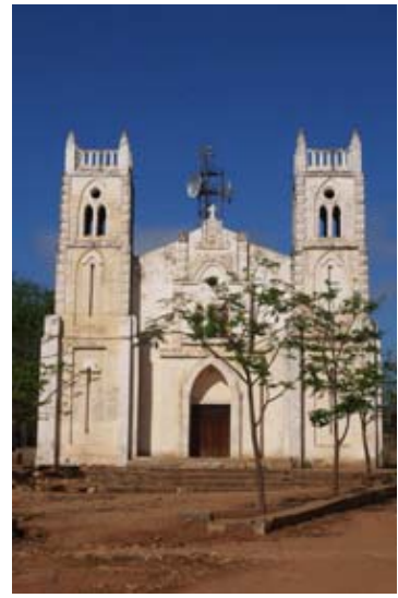
Kirche und Sendeturm