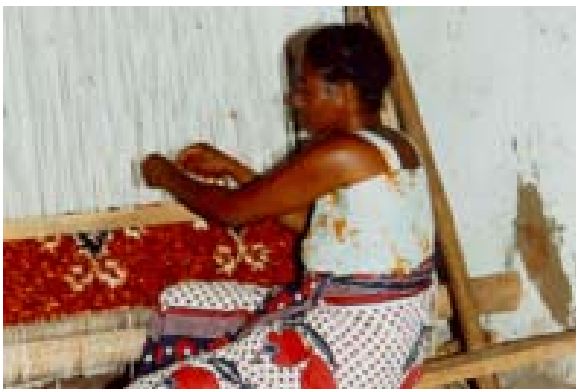
Frau in der Teppichweberei und...