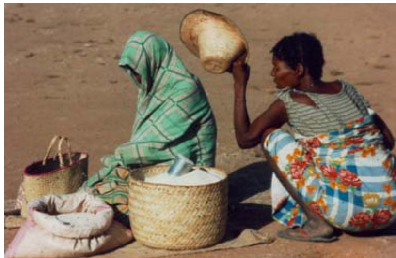
Reisverkäuferinnen von Ampanihy