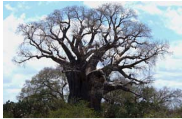
...dem welt-grössten Affenbrotbaum