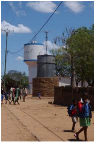
Wasserschloss ohne Wasser