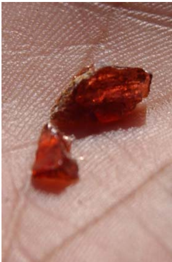
Grant gefunden am Boden