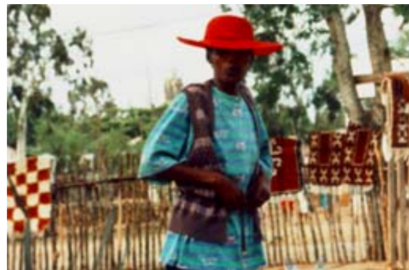
... Teppichverkäuferin vor dem Hotel