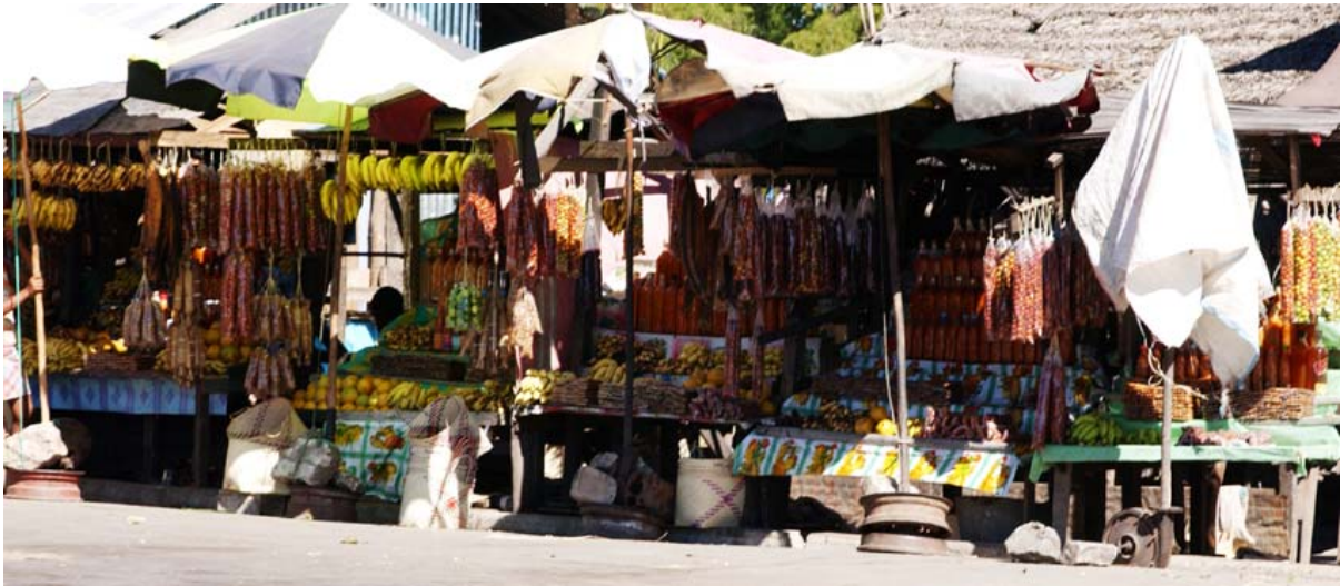
Stände mit Früchten