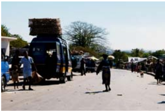
RN 4 nach Mahajanga

Kurz vor der Ortschaft, wenn man von Tana kommt, passiert man eine eindrucksvolle, schwarze Hängebrücke .