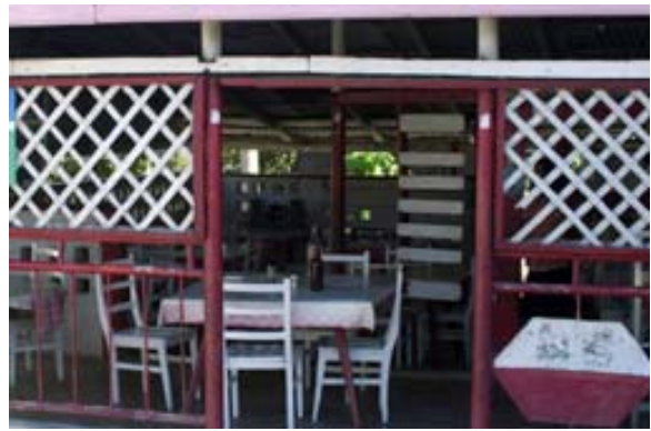
Zwei der zahlreichen...