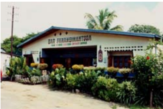
... Hotely die zum Einkehren einladen