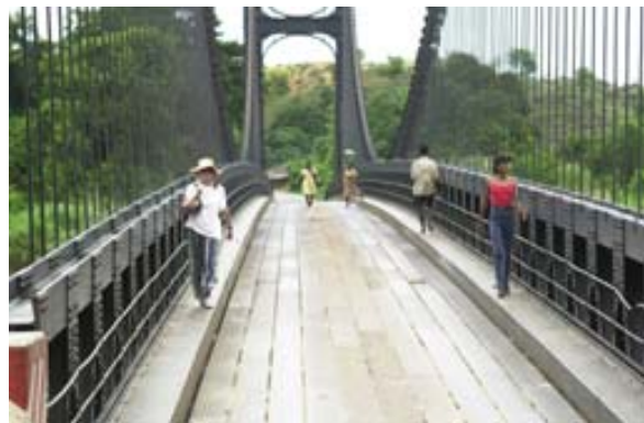
Hängebrücke auf der RN 4 vor dem Ort