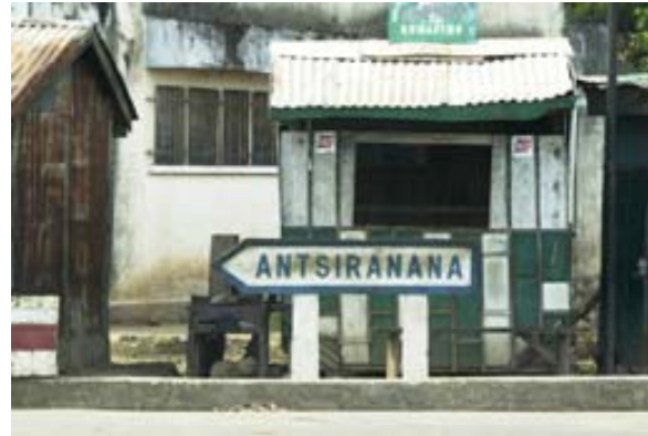
Wegweiser nach Diego-Suarez

Ambondromamy ist ein kleiner Ort an der Verzweigung der RN 6 (Ambondromamy) nach Diego-Suarez von der RN 4 Tana nach Mahajanga . Oft wird hier von den Reisenden eine Rast eingelegt und/oder etwas eingekauft. Zahlreiche Hotely sind vorhanden, die etwas zum Essen und Trinken anbieten.