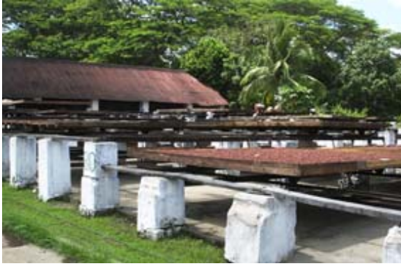
Trocknen der Kakaobohnen auf Schubladen