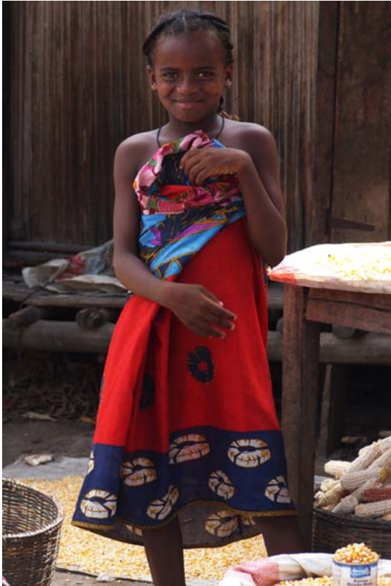
Mais-Verkäuferin auf dem Markt