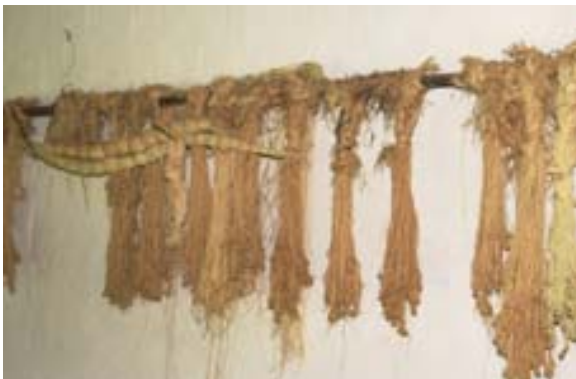
Baststränge der Raphia- Palme