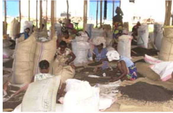
Sortieren der Pfefferkörner