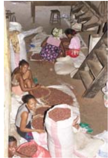
Verlesen der Kakaobohnen