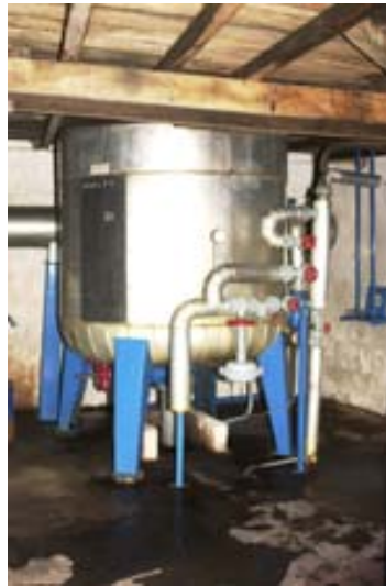
... und neue Anlage