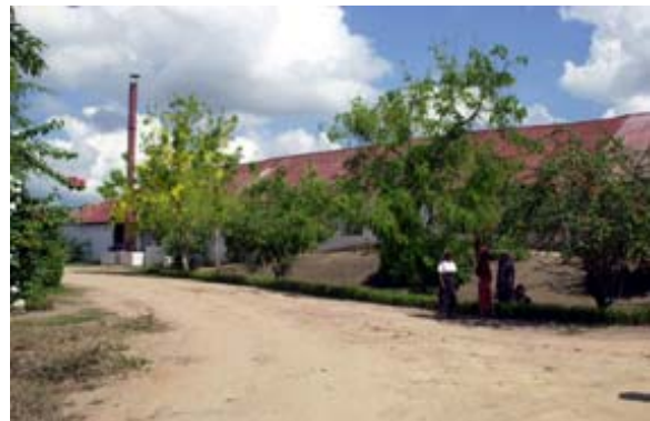
Destillerie der Millot S.A.

Auf Wunsch und gegen Voranmeldung kann die Firma Millot S.A. besichtigt werden. Es werden kultiviert und verarbeitet: Kakao (40% Bio-Kakao mit Qm-Zertifikat), Ylang-Ylang , Pfeffer, Bast , etherische Öle verschiedener Blüten, Gewürze . Der Umsatz lag 2001 bei 60 Milliarden FMG (ca. CHF 15 Millionen). Das einer französischen Firmengruppe gehörende Unternehmen beschäftigt 600 bis 800 MitarbeiterInnen. Die Destillerie wird mit einem alten Holzofen betrieben und fast alle Einrichtungen und Anlagen sind „ Museumsreif “, stammen sie doch aus den zwanziger Jahren des letzten Jahrhunderts.