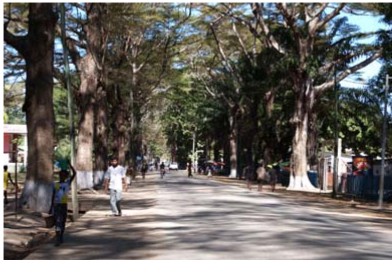
RN 6 vom Norden her quer durch Ambanja