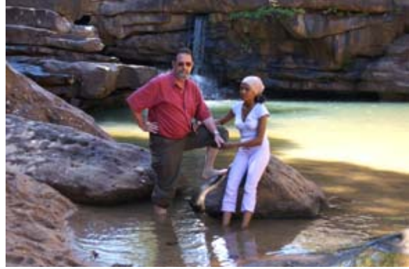
Wasserfall von Mahamanina

Vor dem Wasserfall wurde leider ein Staumauer aus Beton erstellt, um Wasser für die Reisfelder abzuzweigen.