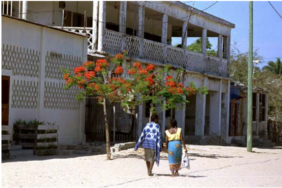
Haus an der Hauptstrasse