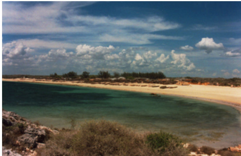
Strand in Andavadoaka