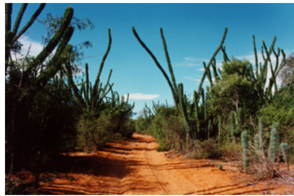
Sukkulenwälder südlich von Morombe

Was ist neu Inhaltsverzeichnis Stichwortverzeichnis