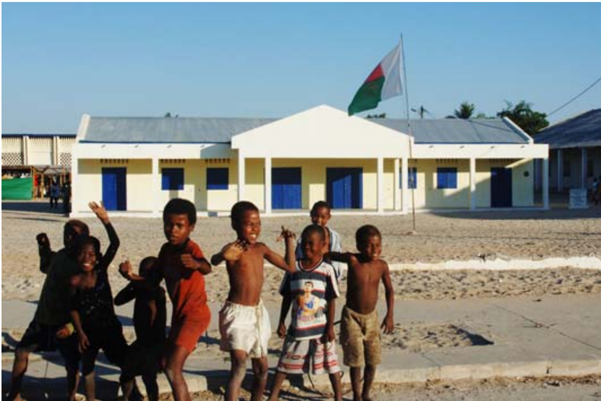
Kinder auf dem Hauptplatz vor dem Stadthaus