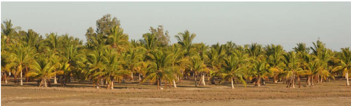
Kokos- Plantage hinter dem Flughafen