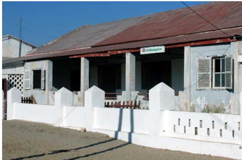
Vertretung der Air Madagascar