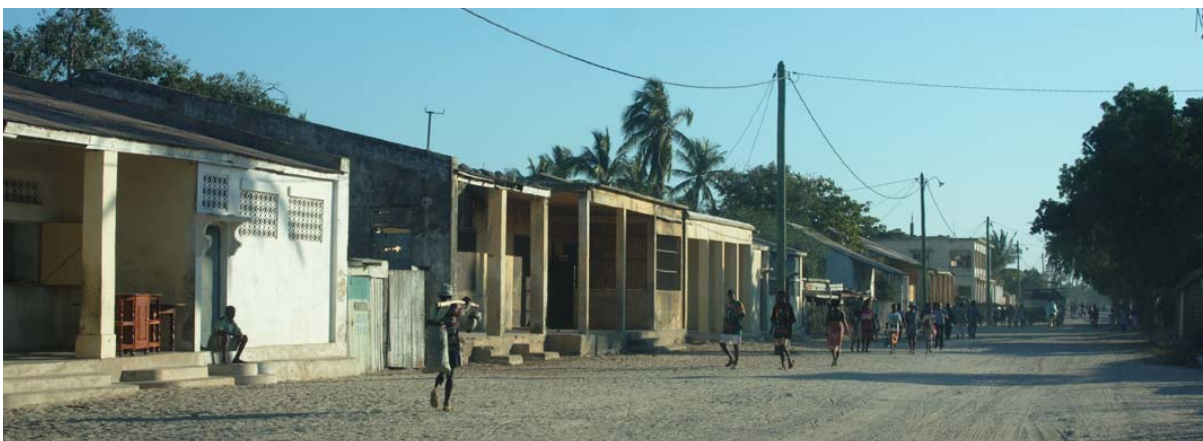
Hauptstrasse mit Geschäften

Was ist neu Inhaltsverzeichnis Stichwortverzeichnis