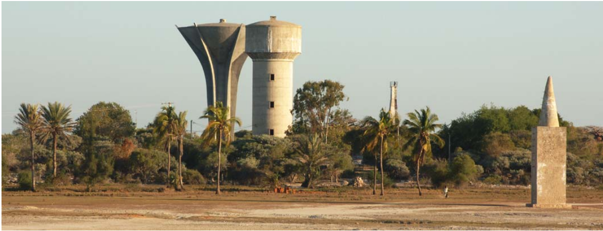
Skyline mit vier Türmen