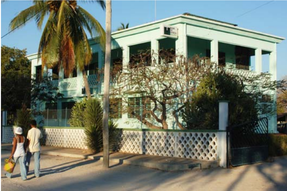
BOA – Bank of Africa

▶ Siehe auch unter „ Baden “ – Liste der Badestrände / Westen , unter „ Distanz- und Fahrzeit-Tabellen “ – Fahrzeiten sowie Tabelle „Distanzen – Süd-Westen“, Tabelle „Distanzen – Westen“, unter „ Geographie “ – Süden , Westen , unter „ Gewässer “ – Seen, unter „ Glossar “ – Morombe, unter „ Hotels “ – Liste der Hotels / Morombe , unter „ Hotelliste “ – Morombe, unter „ Infrastruktur “ – Bewässerung , unter „ Menschen und Gesichter “, unter „ Nachtleben “, unter „ Nationalstrassen “, unter „ Ortschaften “ – Morombe , Morondava , unter „ Pflanzen “ – Affenbrotbäume , Sukkulenten , unter „ Postleitzahlen “, unter „ Pflanzen “ – Affenbrotbaum , unter „ Reiserouten “ – Grosse West-Tour sowie und unter Zusatzprogramm Morombe , unter „ Touristik-Karten “ – Süden und Westen und unter „ Vegetationszonen “.