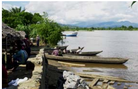
Flusshafen – Port Fluvial