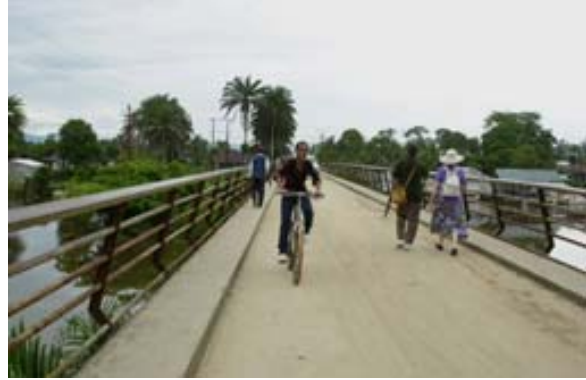
Brücke bei Hafen