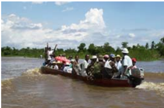
Die Piroge – der Taxi-Brousse der Gegend