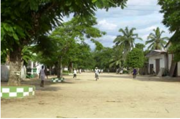
Seitenstrasse mit Inseln um die Bäume