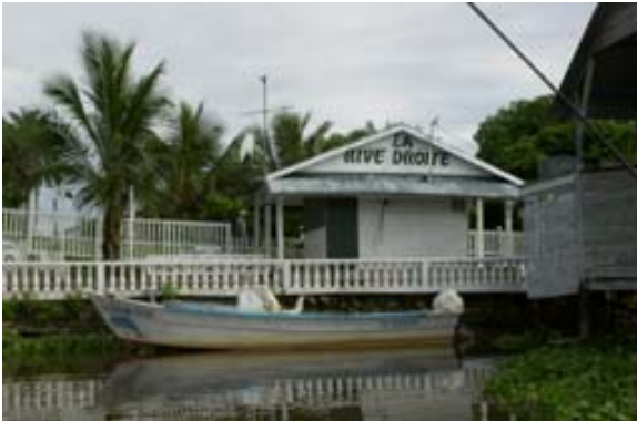
Restaurant La Rive Droite am Hafen