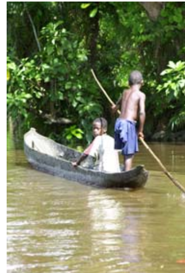
Piroge – das Fortbewegungsmittel für Gross und Klein