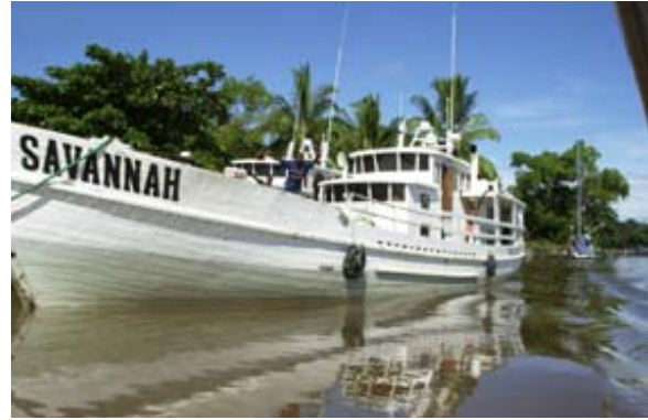
Schiff für Tamatave im Hafen