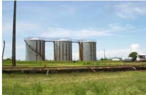
Tankanlagen ausserhalb der Stadt

▶ Siehe auch unter „ Baden “ – Liste der Badestrände / Osten , unter „ Baustil und Gebäude “, unter „ Camping “, unter „ Distanz- und Fahrzeit-Tabellen “ – Osten, unter „ Flughäfen “, unter „ Früchte “, unter „ Gebirge “, unter „ Geographie “ – Osten , unter „ Glossar “ – Androna, Antainambalana, unter „ Hotels “ – Maroantsetra , unter „ Hotelverzeichnis “ – Maroantsetra, unter „ Infrastruktur “ – Häfen , unter „ Inseln und Neben-Inseln “ – Nosy Mangabe, unter „ Klein- und Kleinst-Unternehmen “, unter „ Kirchen “, unter „ Klima “, unter „ Landwirtschaft “, unter „ Märkte “, unter „ Nationalstrassen “, unter „ Naturschutzpärke “ – Masoala und Nosy Mangabe , unter „ Ortschaften “ – Andranofotsy , Maroantsetra , unter „ Pflanzen “ – Bambus , Bäume , Regenwald , unter „ Piraten und Seeräuber “, unter „ Postleitzahlen “, unter „ Reis “, unter „ Reiserouten “ – Zusatzprogramm Tamatave , Motorrad-Touren , unter „ Spiel und Sport “, unter „ Sportaktivitäten “ – Tauchen , Wassersport , unter „ Städte “ – Tamatave , unter „ Stadtpläne “, unter „ Tiere “ – Fische und Meerestiere , Frösche , Lemuren , Wale , Zebus , unter „ Touristik-Karten “ – Osten , Norden , unter „ Trekking “, unter „ Verkehrsmittel “ – Lastwagen , Schiffe und unter „ Wahrzeichen und Highlights “ – Korallenriffe.