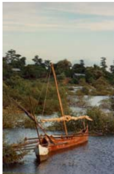
Schiff in der Lagune