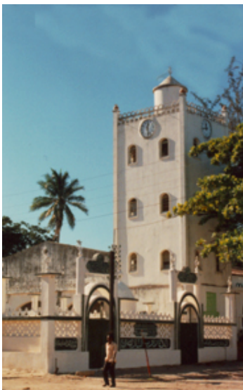
Viele Kirchen prägen...