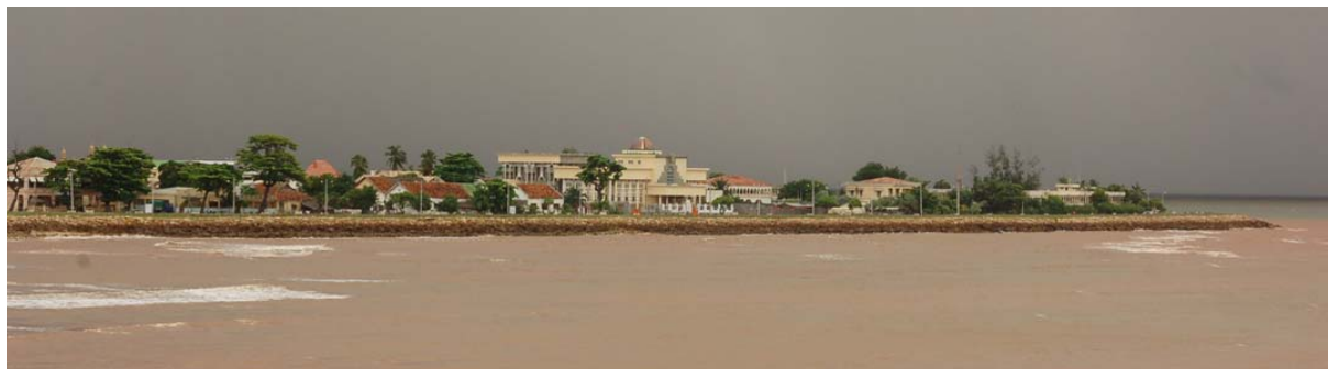
Skyline von Mahajanga

An der Strandpromenade ist abends meistens viel los. Neuerdings kann man dort auch mit einer Pferdekutsche kleine Rundfahrten machen oder Pferde zum Reiten mieten.