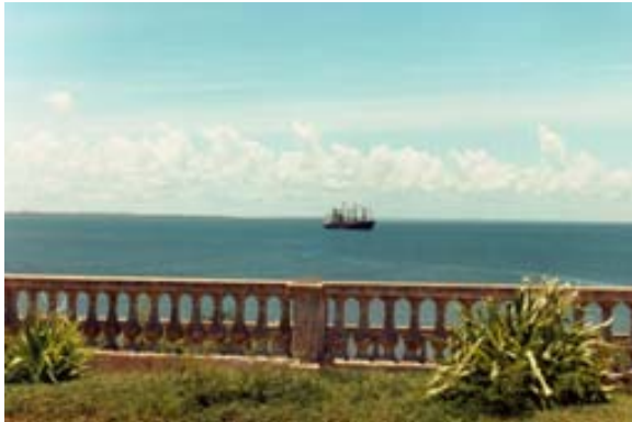
Aussichtspunkt am Meer