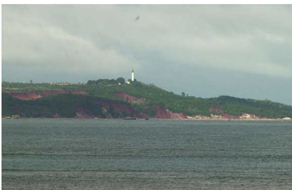
...und von Katsepy