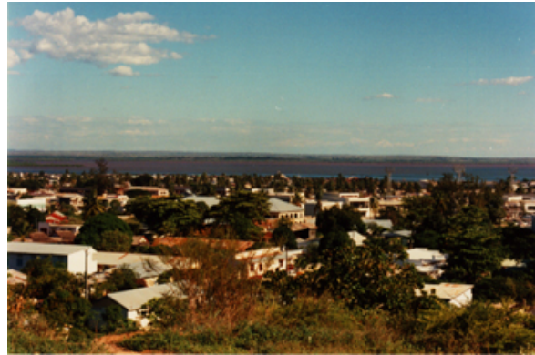
Blick über die Stadt