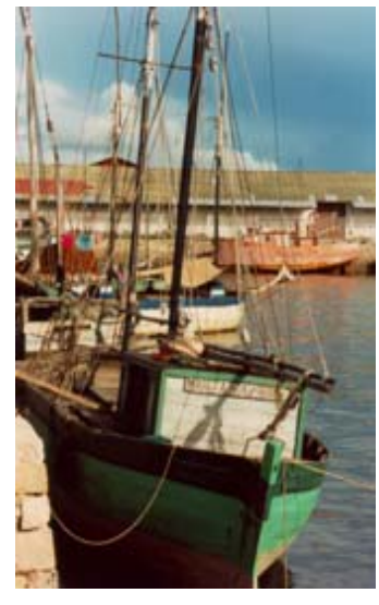
Barke im Hafen