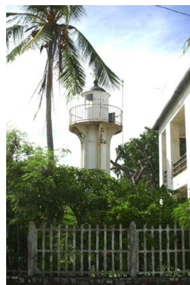
Leuchtturm von Mahajanga...