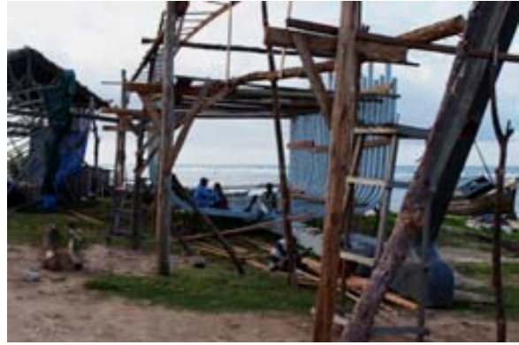
Skelett eines Schiffes im Bau