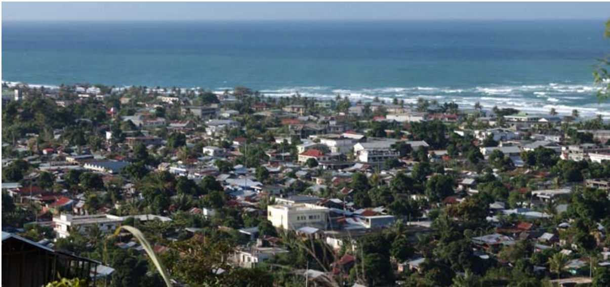
Antalaha vom Aussichtspunkt bei der meteorologischen Anstalt