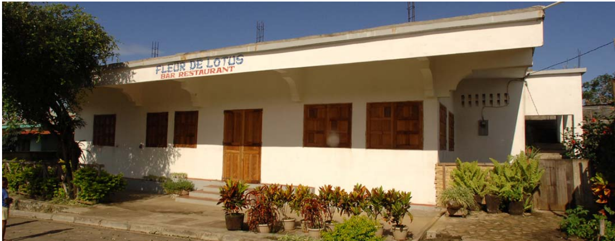
Restaurant „Fleur de Lotus“