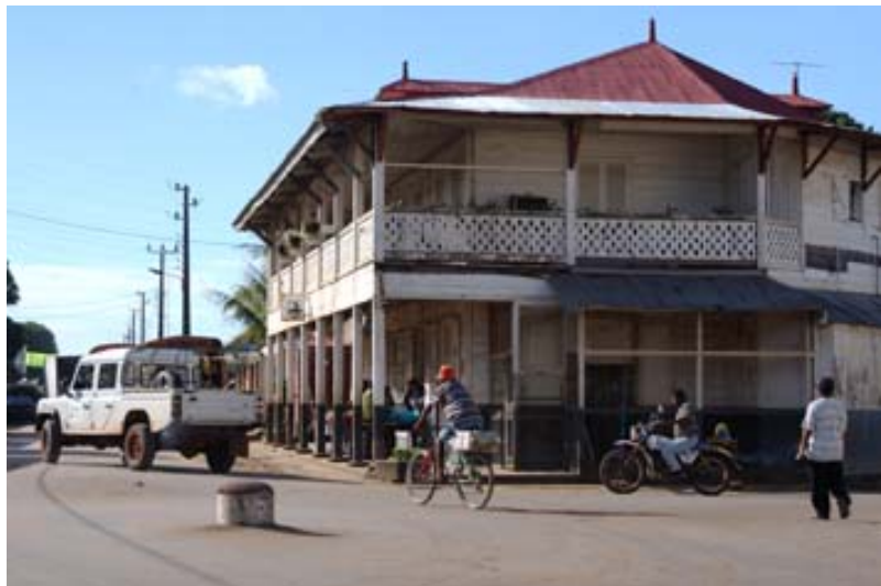
... Geschäftshaus im Kolonial-Stil im Zentrum