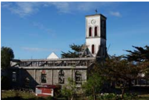
Vom Zyklon beschädigte Kirche (2001),