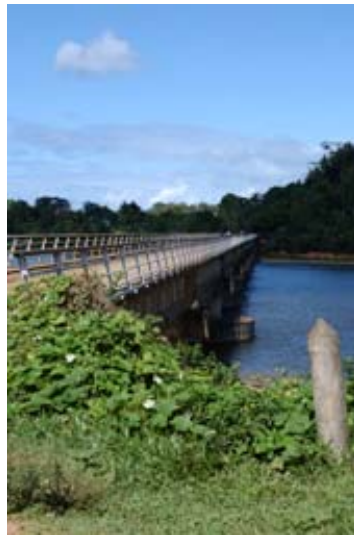
Brücke vor der Stadt