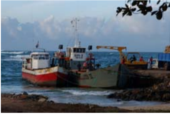
Alte Kähne im Hafen