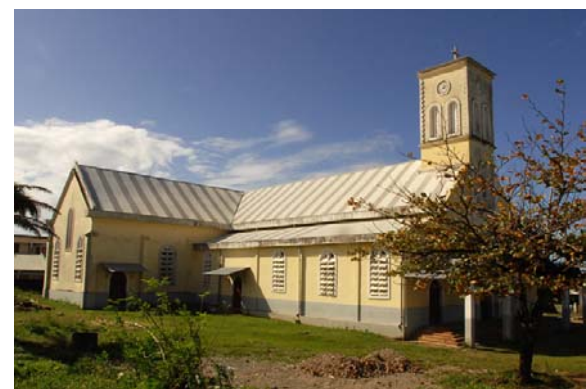
...,welche wieder repariert wurde (2007)