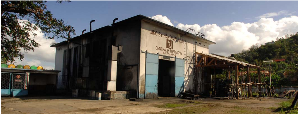
Energie-Zentrale des JIRAMA