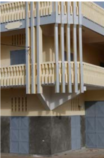
Moderner Neubau und...