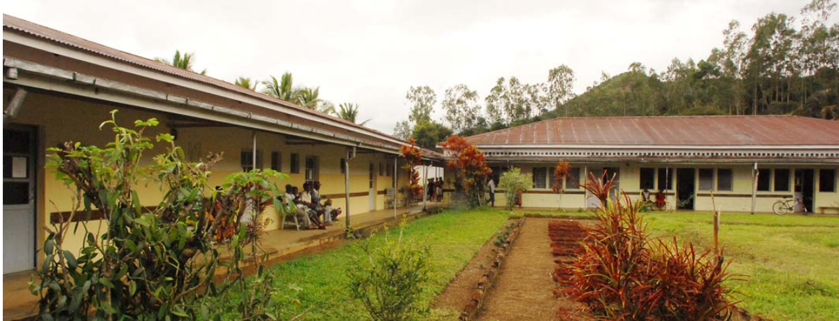
Gebäude des Krankenhauses

Ein Besuch ist auch ohne Voranmeldung möglich. Wer will. Kann alte Kleider oder Kinderspielzeuge mitnehmen und dort an die Patienten verteilen.