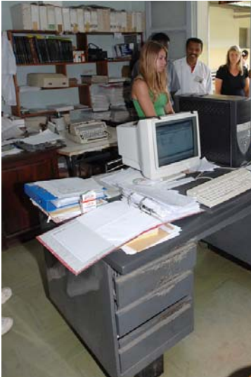
Verwaltung mit PC und...