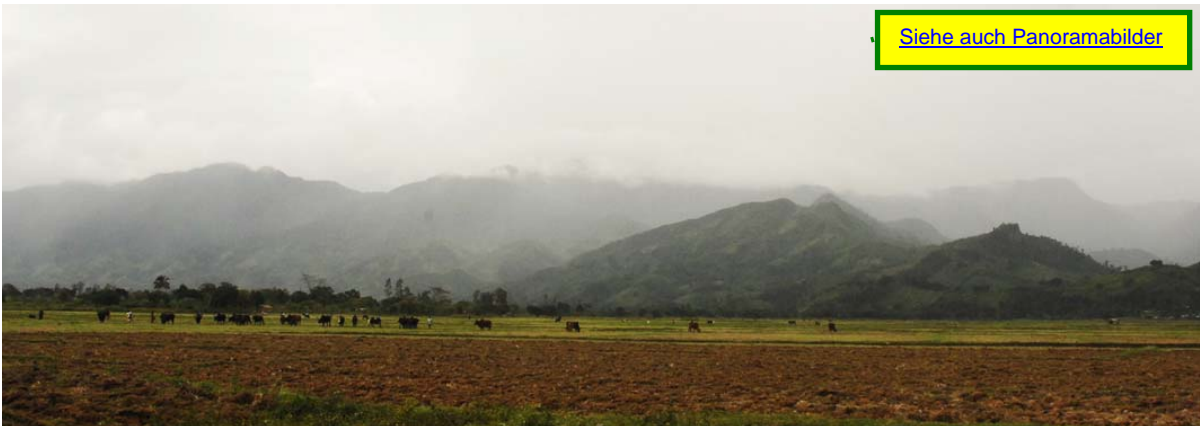
Blick in die fruchtbare, aber meist wolkenverhangene Ebene – siehe auch Panoramabilder