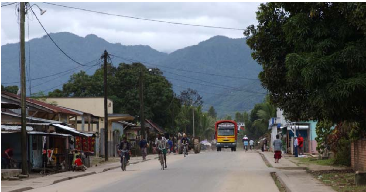
Eine der beiden Hauptstrassen die asphaltiert sind

Was ist neu? Inhaltsverzeichnis Stichwortverzeichnis