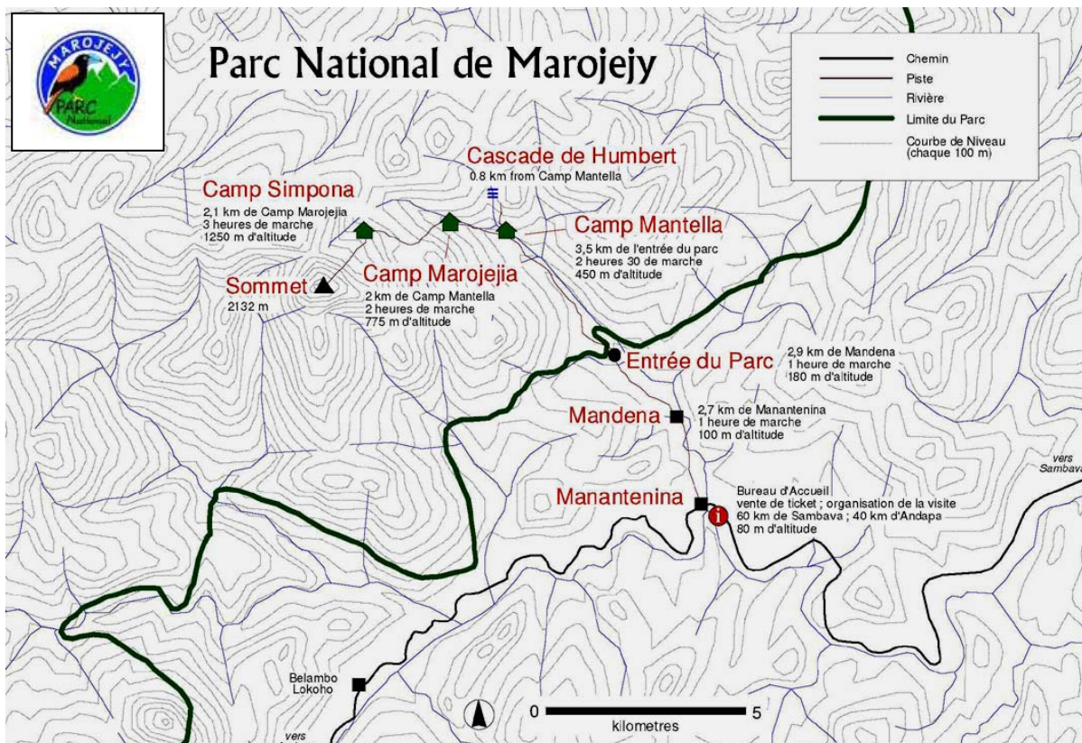
Detailkarte des Nationalparks Marojejy