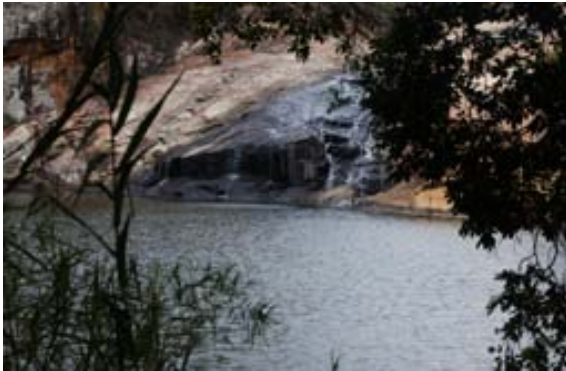
See, in welchem man Baden kann beim...