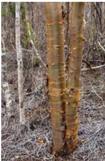
Arbres des Vazaha genannt, weil der sich schält. Dünne Rinde wird zum Abdichten genutzt