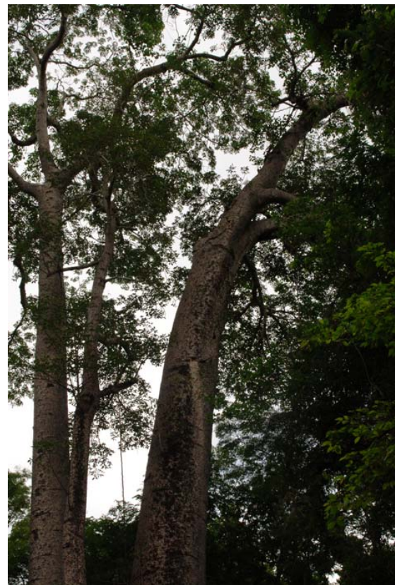
.. nur hier ( Adansonia madagascariensis Var. boinensis )

Was ist neu? Inhaltsverzeichnis Stichwortverzeichnis