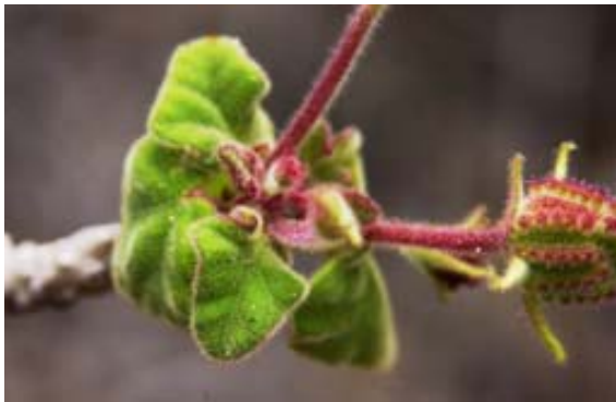
Nutzpflanzen für die Herstellung von Haarwaschmittel und...