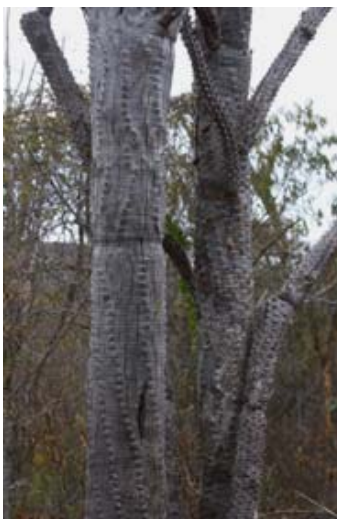
Didiereaceae, aus welcher Bretter hergestellt werden