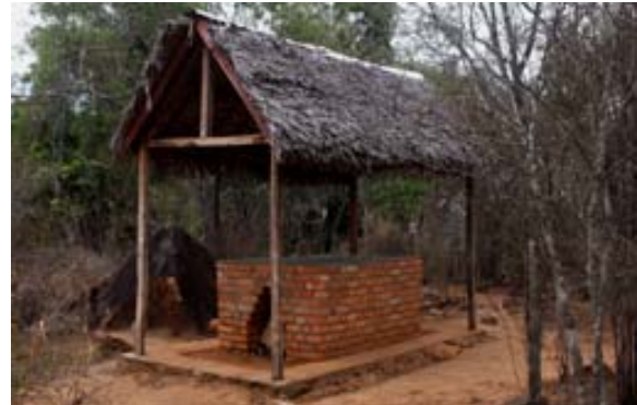
... Camping -Platz