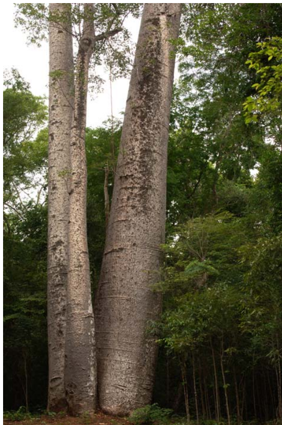
Diese Art von Affenbrotbäumen findet man auf der ganzen Welt...