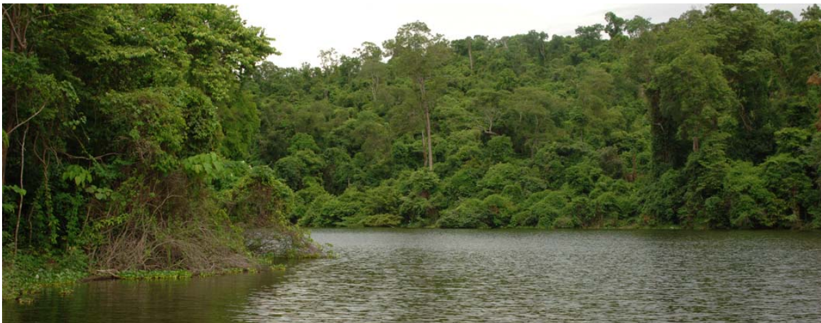
Dicht bewachsene Ufer des Sees