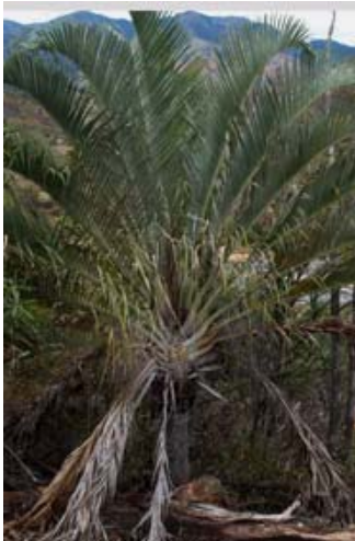
Ravenala ( Dypsis decaryi ) mit dreieckigem Stamm, endemisch in der Gegend von Fort-Dauphin