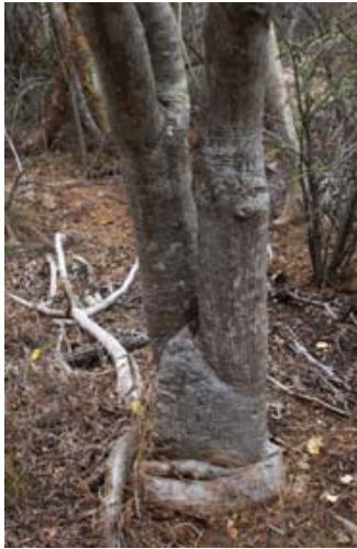
Baum der nackten Frau