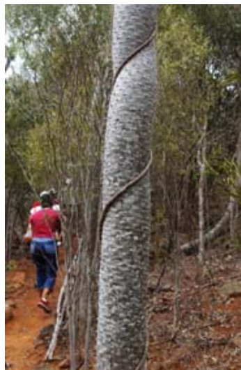
Würgliane an Sukkulente