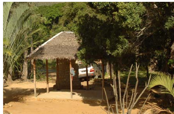
...Empfangsgebäude im Teil Tsimelahy