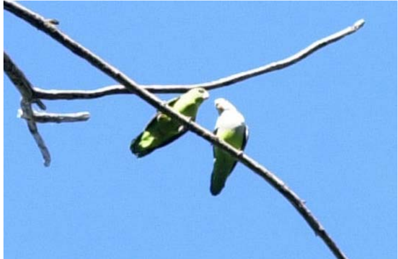
Papageienart „Die Unzertrennlichen“ in Ankarafantsika