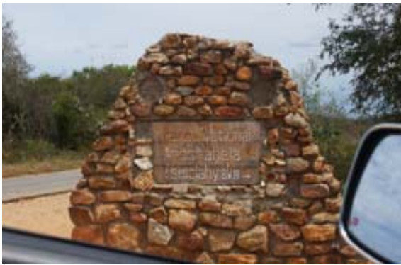
Wegweiser an der RN 10 und...