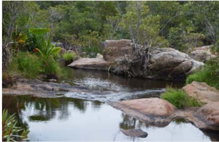
Flusslauf unterhalb des Sees