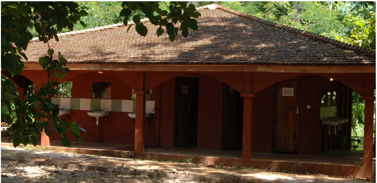
Sanitäre Anlagen des Campingplatzes