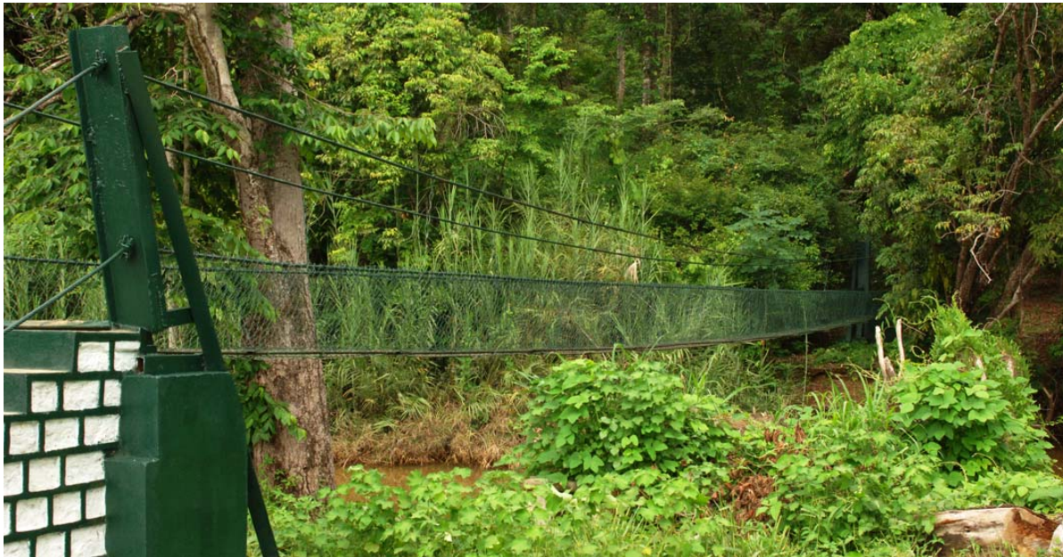
Seilbrücke aus Metall für zu den Baobabs