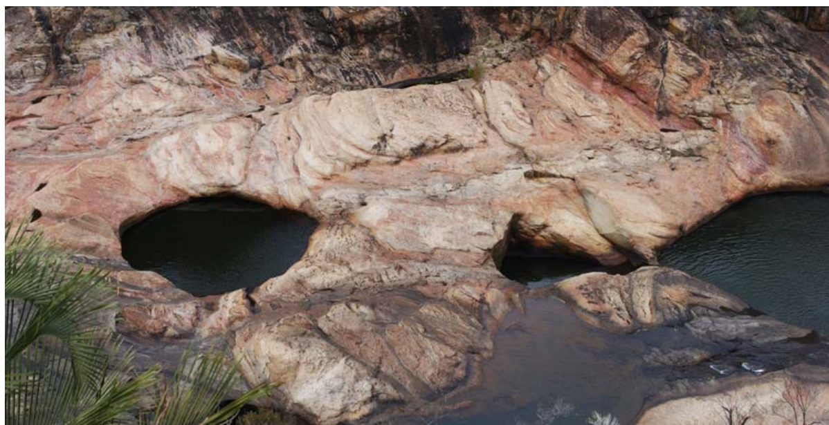
Piscine naturelle im Tal, um welches der Rundgang führt

Was ist neu? Inhaltsverzeichnis Stichwortverzeichnis