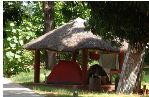
Campingplatz in Ankarafantsika

Es werden neun Arten von Rundgängen angeboten.