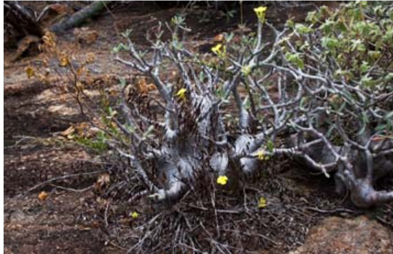
Grosse Pachypodium in Blüte