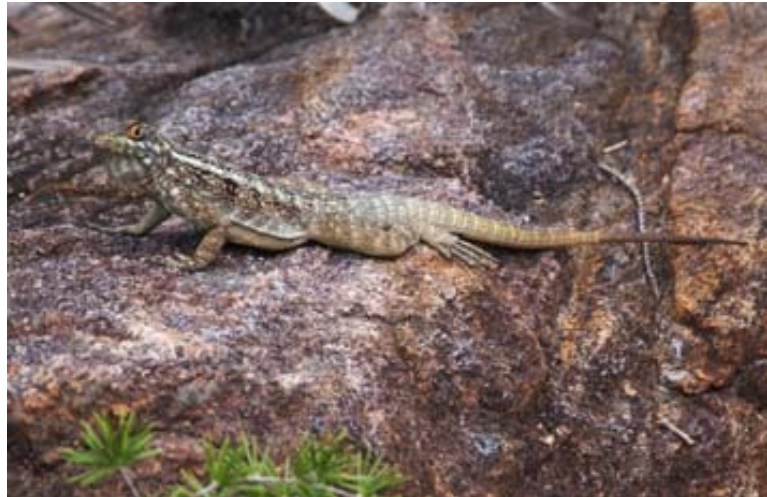
...Sukkulente und Echse