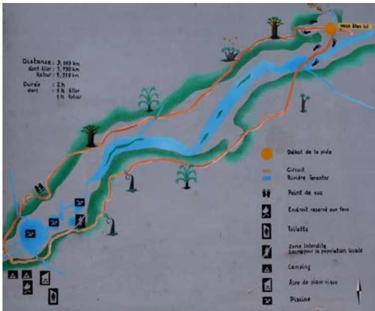
Karte des Rundganges in Tsimelahy