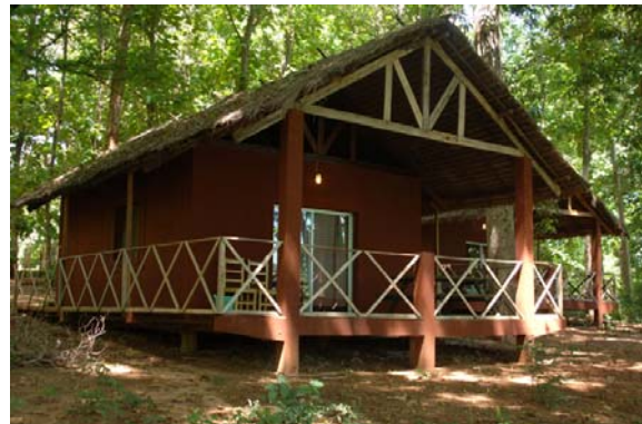
Bungalows für Übernachtungen