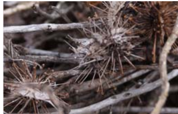
...stachelige verdorrte Früchte mit Widerhaken, die als Mausefalle dienen