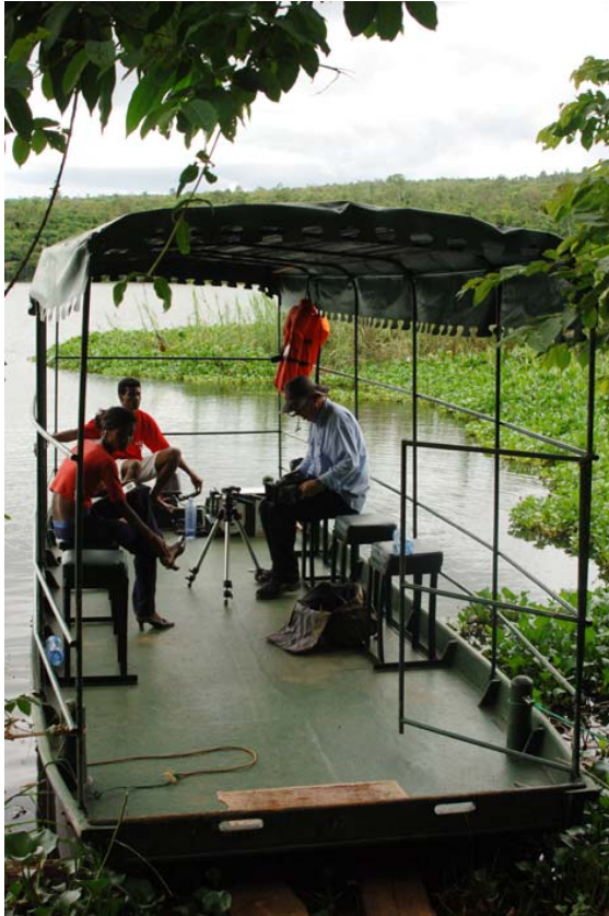
Boot für die Fahrten auf dem See Ravelobe