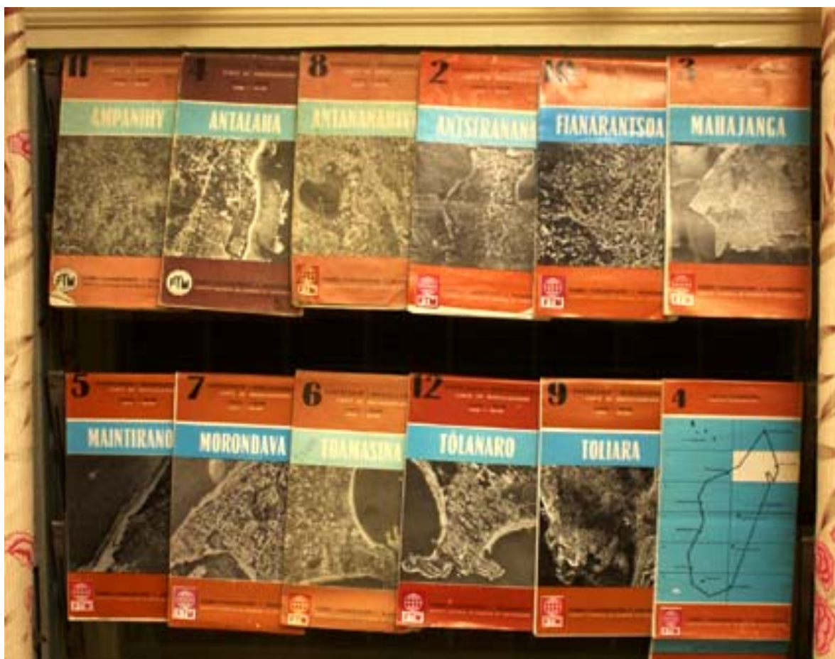
Die zwölf Strassenkarten von Madagaskar