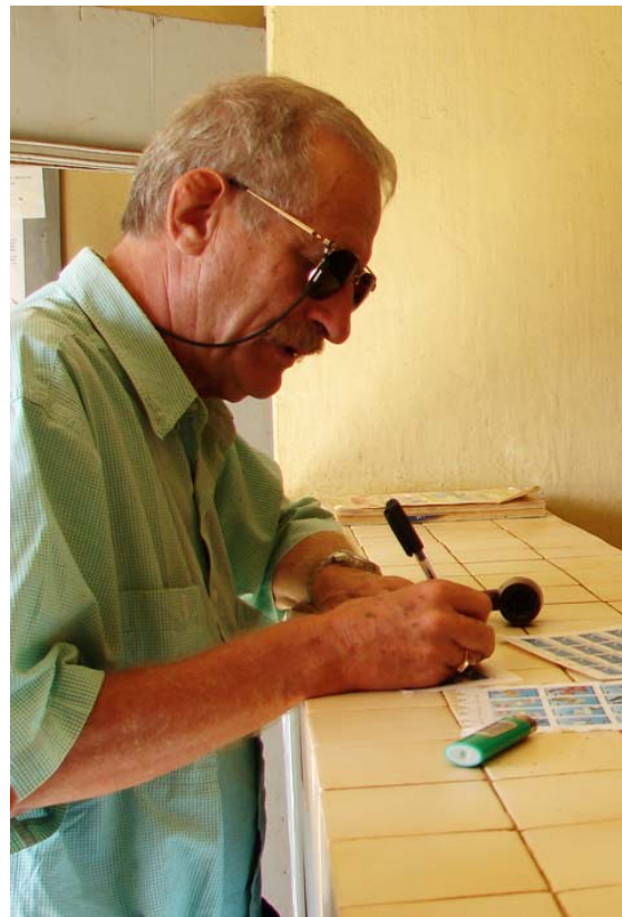
Verfasser beim Kaufen von Marken in Anivorano Nord