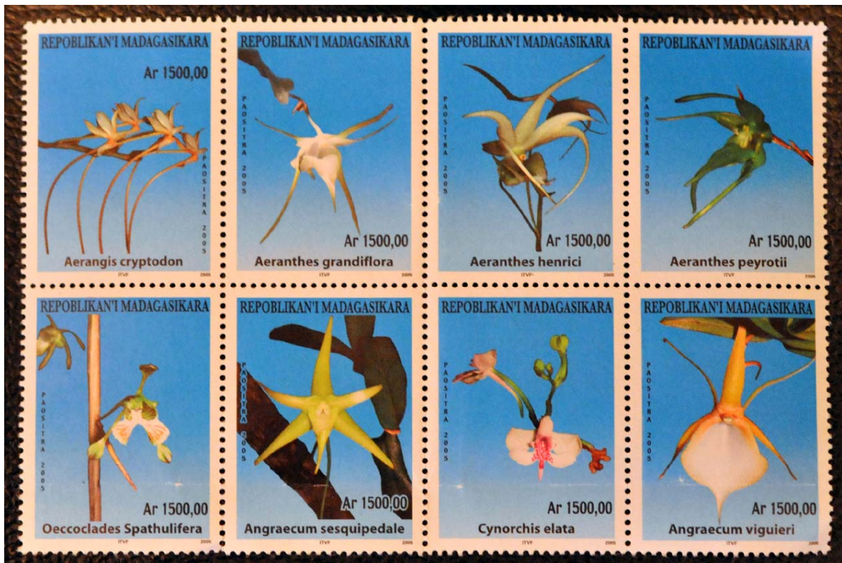
Orchideen auf achter Block

Was ist neu Inhaltsverzeichnis Stichwortverzeichnis