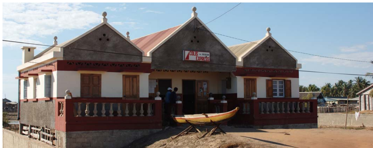
Colis express – ein Konkurrenzunternehmen der staatlichen Post – in Morondava