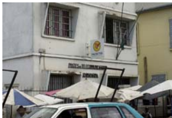
...und Poststelle in einem Vorort von Antananarivo