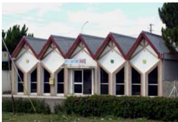
Moderne Poststelle beim Einkaufszentrum CORA

Meistens sind zwei unterschiedliche Briefkästen vorhanden. Einer für Inlandpost und einer für Versendungen ins Ausland . Briefe, welche auf jeden Fall ankommen sollten, sind obligatorisch „Eingeschrieben / Recommandée“ zu versenden.