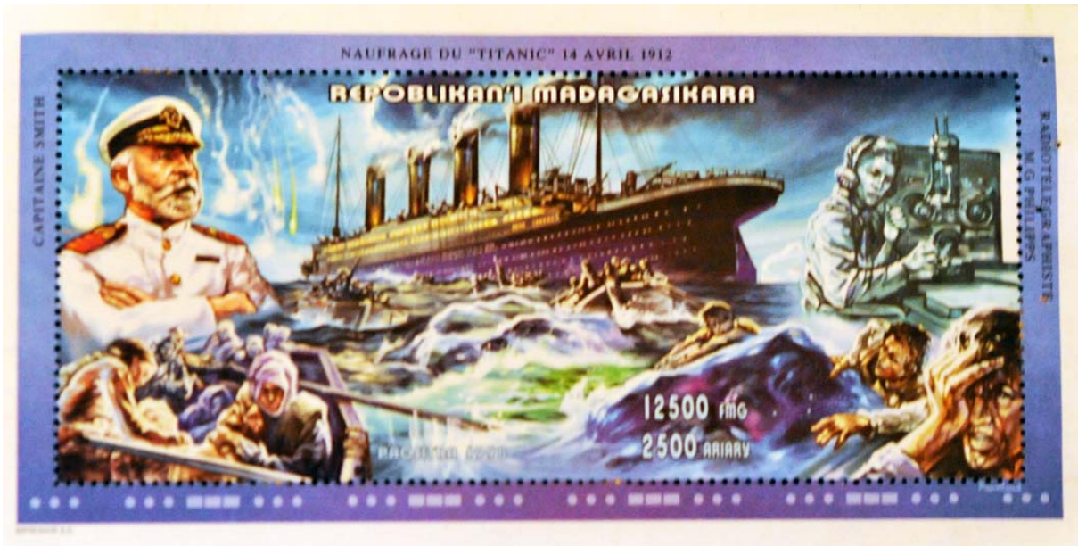
Untergang der Titanic - Sondermarke

Die Madagassische Post gibt regelmässig Sondermarken heraus. Wir denken, dass diese als Souvenirs oder für Markensammler, deren Sammlung nach Sujets angelegt ist, geeignet sein können. Hier ein paar Beispiele: