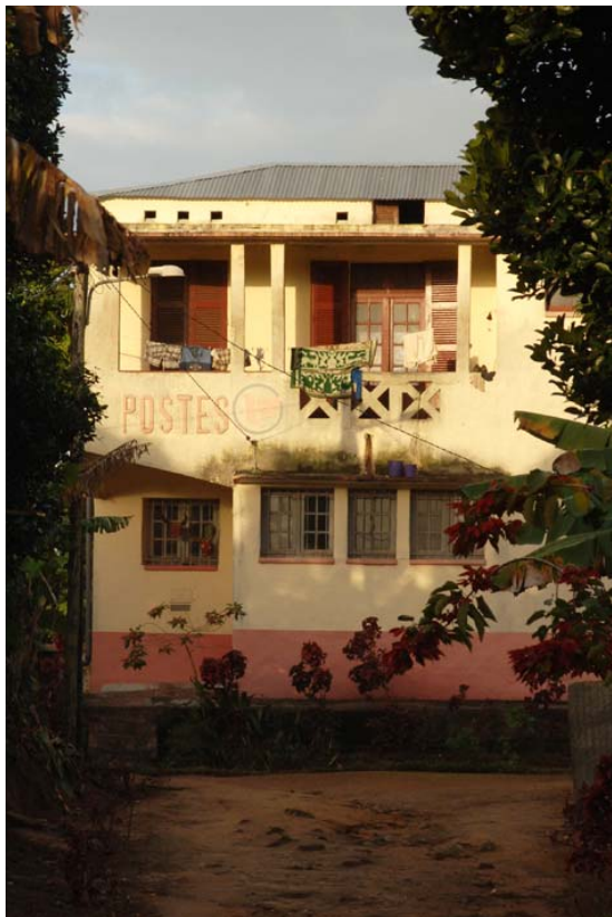
Verschlafene Poststelle von Nosy Varika

Die Briefmarken sollte man immer am Schalter abstempeln lassen. Briefe und Postkarten, deren Briefmarken nicht abgestempelt sind, werden von den Beamten „ geklaut “, denn nicht entwertete Briefmarken stellen Bargeld dar und das ist echt rar! Neuerdings ist bei grösseren Poststellen auch Couverts mit aufgedruckter Versandtaxe zu kaufen, welche das Markenklau-Problem elegant lösen. Wenn eine Sendung in jedem Fall ankommen muss, wird der Versand der DHL empfohlen. Diese Organisation ist auch in Tana vertreten.