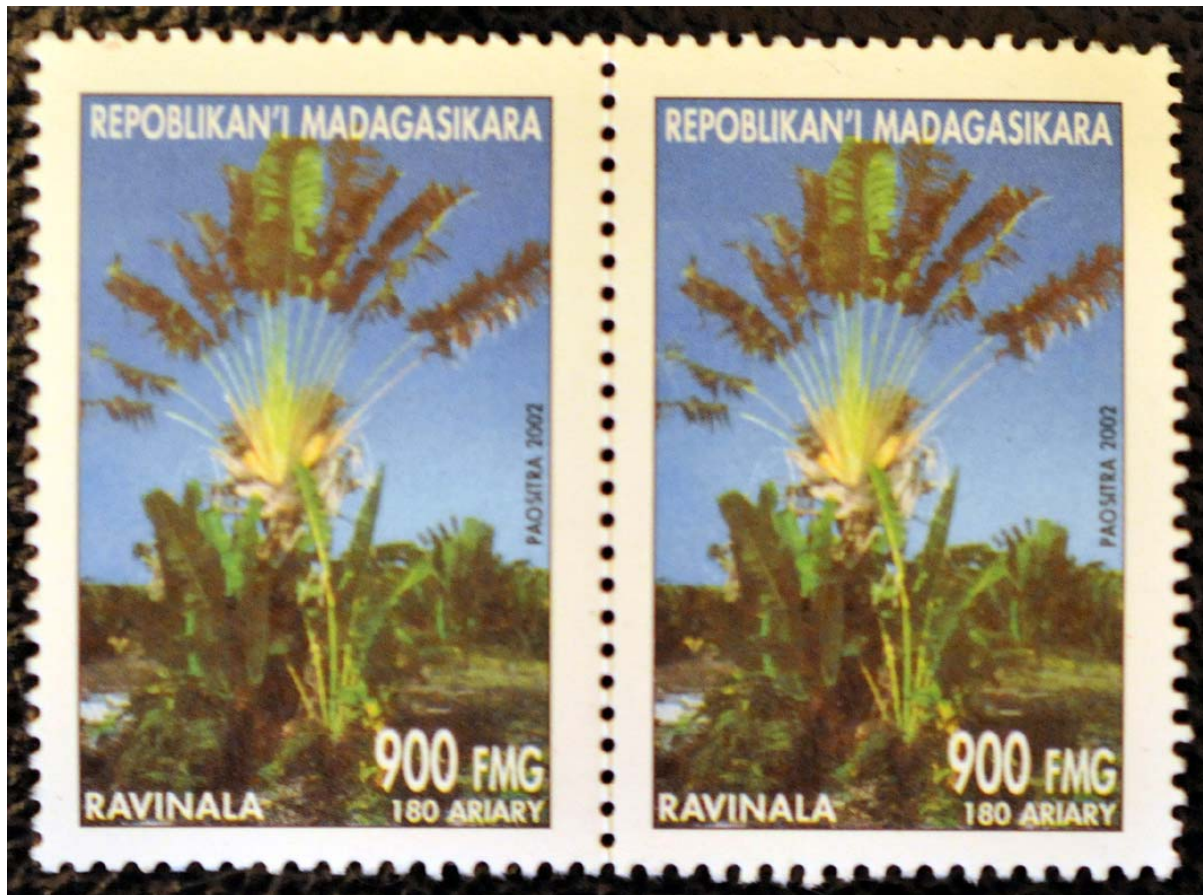
Baum des Reisenden ( Ravinala ) – eines der Wahrzeichen von Madagaskar