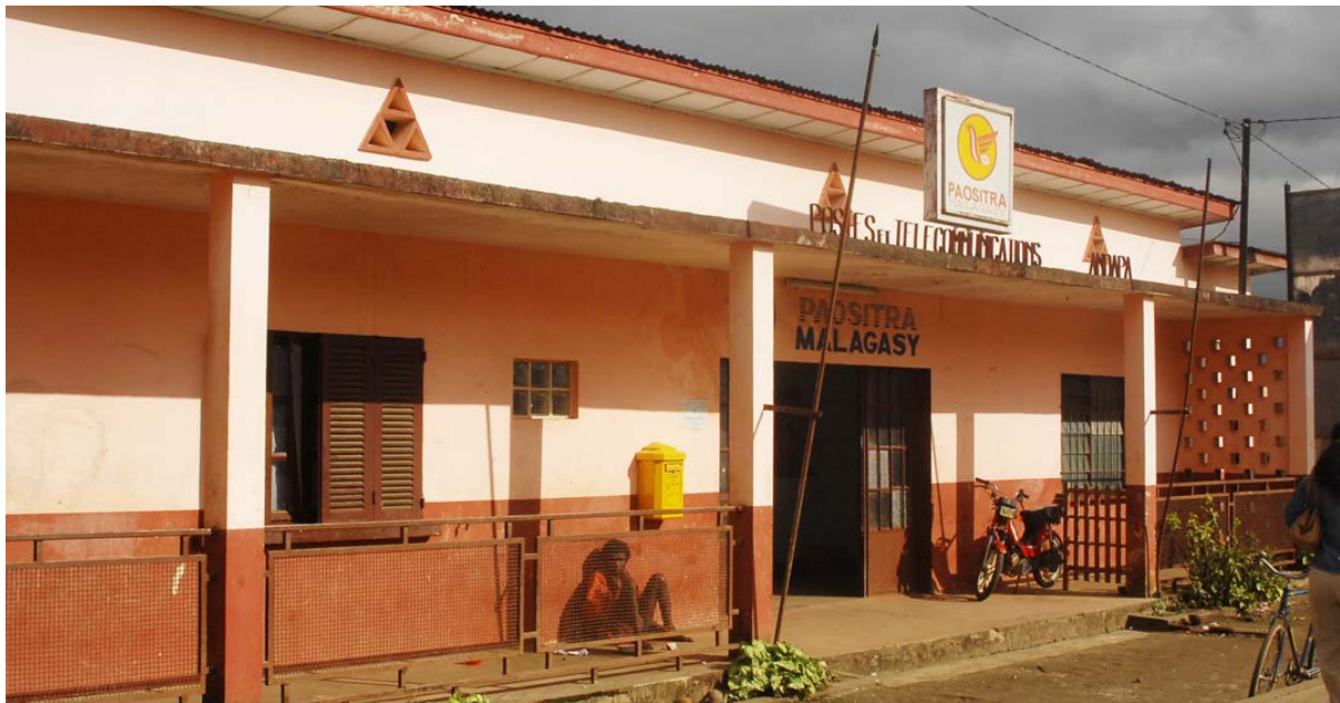
Poststelle in Andapa