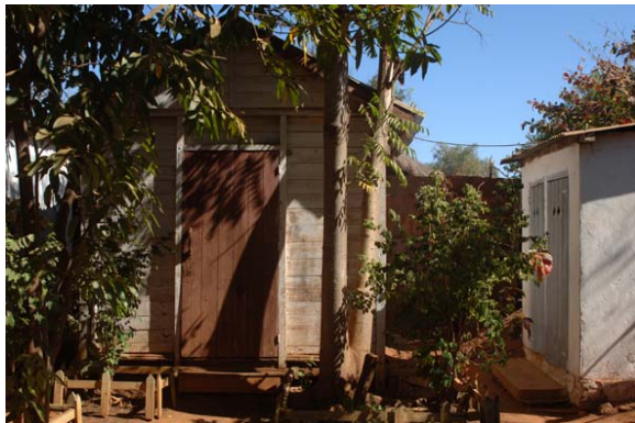
Einfache Bungalows ohne WC und Dusche