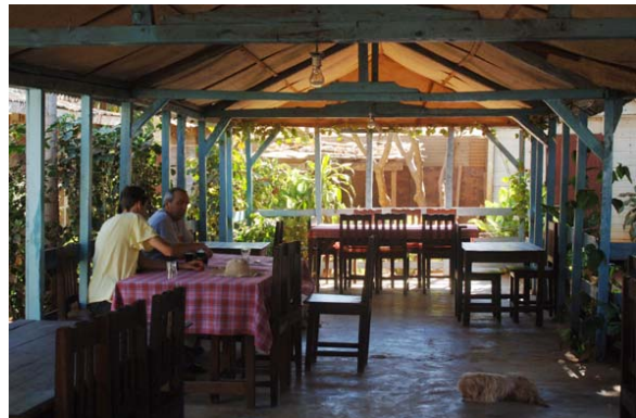
Restaurant mit guter Küche

Im Laden des Hotels kann auch eingekauft werden. Die Auswahl an Konserven und Esswaren ist beachtlich. Dies ist insbesondere dann wichtig, wenn man auf dem Weg zum Mangoky campieren muss, weil das Hotel voll belegt ist.