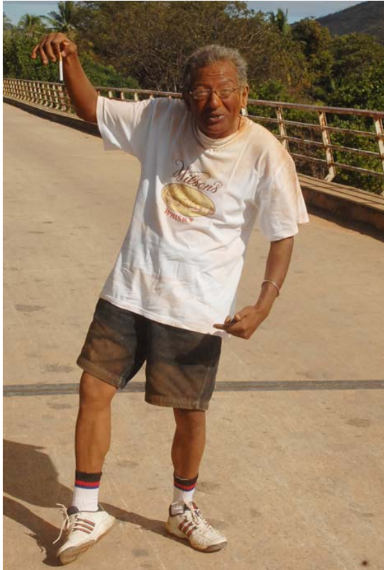
Chauffeur DERA nach Staubiger Fahrt