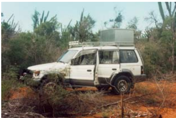
Alter Pajero in den Sukkulenten von Ifaty

Die Verbindung zwischen dem Leitfahrzeug und den anderen Fahrzeugen wird mit Funkgeräten aufrecht erhalten.