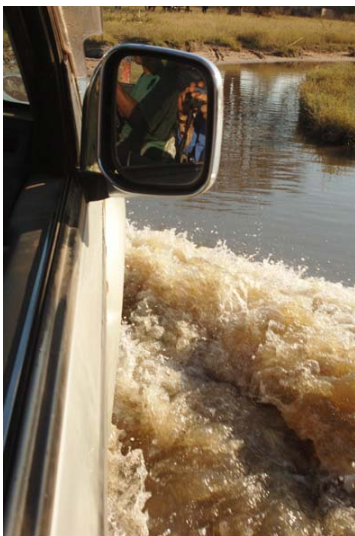
...bei der Flussdurchquerung ...