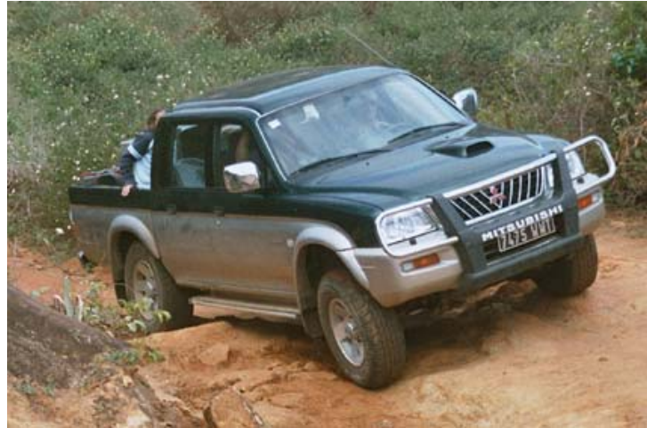
...Mitsubishi mit Ladebrücke

Der Pajero kann je nach der Anzahl Passagiere und des entsprechenden Gepäcks auch mit einer Kiste aus Aluminium auf dem Dachträger ausgerüstet werden.