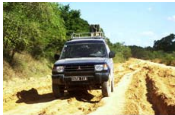
Zugemieteter Pajero auf der RN 6