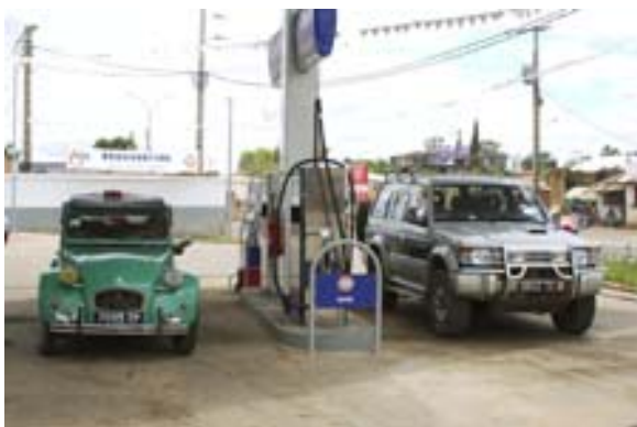
Pajero an neuer Tankstelle und