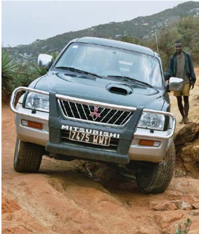
Der neue Kombi L 200...