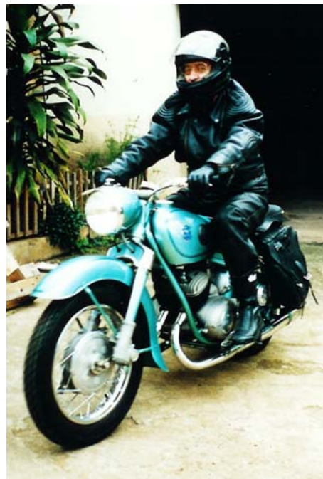
Motorrad Adler des Verfassers

Weiter hat der Verfasser sein Motorrad der Marke Adler – Jahrgang 1955 – nach Madagaskar importiert. Auf besonderen Wunsch kann dieses für Ausfahrten auf guten Strassen im Hochland zur Verfügung gestellt werden.