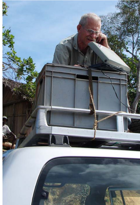
Verfasser beim Telefonieren mit dem Satellitentelefon