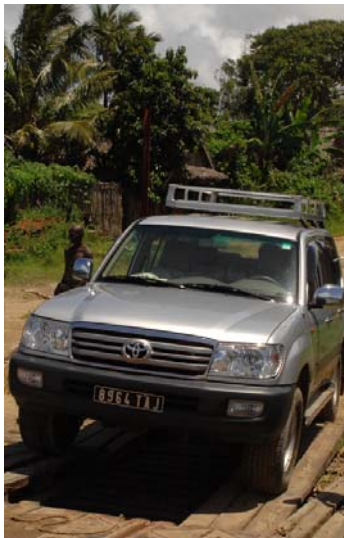
...auf der Fähre nach...