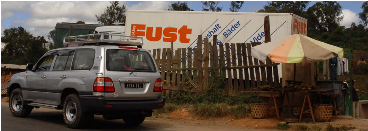
Der neue Toyota auf der RN 2 vor einem Veteranen der Firma Fust,...