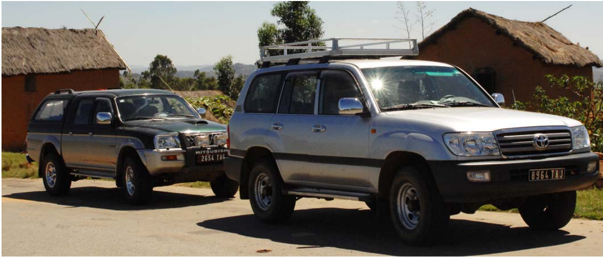
Toyota und Mitsubishi L 200