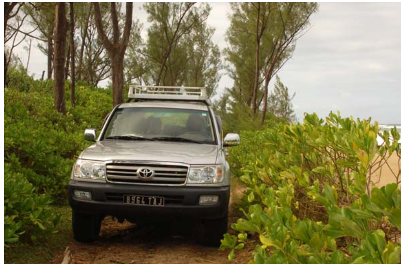
...nach Ambila Lemaitso sowie an dessen Strand