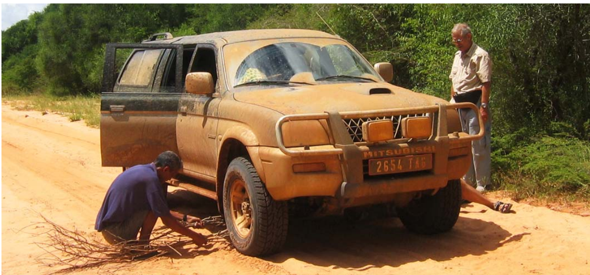
Da meinte der Kunde: Nun hat er endlich die notwendige „Patina“!