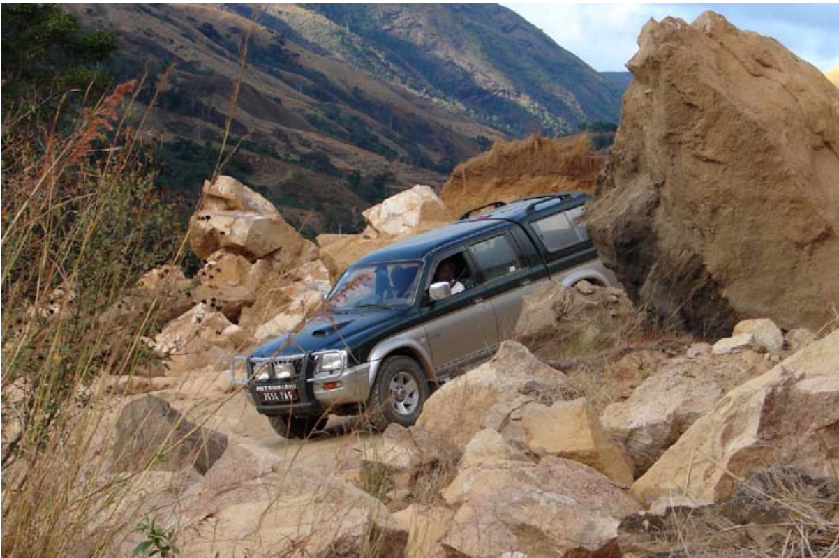
L200 beim Durchqueren eines Erdrutsches an der RN 31 nach Bealanana