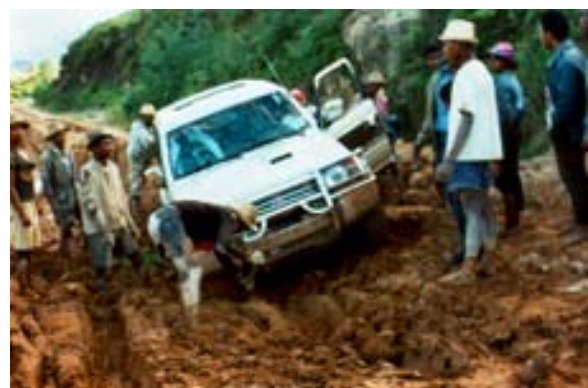
...im Schlamm stecken geblieben

Was ist neu Inhaltsverzeichnis Stichwortverzeichnis