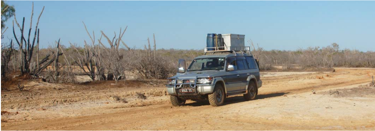
Mitsubishi L 200 auf der Piste bei Belo-sur-Mer ,...