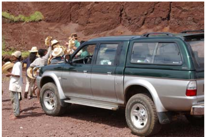
...nach Bezaha Mahafaly und am Lac Tritriva bei Antsirabe