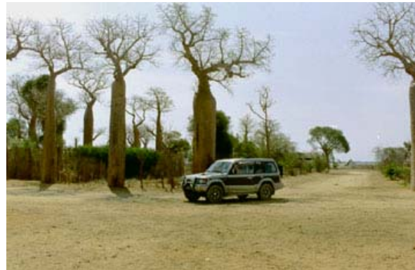
Pajero im Baobabwald bei Belo-sur-Mer

Die Verbindung zwischen dem Leitfahrzeug und den anderen Fahrzeugen wird mit Funkgeräten aufrecht erhalten.